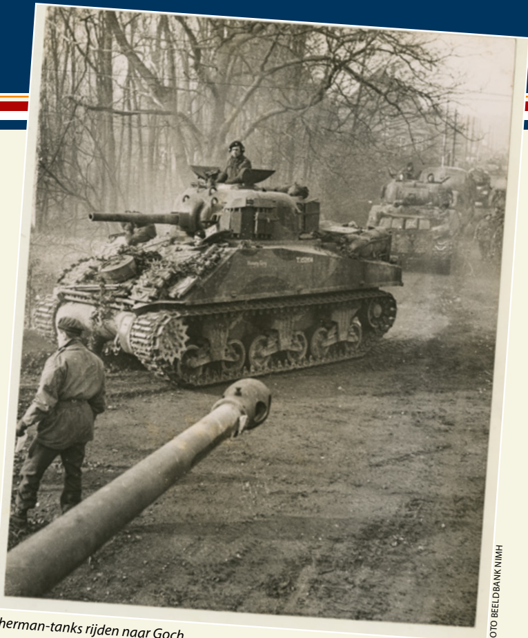
Sherman-tanks rijden naar Goch

De Amerikanen steken op 23 februari, twee weken later dan gepland, de Roer over. De vertraging van operatie Grenade komt doordat