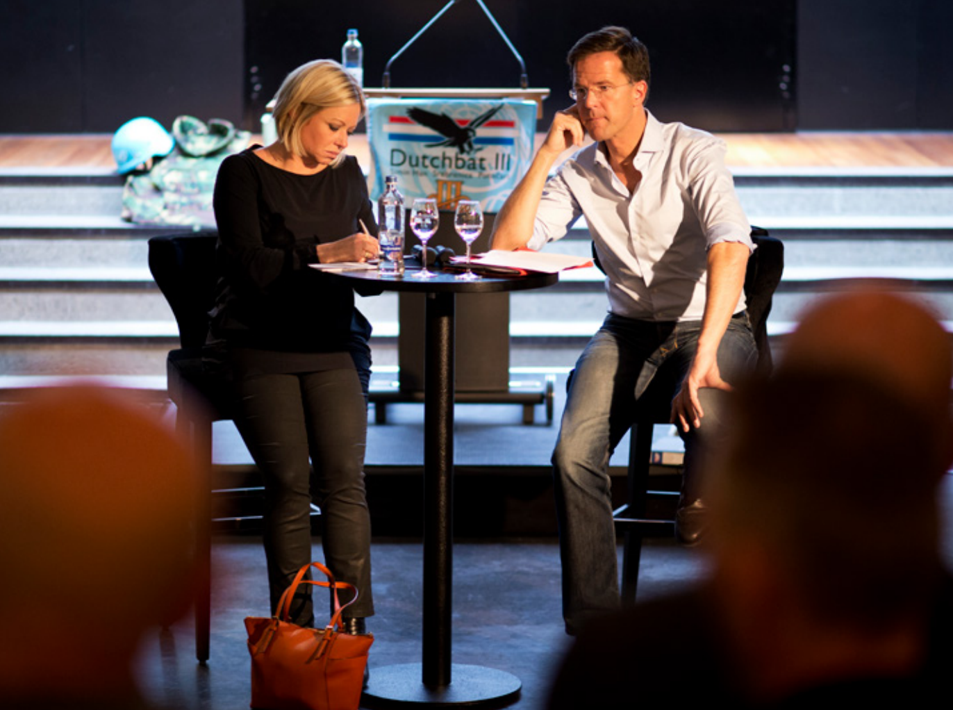
Minister-president Mark Rutte en toenmalig minister van Defensie Jeanine Hennis-Plasschaert in gesprek (2015) met veteranen van Dutchbat III. Ze gingen de discussie aan over de onvrede die er leeft

gelijkwaardige gespreksverhouding met het slachtoffer te kunnen creëren. Voordat de excuses publiekelijk werden aangeboden is in opdracht van Defensie onderzoek gedaan door ARQ Nationaal Psychotrauma Centrum naar de kwaliteit van leven van Dutchbat III-veteranen en de behoefte aan zorg, erkenning en waardering. 47 Er is dus geluisterd naar de Dutchbat