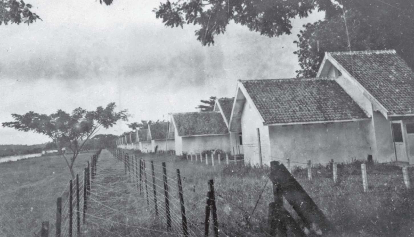
Kamp Onrust, een oud quarantainestation in de baai van Batavia, was aan het begin van de interneringen berucht