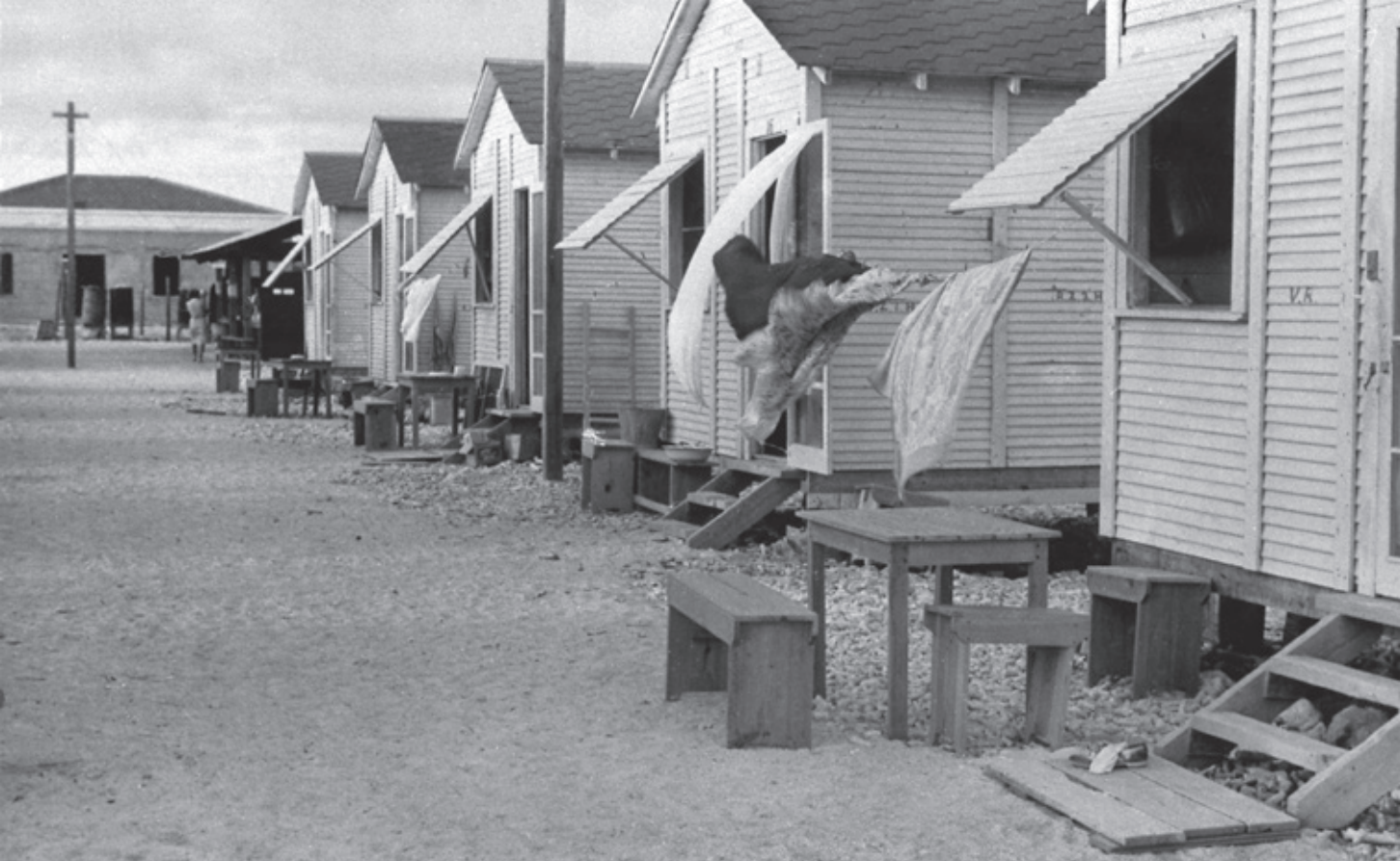
Het Rode Kruis beoordeelde de omstandigheden van de geïnterneerden op Bonaire in 1943 als 'en général [...] très bonnes'