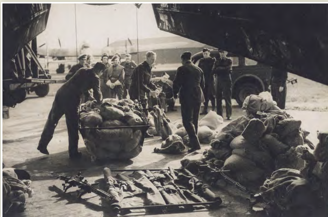
Op een Brits vliegveld wordt een Lancaster-bommenwerper geladen met voedsel

D oordat de geallieerden in het westen van Nederland geen militaire operaties ontplooiën, kunnen de Duitsers de bevolking daar onder de knoet houden en aanvoerlijnen afknijpen. 1 Een van de geallieerde plannen