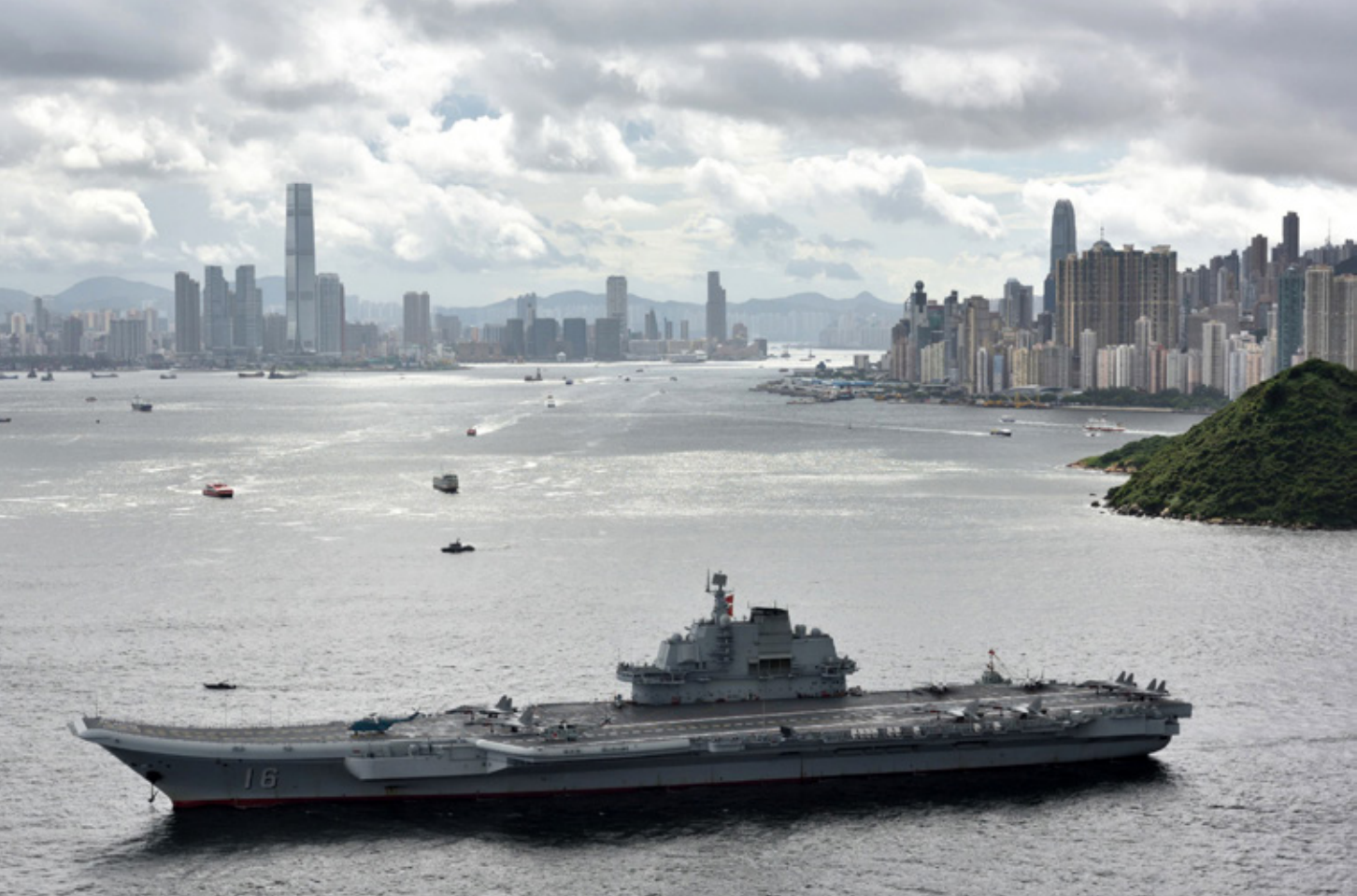
Het eerste Chinese vliegkampschip, Liaoning, arriveert in Hongkong in 2017. Het vliegkampschip moet de ruggengraat vormen van de PLAN