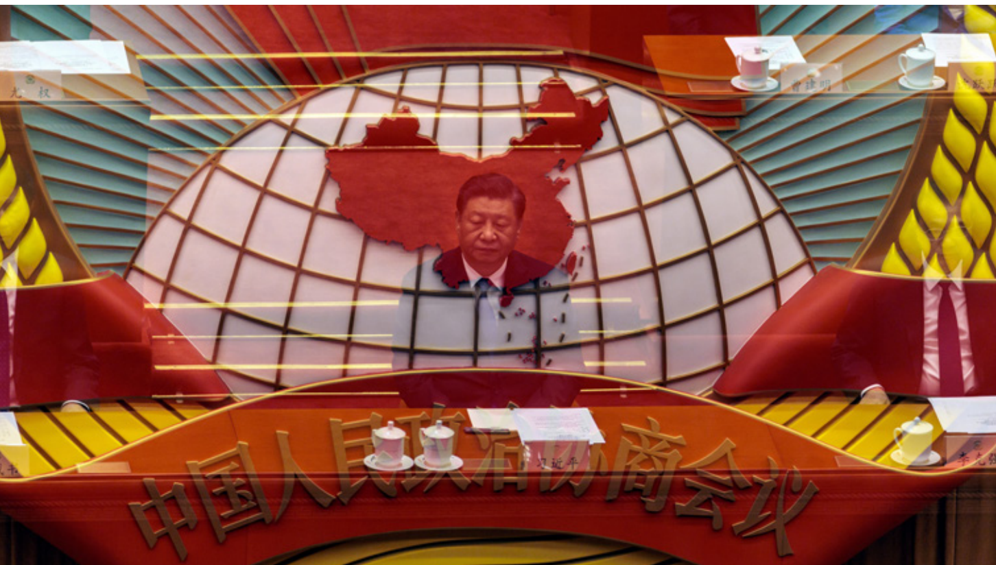
De Chinese president Xi Jinping tijdens het Volkscongres in 2022. Xi is, net als vroeger de keizers dat waren, het middelpunt van de macht in het 'Rijk van het Midden'