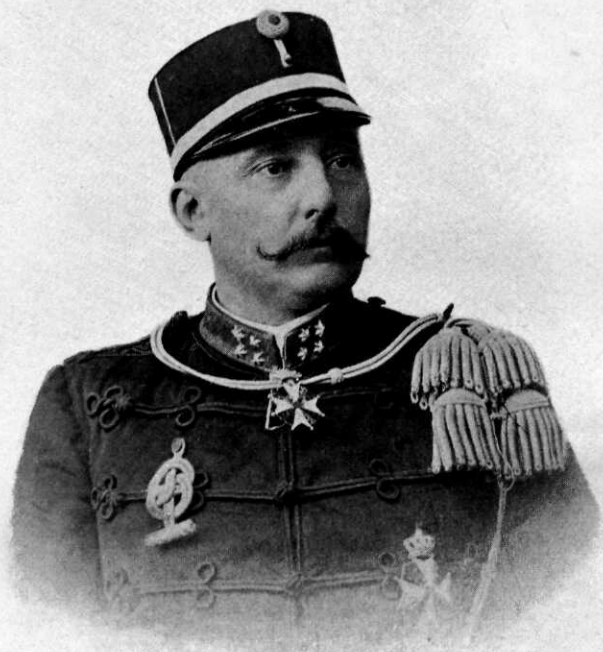
Luitenant-Generaal J. B. VAN HEUTZ. Civiel en Militair Gouverneur van Atjeh en Onderhoorigheden.