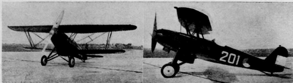
Afb. 1. Vooraanzicht.

Van een serie Fokker D XVII eenpersoonsjagers, welke met Rolls-Royce Kestrel II S „New Rating” motoren worden uitgerust en bestemd zijn voor de L.V.A., is thans het eerste toestel gereed gekomen. (Afb. 1, 2 en 4). Het is een anderhalfdekker met ver-