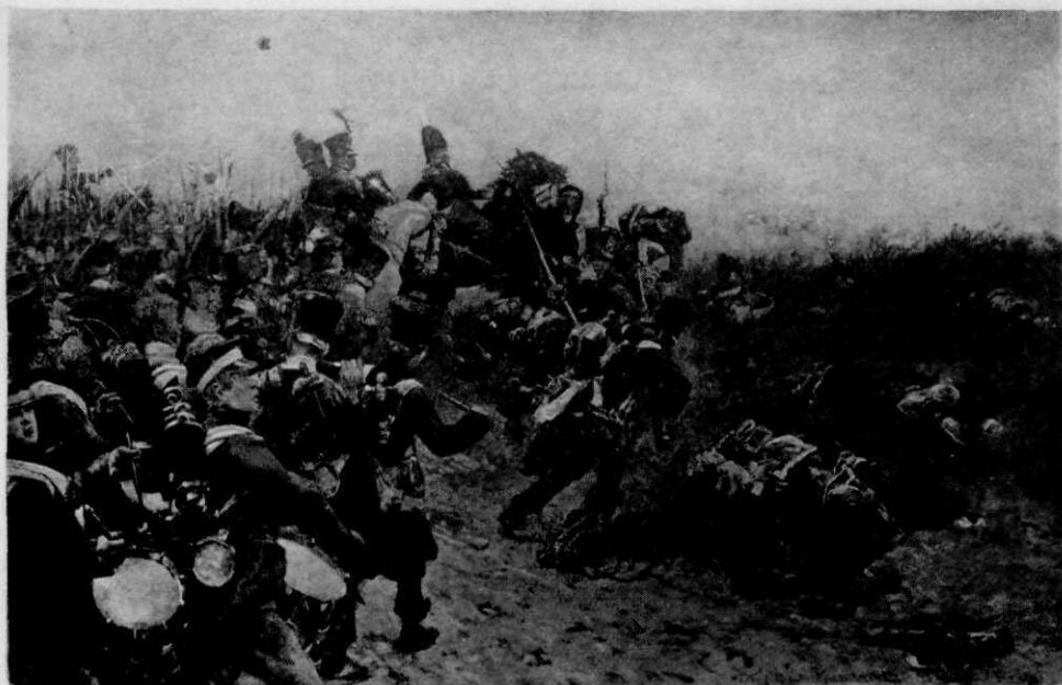
Aanval van Generaal CHASSÉ met de brigade Detmers op de „Moyenne Garde” in den avond van 18 Juni 1815 te Waterloo.

En een duizendvoudige echo juicht hem na: „ En avant! ”.