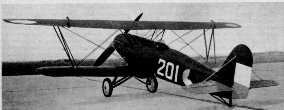
Afb. 4. Achteraanzicht.