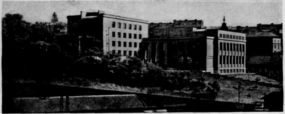
Afb. 3. Het museum van de nationale bevrijding.

muziekdirecteur (thans de genoemde Lt. Kol. OBERTHOR). Deze heeft als taak de organisatie en de leiding van den muziekdienst en de voorbereiding van de mobilisatie daarvan volgens de algemeene regelen; hij heeft het beheer en de aanvulling van het materiaal te verzorgen en alle personeelsaangelegenheden, als overplaatsingen en aanvullingen, te regelen. Hij heeft het muzikale toezicht op de korpsen en op de school. Een regeling van verdeling van verdiende concertgelden en van beheer muziekfondsen loopt in vele opzichten parallel met het hier te lande geldende, is echter meer gecentraliseerd. Een opvallende bepaling is, dat een muzikant, die een uitvoering stoort of schaadt kan gestraft worden met vermindering of inhouding van zijn aandeel.