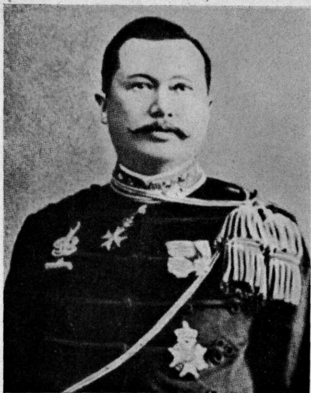
Generaal G. C. E. van Daalen