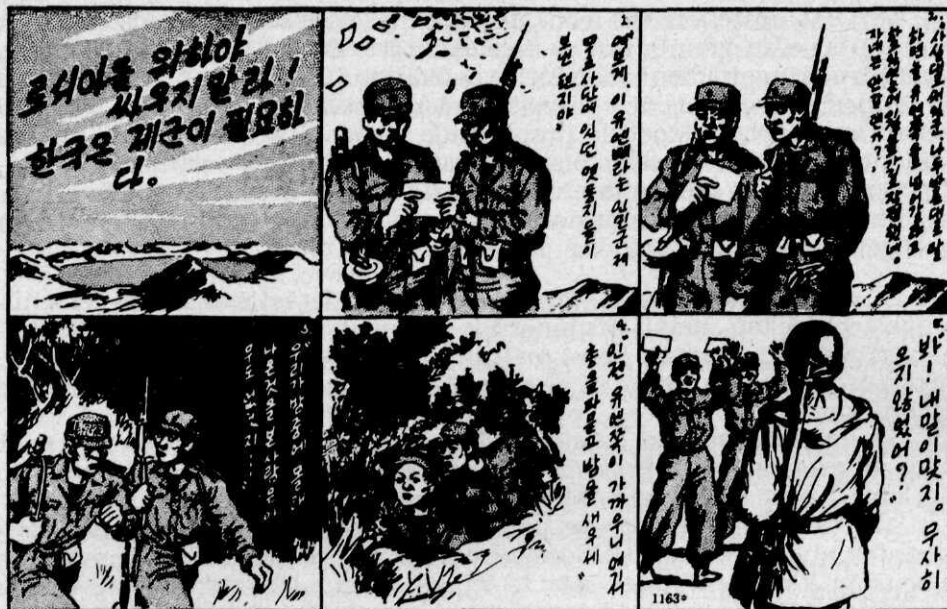
Een door de strijdkrachten van de Verenigde Naties verspreid overgave pamflet. Behalve de tekst geven ook de illustraties aan hoe de vijandelijke soldaat moet handelen.

Door middel van meeslepende muziek, een vleiende vrouwenstem, berichten van het leven thuis, wordt getracht deze gevoelens op te wekken of te versterken. De Duitsers en ook de Russen combineerden deze techniek met insinuaties aangaande het gedrag van vrouwen en verloofden thuis.