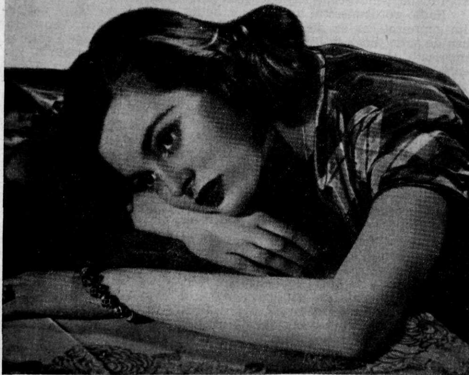
Pamflet verspreid door de Noord Koreaanse strijdkrachten en bedoeld om nostalgische gevoelens op te wekken (zie ook achterzijde).

"Darling, I will dream that you are coming back to me this Christmas. I can't think of a Christmas without you."