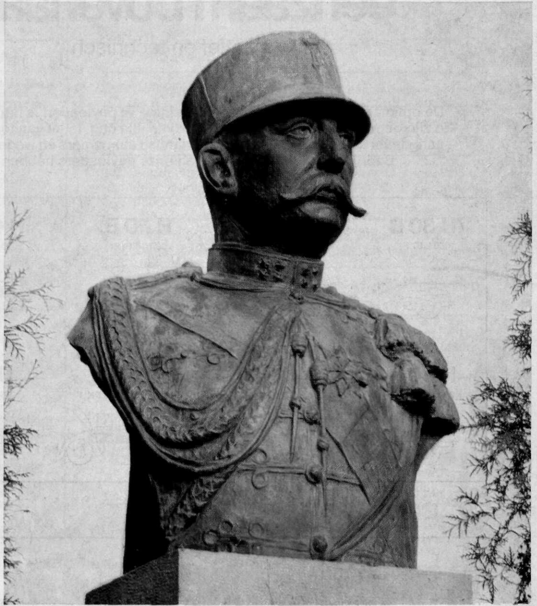
J. B. van Heutsz, gouverneur-generaal van Nederlands- Indië 1904-1909 (zie blz. 317 en 329)

WAARIN OPGENOMEN DE OFFICIELE MEDEDELINGEN VAN DE KONINKLIJKE LANDMACHT EN DE KONINKLIJKE LUCHTMACHT