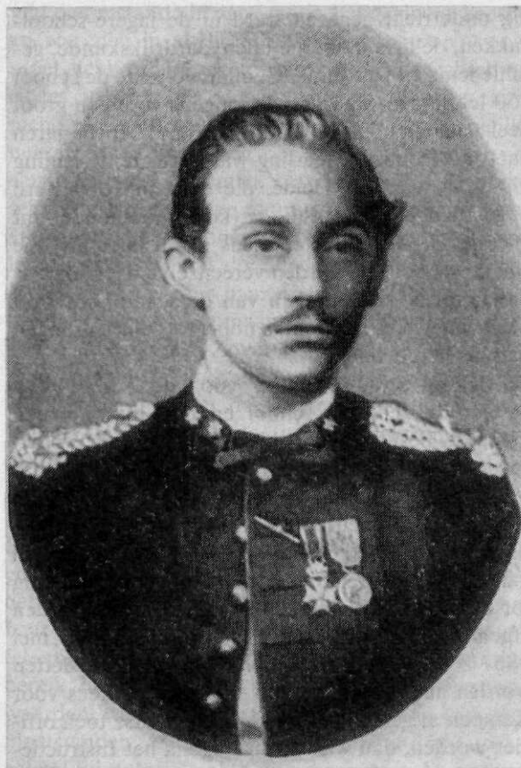
◁ J. B. van Heutsz als eerste luitenant van het Oostindische leger, omstreeks 1877