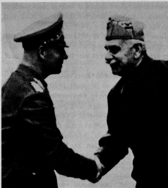
Generaal Gariboldi verwelkomt generaal Rommel, 10 februari 1941

Intussen was zijn troepenmacht versterkt en het aantal tanks was aanzienlijk uitgebreid; bovendien kon de Duitse generaal beschikken over de nodige batterijen 50 mm antitankgeschut en