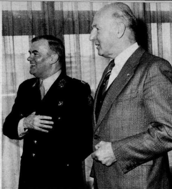
Alles bijeengenomen, reden tot grote tevredenheid bij zowel de hoofdredacteur van de Militaire Spectator als de voorzitter van de Koninklijke Vereniging die dat tijdschrift uitgeeft

Wanneer ik dan tot slot de themadag als zodanig bezie, is dat als het beschrijven van een hand waaraan vijf vingers zitten. Wij hadden vijf sprekers, en ik had hen gevraagd zeer kort een bijdrage te leveren. Hun gezamenlijke presentatie zou ik het beste kunnen vergelijken met een kristal waarvan wij de diverse vlakken hebben te zien gekregen; alleen, wat u daarvan hebt opgevangen, is afhankelijk van de lichtinval. Ik ben ervan overtuigd dat wij in ieder geval vandaag de verschillende vlakken hebben mogen zien in een helder licht, te danken aan de wijze waarop de inleiders zich van hun taak hebben gekweten, bekwaam geleid door de voorzitter van het forum. Maar ik zou onvolledig zijn als ik mij daarbij niet tevens zou wenden tot degenen die uit de zaal een bijdrage hebben geleverd aan de dis-