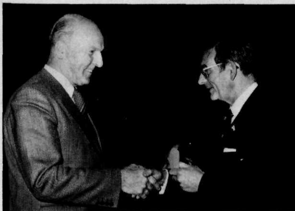
Bijzonder verrast bleek de hoofdredacteur toen ook hij met de legpenning werd onderscheiden

Mijnheer de Secretaris-generaal, hartelijk dank voor de wijze waarop u de Militaire Spectator legpenning hebt ingewijd en ingeleid. Wij hopen hiermee een gebruik te hebben ingesteld dat een lang leven moge zijn beschoren.