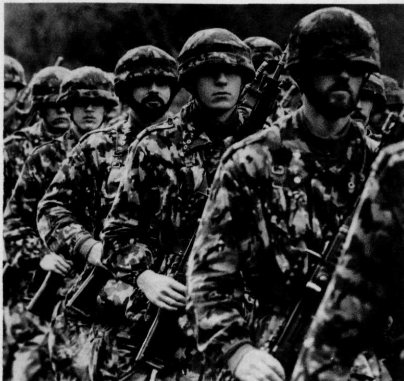
In wezen een zuiver infanterieleger...

Uit de momentopname, getiteld „Stand des Ausbaus der Armee am Ende der Legislaturperiode 1980-83” blijkt dat in die fase vooral aandacht is besteed aan het vergroten van de vuurkracht : ten behoeve van de antitankverdediging van de infanteriebataljons werd de Dragon ingevoerd, het tankbestrijdingsvermogen van de eigen tanks werd verbeterd door uitbreiding van het munitieassortiment met de moderne pijlmunitie, de verdediging tegen luchtdoelen werd versterkt door de introductie van het Skyguard-wapensysteem en door de momenteel nog niet geheel voltooide invoering van het mobiele geleide wapen Rapier, de artillerie werd gemoderniseerd en voorzien van een groot aantal pra(hw)'s M-109, welke toeneming van de kalibers een aanzienlijke verbetering betekende van vuursteunmogelijkheden die tot dan toe nogal onder de maat waren gebleven in het bijzonder waar het de dracht en de uitwerking van het en-