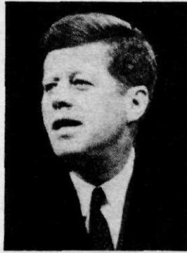
John Fitzgerald Kennedy (1917-1963)

geringsleden, zoals de minister van industrie dr. Ernesto (Che) Guevara, kregen nu de wind in de zeilen. Tijdens de Cubaans-Russische onderhandelingen van medio december 1960 in Moskou trad dr. Guevara – deze was Argentijn van geboorte, fungeerde al sinds juni 1955 als een der voornaamste adviseurs van Castro en zou op 8 oktober 1967 in Bolivia op bloedige wijze aan zijn einde komen – als de belangrijkste Cubaanse woordvoerder op.