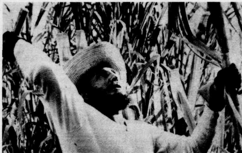
Fidel Castro tijdens een bezoek aan een suikerplantage

inmiddels uitgegroeid tot een socialistische eenheidspartij volgens Russisch model. De partij werd in oktober 1965 opnieuw georganiseerd, een gebeurtenis die echter ook weer een — zij het beperkte — emigratiegolf teweegbracht.