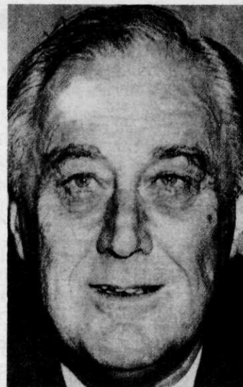
Franklin Delano Roosevelt (1882-1945)

De val van deze president werd bewerkstelligd door verschillende belangengroepen met sterk afwijkende doelstellingen. Zo hadden in Havana de studenten een belangrijke rol gespeeld