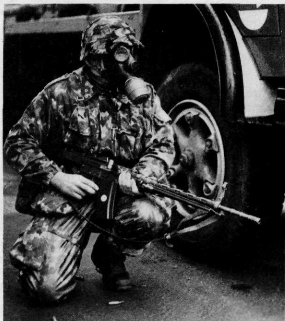
Verdediging tegen tanks vergt meer dan statisch optreden

ties aan de Mirages om de prestaties daarvan op te voeren, en een vergroting van de inzetduur van Mirages en Tigers door die te voorzien van extra brandstoftanks (een niet al te kostbaar plan weliswaar, maar bedacht zij dat in de voor-