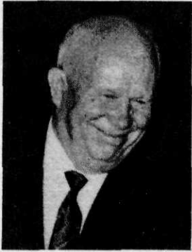
Nikita Chroesjtjov (1894-1971)