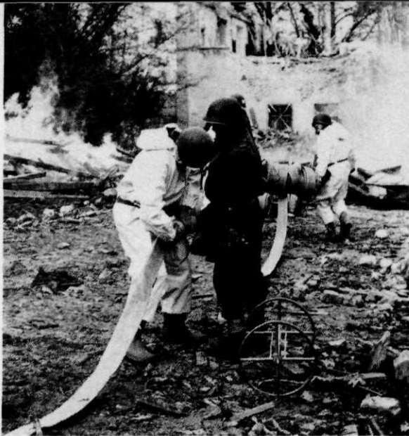
Aan de riskante vermenging van militaire en civiele organisaties, waaruit op grond van het oorlogsrecht consequenties kunnen voortvloeien, zal terdege aandacht moeten worden geschonken

dienen te worden teruggeslagen, en om die reden behoort de capaciteit voor (tegen)offensief optreden drastisch te worden versterkt, hoewel dat ook moge indruisen tegen de traditionele statische wijze van oorlog voeren die men zich steeds heeft voorgenomen.