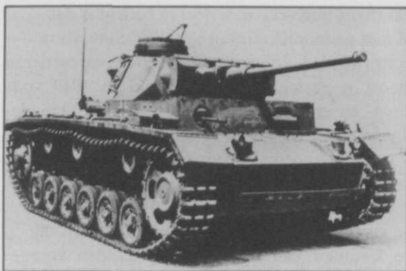
Duitse tank Pzkw III met 50 mm-kanon

den de eerste analoge rekentoestellen ontwikkeld. Wat de daarbij te gebruiken wapens betreft, vroeg dit om een soortgelijke ontwikkeling als voor de pantserdoelartillerie. Men ziet tussen wapens voor deze verschillende toepassingsgebieden dan ook dikwijls een duidelijke gelijkenis.