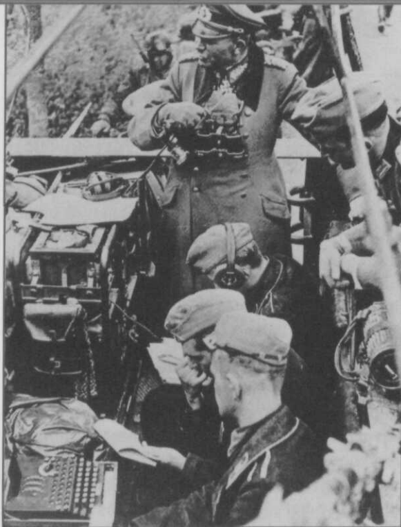
Pantsercommandant Guderian in zijn commandovoertuig; op de voorgrond een Enigma vercijfermachine

Voor de situatie van mei/juni 1940 is vooral van belang dat de Franse luchtmacht een ondergeschikte rol speelde (daar was de aandacht op de Maginot-linie geconcentreerd geweest) en dat de Engelsen hun moderne jachtvliegtuigen slechts spaarzaam inzetten voor de tot mislukken gedoemde verdediging van Frankrijk. Daardoor waren zij in staat alsnog voldoende luchtdekking te bieden bij de evacuatie uit Duinkerken en vervol-