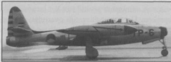
In het kader van het Mutual Defence Assistance Program kregen de Nederlandse luchtmachtseenheden o.m. de Republic F-84E Thunderjet; het toestel vloog bij 306 Foto-verkenningssquadron KLu

In januari 1950 ging Nederland een bilateraal verdrag met de VS aan en daarmee was voor ons land een belangrijke vorm van internationale samenwerking geboren. Dit verdrag, het Mutual Defence Assistance Program, hield de levering van wapens in die voor Nederland op dat moment nog onbetaalbaar waren. Voor de luchtmacht betekende het de aanschaf van grote aantallen jachtvliegtuigen, transportvliegtuigen e.d. In 1951 werd in het kader van dat verdrag door de VS de Republic F-84E Thunderjet aan Nederland geleverd. Na de Gloster Meteor was dat de tweede straaljager van de luchtmacht.