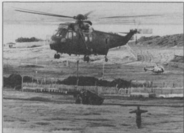
Sea King helikopters bij Port San Carlos

Amfibische groep in staat zou zijn het luchtoverwicht in en om de landingsstranden te veroveren en te behouden. Tevens nam men aan dat in de beide opties van logistieke ondersteuning de bevoorradingsschepen voldoende vrijheid van handelen zouden krijgen. Of die veronderstellingen reëel waren is discutabel, in het bijzonder wanneer men de mogelijkheden van de Argentijnse luchtmacht in ogenschouw neemt. Het resultaat was in ieder geval dat de Britten het oponthoud, dat deze verkeerde uitgangspunten meebrachten,