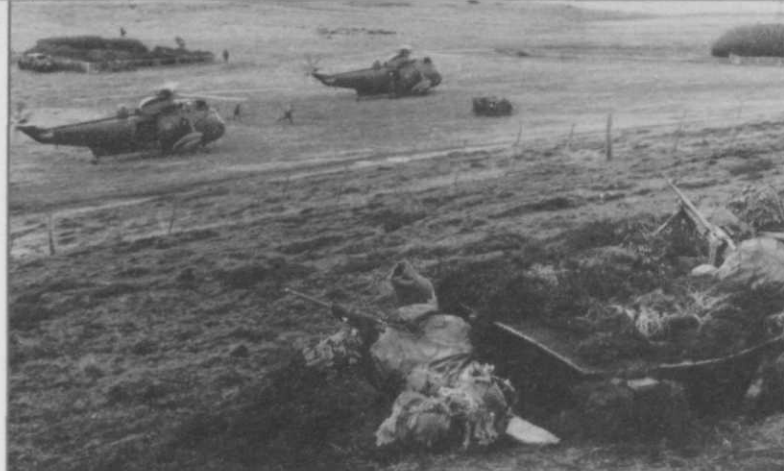
Sea King helikopters bij Goose Green

erop gericht de 5e Brigade zo snel mogelijk richting Fitzroy te brengen om in de strijd rond Stanley te worden ingezet.