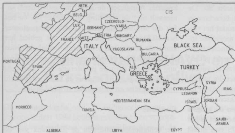
Afb. 1 Het gebied van Afsouth. Frankrijk en Spanje, alhoewel NAVO-lid, dragen niet met strijdkrachten bij aan Afsouth; Portugal heeft, in geval van een conflict, een deel van zijn strijdkrachten beschikbaar voor de versterking van Noord-Italië

conflict het noordoosten van Italië versterken. Alhoewel Frankrijk en Spanje als NAVO-lidstaten wel regelmatig deelnemen aan militaire oefeningen in het gebied, zijn zij niet in de militaire structuur van Afsouth opgenomen. De verwachting bestaat echter dat Spanje in de toekomst wel deel zal gaan uitmaken van de militaire structuur.