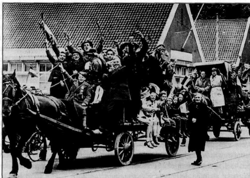
... en bevrijdingsfeesten.

te koersen. Alweer verwondert het niet dat katholieken en sociaal-democraten elkaar op een orderingsbeleid vonden. Overigens kan dan opnieuw worden vastgesteld, dat van de grootse plannen voor een publiekrechtelijke bedrijfsorganisatie veel minder terecht kwam, dan de ontwerpers daarvan zich hadden voorgesteld. Van een wezenlijke aantasting van de gematigd kapitalistische orde door organen buiten de overheid in engere zin met eigen bevoegdheden, was geen sprake. In de meeste gevallen slaagde men er zelfs niet in de wetgeving daarvoor te realiseren.