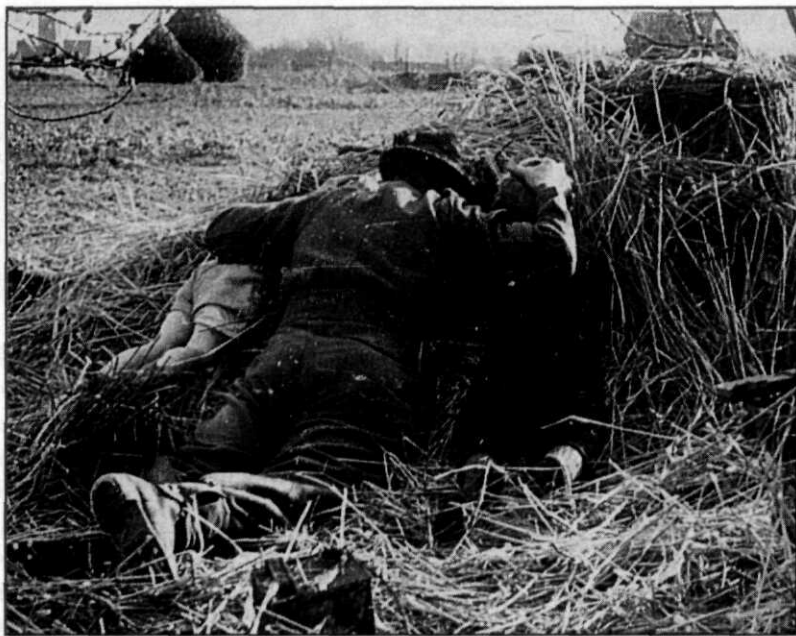
Vijftig jaar na dato: hoe is dit oorlogsgeweld verwerkt?

komen in dromen: een overlevende van de overstromingsramp droomde hoe zij tevergeefs probeerde iemand vast te houden die met de modderstroom werd meegevoerd. Het is moeilijk, wellicht ook beangstigend, om de eigen machteloosheid in het licht van zulke grote gevolgen te aanvaarden.