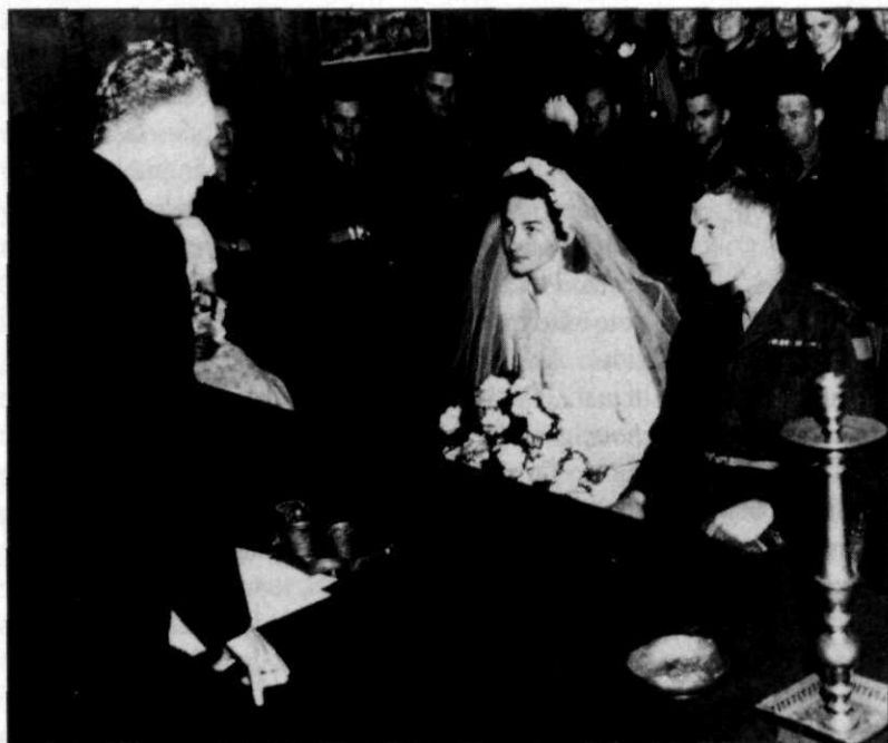
„Trees” heeft haar Canadees

derably more understanding than moralists thought they would be.)