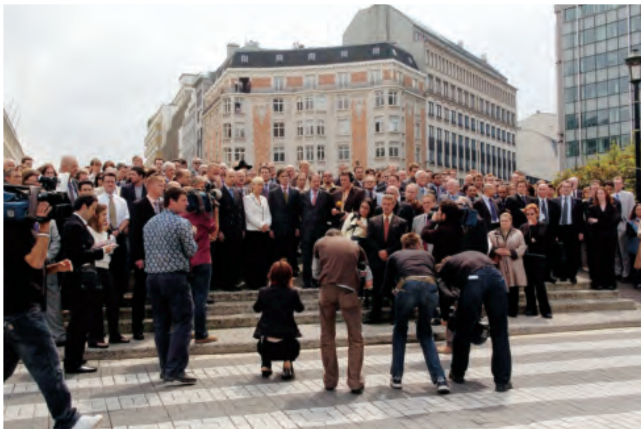
Eén minuut stilte ter nagedachtenis van de slachtoffers van de aanslagen in Londen en Madrid (juli 2005)

Na de aanslagen van 9/11 is dat ook versneld gebeurd. Zij variëren van arrestatiebevelen in andere lidstaten, gemeenschappelijke onderzoeksteams, het werk van Europol ten aanzien van drugs en terrorisme, informatie-uitwisseling door de inlichtingendiensten, verbetering van het Schengen-systeem voor de buitengrenzen, tot een verbod van financiële transacties voor een zwarte lijst van organisaties en het voorkomen van witwassen en crimineel verkregen gelden.