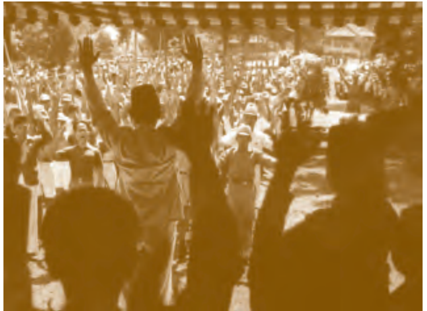
Soekarno roept de onafhankelijke Republiek Indonesia uit, 17 augustus 1945