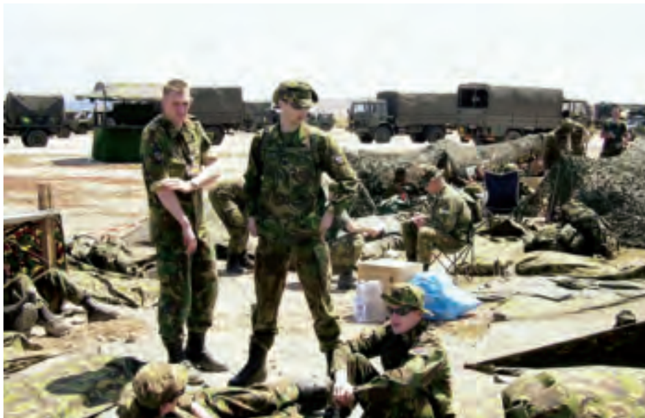
‘NATO Response Force’. Tijdens oefening ‘Noble Javelin’ (2005) zetten Nederlandse troepen camouflagenetten op

De vs hebben een grote fout gemaakt met hun stelling, verkondigd door Undersecretary of Defense Paul Wolfowitz op de jaarlijkse veiligheidsconferentie in München in 2002, dat de ‘mission determines the coalition’ , in plaats van omgekeerd, dat de coalitie – lees de NAVO – de missie bepaalt. Indien hij gelijk heeft, zou de NAVO haar nut als overlegforum verliezen, want dan zou de bondgenoten weinig anders overblijven dan hetzij een Amerikaans voorstel volgen om mee te doen aan een operatie, hetzij afzijdig blijven.