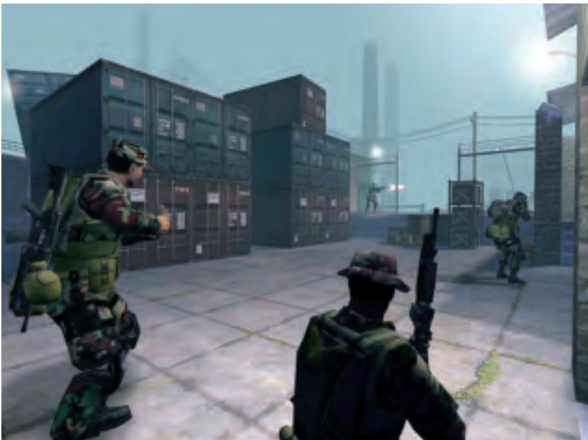
Screenshot uit het spel 'America's Army'

Videogames zijn één van de belangrijkste uitingen van onze met informatie en communicatie doordrenkte cultuur. Niet voor niets is de games-industrie de snelst groeiende entertainmentsector. Als onderdeel van een globale economie wedijvert haar budget met dat van de filmindustrie van Hollywood. 18 Uit schattingen komt naar voren dat de komende vijf jaar de wereldwijde omzet 100 miljard zal bedragen. Van het succesvolle computerspel Grand Theft Auto: San Andreas werd in het eerste weekend een miljoen exemplaren verkocht. Ook zijn games in de afgelopen jaren steeds complexer geworden in het bieden van informatie. Niet alleen hebben ze actuele gebeurtenissen als de oorlog in Irak en de internationale dreiging van het terrorisme tot onderwerp, de verhaallijnen in bekende games als The Sims zitten vol met