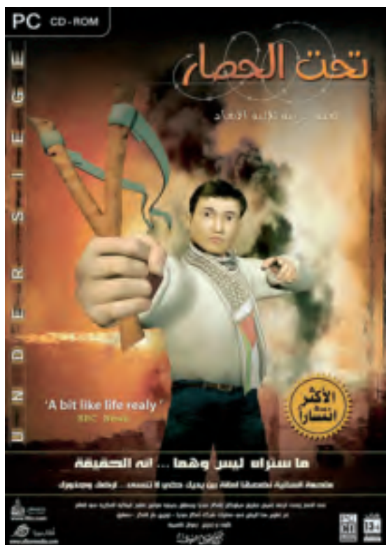
Verpakking van het spel 'Under Siege'

uit te brengen. In dat spel wordt voor het eerst de mogelijkheid geboden een Palestijnse vrouw te spelen die zich opgeeft om als menselijke bom een aanslag in Israël te plegen. Nadat ze in de game aan haar familieleden haar kindje heeft afgegeven, laat ze temidden van een divisie Israëlische soldaten een handgranaat ontploffen. Net als in America's Army is in deze game een regime van strikte regels van toepassing waarbij onder meer het neerschieten van onschuldige burgers tot een aftrek van punten bij de speler leidt. 10