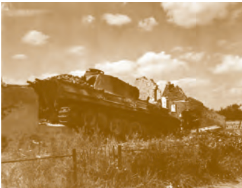
Sporen van de oorlog in Lent, zomer 1945

Per artikel is geteld welk aandachtsgebied aan de orde komt. Omdat in één artikel meerdere aandachtsgebieden