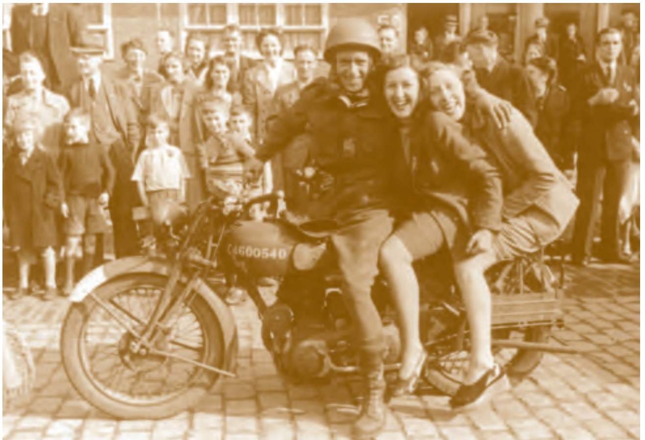
Intocht van Canadese militairen in Amsterdam, 8 mei 1945

In een tweede mogelijke verklaring is de doelstelling van de Militaire Spectator van belang. Volgens het redactiestatuut is het doel van de Militaire Spectator om Defensiepersoneel (vanaf 1999 ook een deel van de burgers) te informeren over de ontwikkelingen op het gebied van de