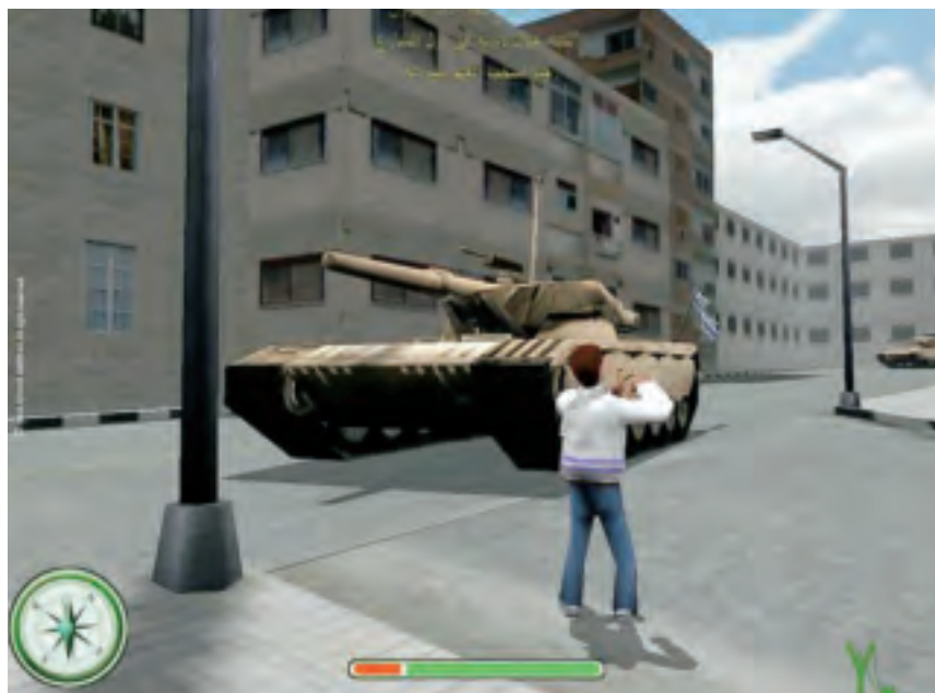
'Screenshot' van het spel 'Under Siege'

staat. In een vrijheidspraktijk gebeurt nog iets anders. In die praktijk tekent zich een nieuwe identiteit af, er ontstaat een positieve zelfervaring. Wat zijn de positieve uitdrukkingen van deze praktijk? Welke nieuwe vormen van zelfervaring drukken zich daarin uit? Wat de spellen The Stone Throwers , Under Ash en Under Siege naast het verzet tegen de onderdrukking en uitbuiting door Israël en de Verenigde Staten gemeen hebben, is de productie van een samenhangende Arabische identiteit.