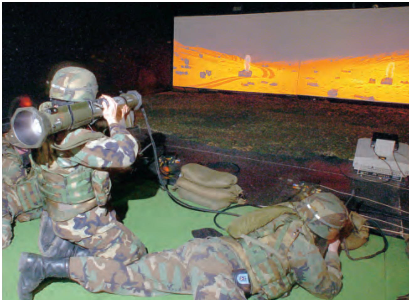
Militair vuurt een AT-4 naar de 'vijand' tijdens een scenario-training van de 'Engagement Skills Trainer' (EST 2000).