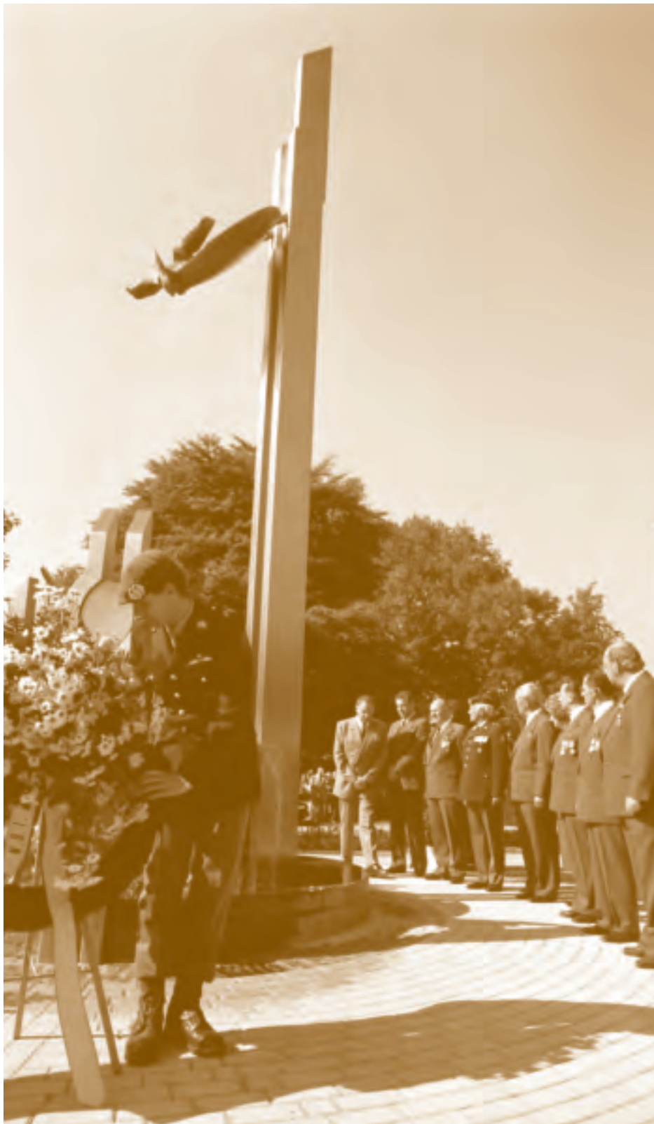
Onthulling Indiëmonument, Roermond, september 1988

In de periode 1995 tot 2005 leveren ongeveer evenveel burgers als militairen een bijdrage aan de artikelen.