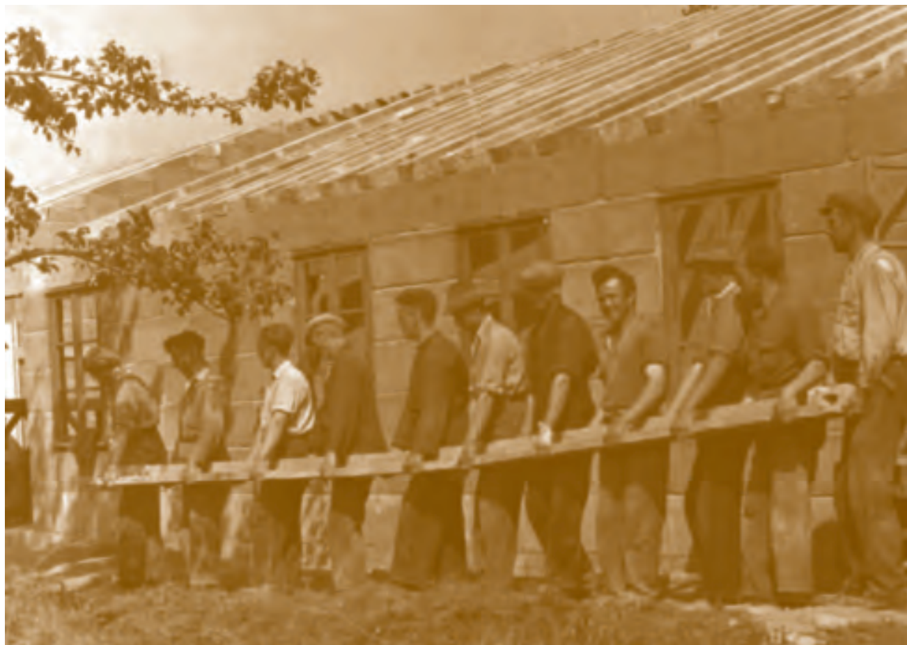
Wederopbouw in de Betuwe, oktober 1945

houd, de aandachtsgebieden, de herkomst van de auteurs (burger, militair) en het aantal auteurs van een artikel.