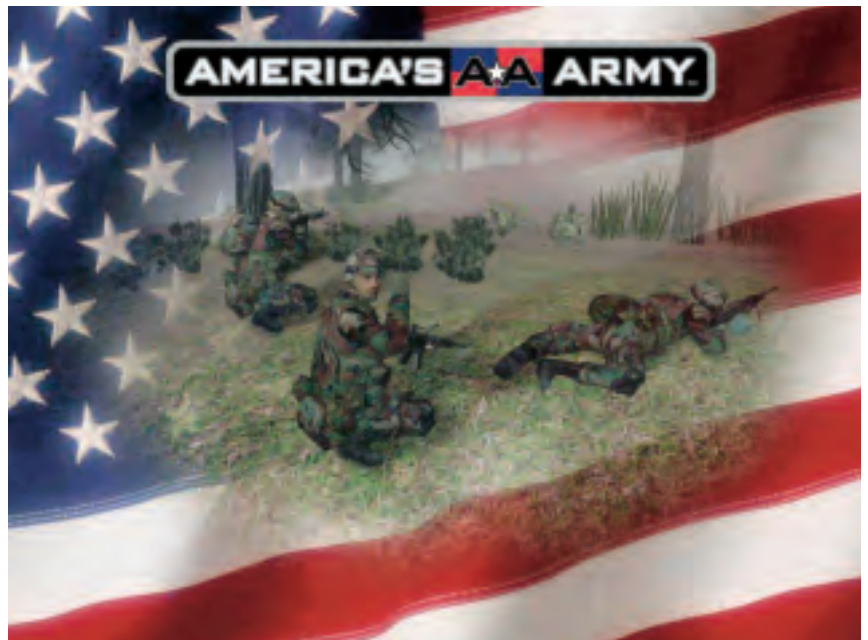
Poster 'America's Army' (Collectie NIMH)

Bijna overal op de wereld zijn krijgsmachten te vinden. Niet alleen beschikken vrijwel alle landen over een militair apparaat. Op dit ogenblik bevinden zich ook vele tienduizenden militairen buiten de eigen landsgrenzen. Zij nemen deel aan de talrijke operaties die op vreemd grondgebied spelen. Troepen uit allerlei landen bewegen zich daarbij op het land, in de lucht, op of onder water en deels wordt ook de ruimte gebruikt. Zij maken gebruik van de ons omringende fysieke werkelijkheid. Recente ontwikkelingen maken echter duidelijk dat de strijdkrachten van nationale staten zich tegelijkertijd gaan bewegen in een