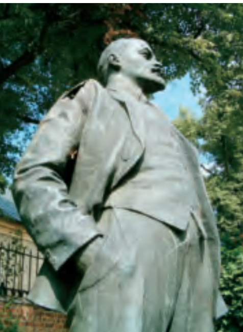
Standbeeld van Lenin

Sedert de val van de Berlijnse muur en de daarna volgende ontbinding van het Warschaupact en zelfs de Sovjet-Unie is de Europese veiligheidssituatie fundamenteel veranderd. Iedereen beaamt dat, maar over de antwoorden op deze nieuwe situatie bestaat minder eenstemmigheid. Zeker is dat de ideologische dreiging van het communisme is verdwenen en daarmee de gevaarlijkste drijfveer voor een expansieve politiek.