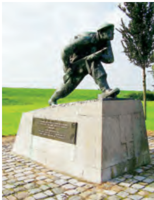
Het monument ter herinnering aan de landing van manschappen van No 4 Commando op 1 november 1944 te Vlissingen. Dit monument staat langs de Commandoweg in Vlissingen