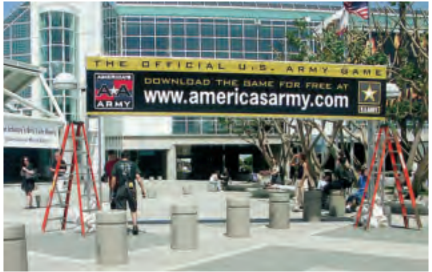
Publiciteit voor het spel 'America's Army' tijdens de E3-beurs voor interactieve media, Los Angeles, 2004.