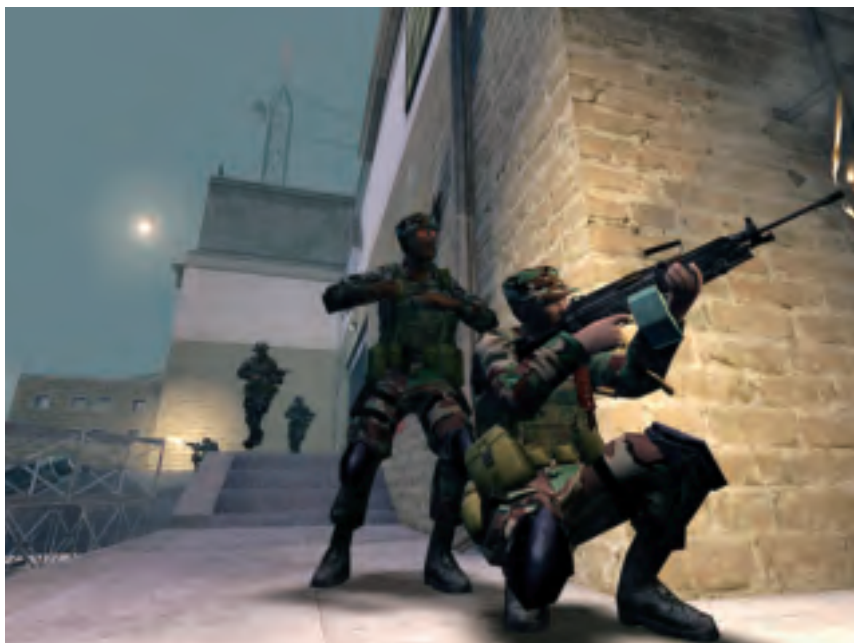
'Screenshot' van America's Army

400 nieuwe rekruten volgens een woordvoerder van de Amerikaanse Defensie voldoende zou zijn om de kosten van het project te dekken, steeg het aantal geregistreerde gamers binnen twee maanden tot over de 2 miljoen spelers. Inmiddels hebben ruim 4 miljoen geregistreerde gebruikers meer dan 185 miljoen missies uitgevoerd van ieder 10 minuten. Daarmee behoort America's Army tot de vijf meest gespeelde online actiegames in de wereld. Naast de enthousiaste reacties uit de game-gemeenschap zijn er ook afkeurende reacties te horen.