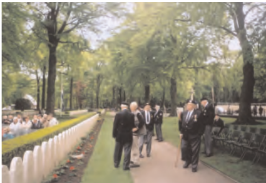
Herdenking gevallen mei 1940, Grebbeberg, 4 mei 2005