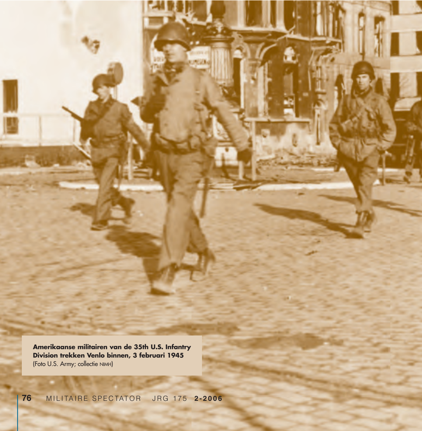
Amerikaanse militairen van de 35th U.S. Infantry Division trekken Venlo binnen, 3 februari 1945

De algemene opvatting was er één van vooruitkijken, een houding die