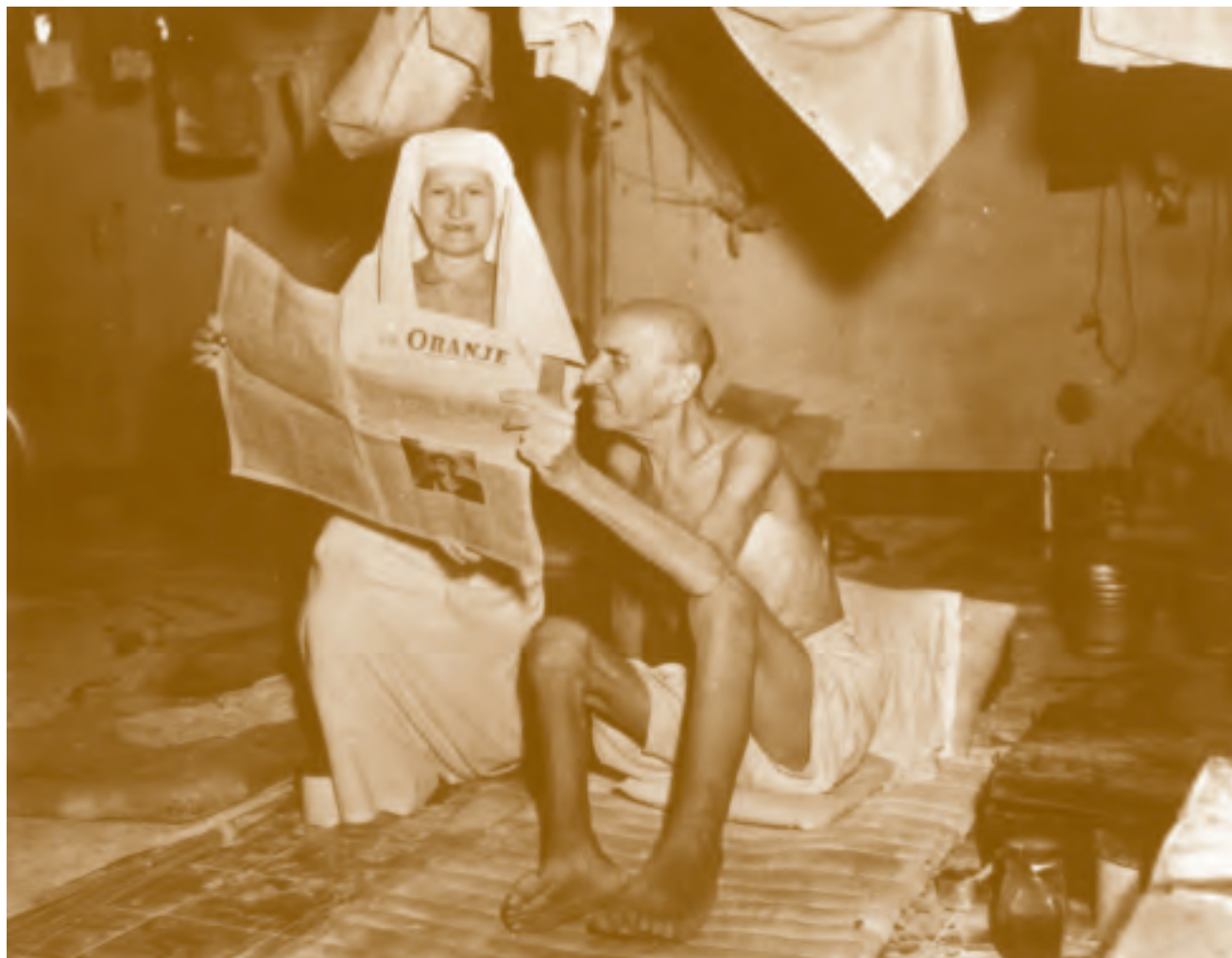
Bevrijde geïnterneerde en verpleegster in het Mater de la Rosa-hospitaal in Batavia lezen de 'Oranje', circa augustus 1945