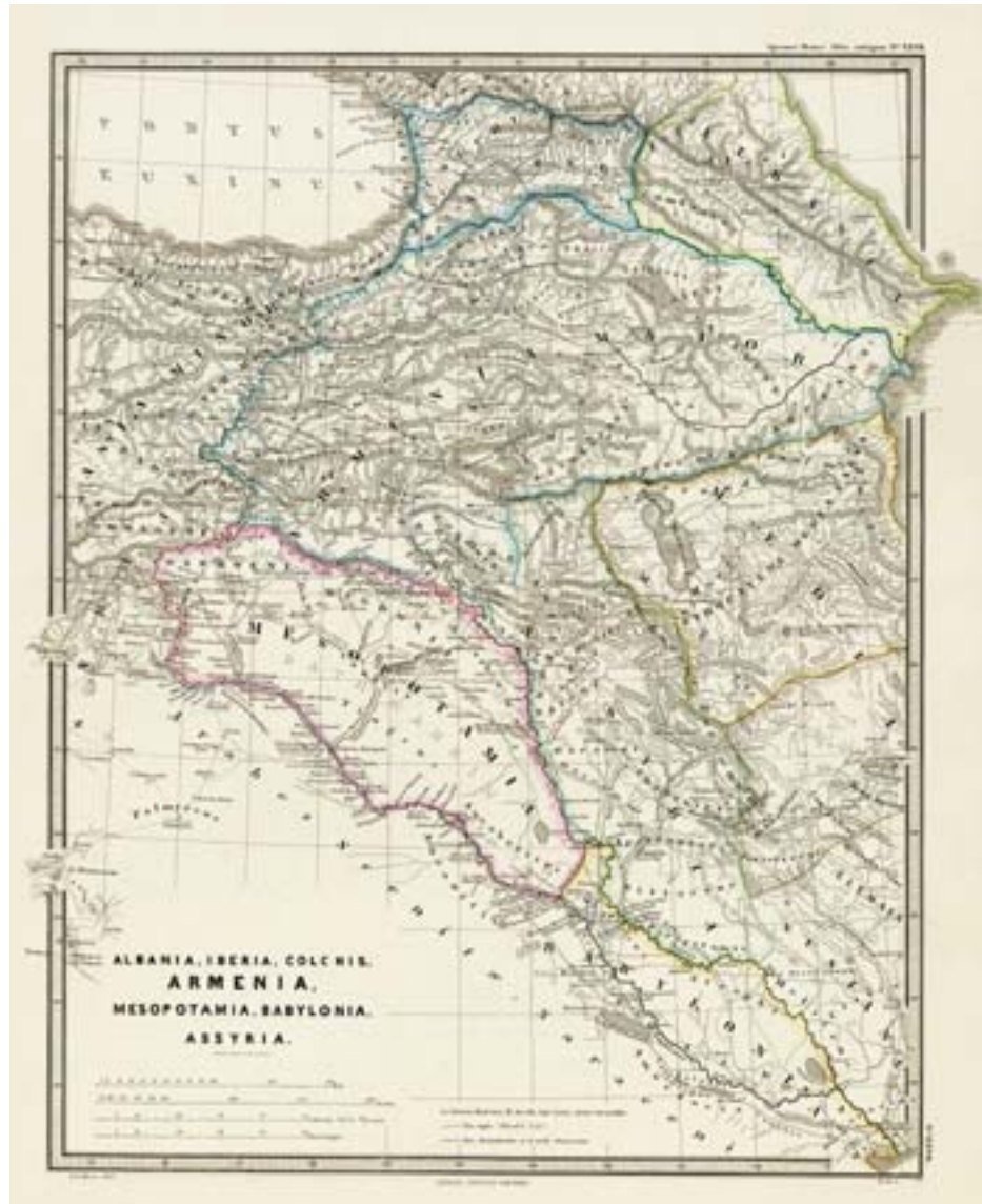
Kaart van de Kaukasus

element van dit beleid is veiligheids-politiek.