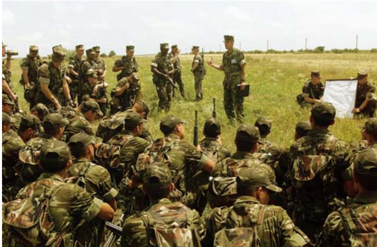
Troepen uit Azerbeidzjan, Bulgarije, Georgië, Frankrijk, Duitsland, Griekenland, Hongarije, Italië, Roemenië, Slowakije, Turkije en de Verenigde Staten nemen deel aan oefening 'Rescue Eagle 2000'