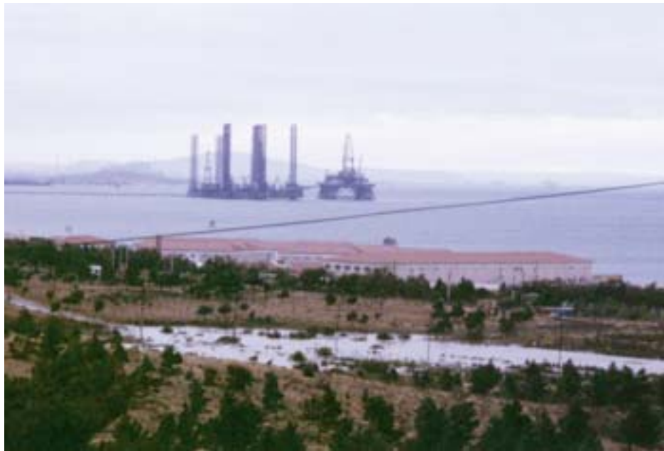
Olie-installaties bij Baku

Als deze politiek in praktijk zou zijn gebracht, zou dit een ernstige destabilisatie van de regio hebben betekend. President Elchibey werd in juni 1993, na nauwelijks een jaar aan de macht te zijn geweest, afgezet. Gaidar Aliev kwam aan de macht, een man met een goed netwerk in Moskou, voormalig leider van Azerbeidzjan ten tijde van de Sovjet-Unie en ooit actief in de KGB. 3 Aliev liet de verhoudingen met Turkije wat bekoelen, en richtte zich op Moskou en op West-Europa. In 2003 overleed Gaidar Aliev, en werd hij opgevolgd door zijn zoon.