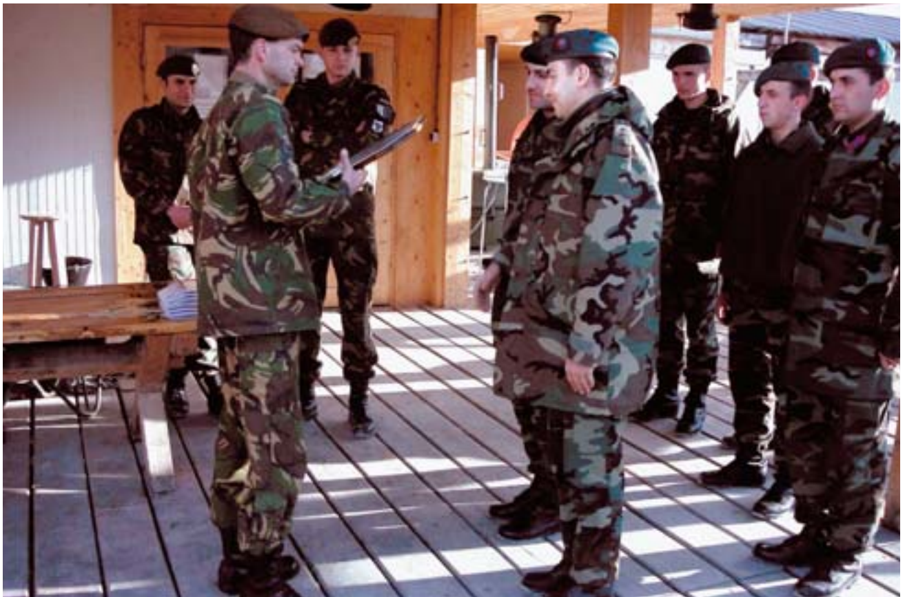
Turkse SFOR-militairen in Novi Travnik, Bosnië-Herzegovina