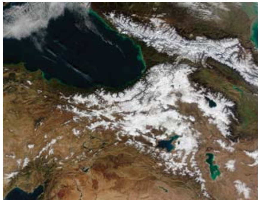
Kaukasisch gebergte, Turkije

Het ontsluiten en de ontwikkeling van toerisme langs de Zwarte Zee en de Kaukasische kust zullen gemakkelijker verlopen. Het zal gemakkelijker zijn om gecoördineerde politiecontroles uit te voeren teneinde grensover-