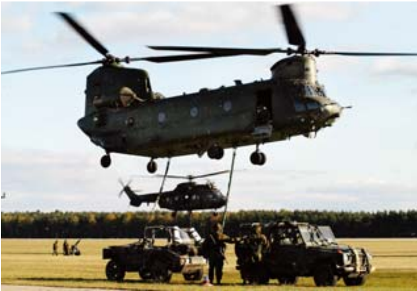
Oefening 'Gainful Sword', 2003