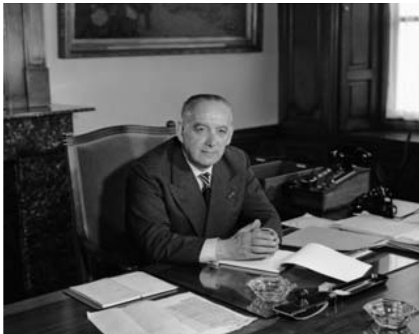
Minister van Defensie S.J. van den Bergh

Aan het eind van de jaren tachtig en de eerste helft van de jaren negentig verschoof de aandacht naar de betekenis en gevolgen van de politieke omwenteling in Oost-Europa en de voormalige Sovjet-Unie voor het defensiebeleid. Pas na de eeuwwisseling kwam de belangstelling voor organisatorische vraagstukken terug. In de begroting voor 2002 werd erop gewezen dat 'niet langer de organisatie-