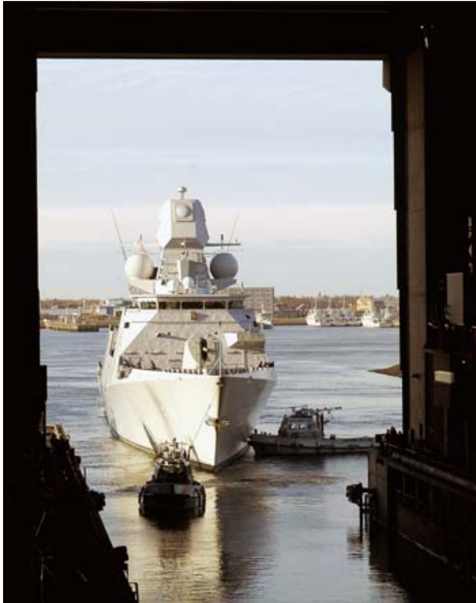
De eerste keer een LCF in het dok, 2004

In de tweede plaats is evaluatie ex ante bedoeld om strategische keuzes bij de beleidsvoorbereiding mogelijk te maken. Een van de grote nadelen van de oude organisatiestructuur van Defensie was dat de beleidsvoorbereiding ‘bottom-up’ gebeurde. Dat bleek een nauwelijks te nemen hindernis te zijn om krijgsmachtbreed tot strategische keuzes te komen. Een van de kernaanbevelingen van de commissie-Franssen was dan ook om het planproces om te draaien en ‘top-down’ in te richten.