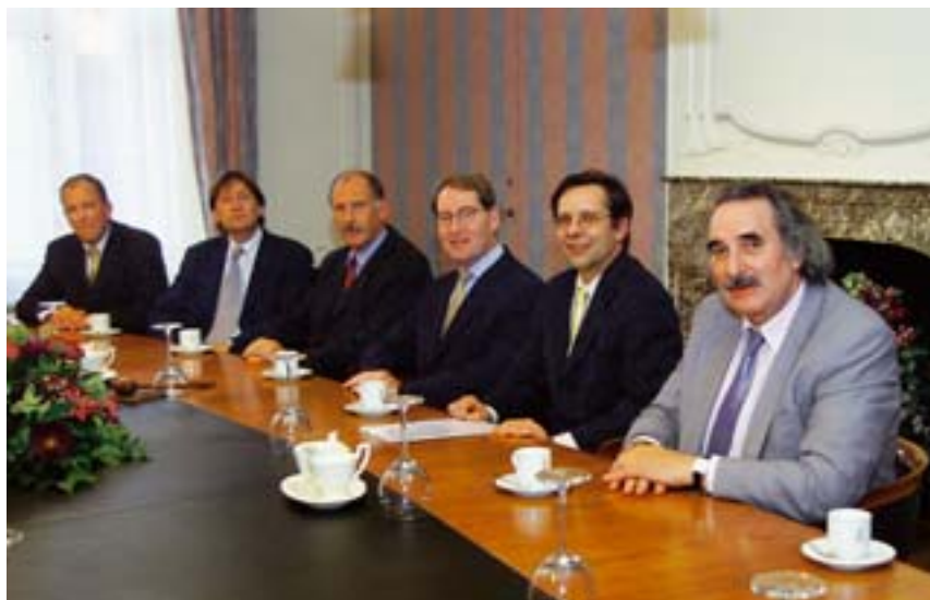
Minister van Defensie F. De Grave (tweede van rechts) presenteert de Adviescommissie Opperbevelhebberschap, 2001

Wat komt er van deze plannen terecht en hoe meten we het succes van het op papier vaak zo wervend geformu-