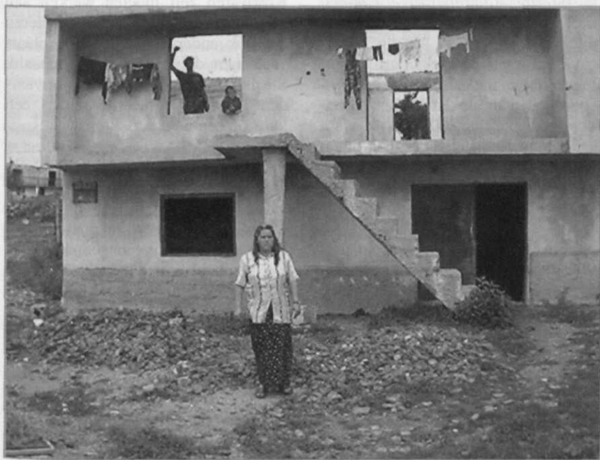
Pusto Celu... Waar begin je in hemelsnaam?

Door het wegvallen van internationale donaties was UNMIK al vrij snel gedwongen de salariëring op te nemen in het gemeenschappelijke budget voor Kosovo. Materiaal was slechts mondjesmaat voorhanden en de opleiding stagneerde met enige regelmaat. Na enkele incidenten, waarbij leden van het TMK betrokken waren bij het afpersen van geld en bedreigingen, werd besloten alleen de commandanten en hun lijfwachten uit te rusten met wapens, iets dat gelet op de taak onbegrijpelijk overkomt. Er werd een rangenstelsel ingevoerd dat geen gelijkenis mocht vertonen met het militaire rangenstelsel. Een uitzondering werd gemaakt voor Çeku, die ten slotte echt generaal was. Binnen korte tijd noemden de meeste TMK-commandanten zich generaal. Toch heeft het TMK onder de strakke leiding van Çeku, die onder constante supervisie staat van de internationale gemeenschap in Kosovo, zich nuttig gemaakt voor de wederopbouw c.q. het opruimen van Kosovo.