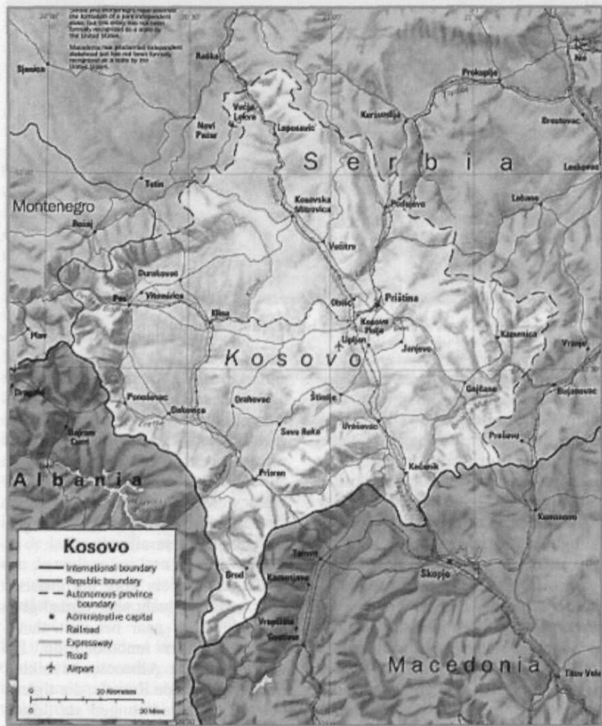
Kaart van Kosovo

Het probleem van de vermisten speelt ook in de hedendaagse politiek nog altijd een grote rol. Loze beschuldigingen over 'gevangenskampen' worden door het regime in Belgrado de media ingebracht om de 'onmacht'