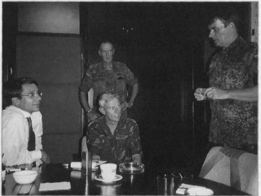
Politiek-militair overleg op hoog binationaal niveau (Bron: Van den Aker)

Na de terugtocht van de Serviërs begon echter een 'schoonmaakoperatie', waarbij iedereen die geheuld had met de vijand of waarvan dit werd vermoed, het leven ondraaglijk werd