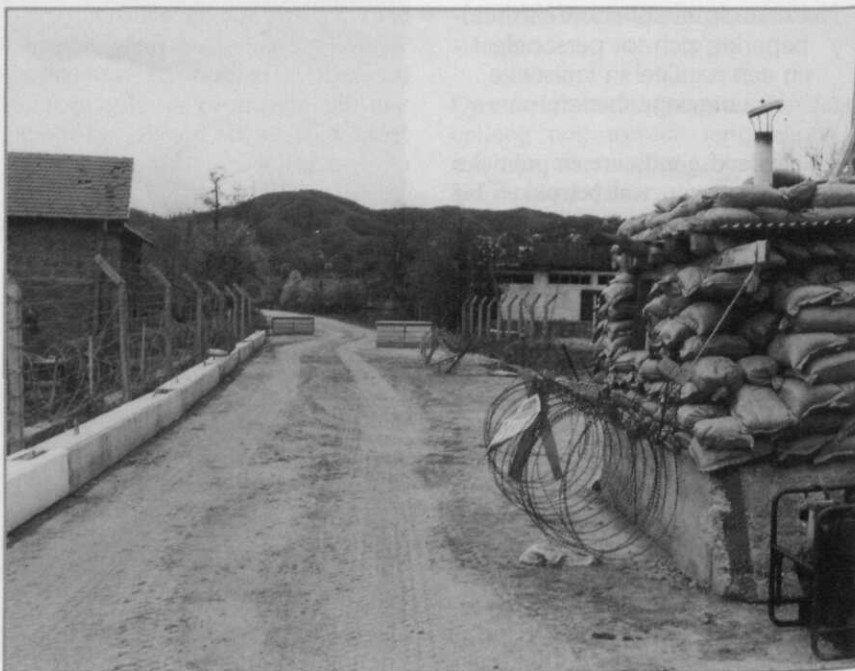
Observatiepost-Papa, Srebrenica, circa 1995

Dat alles heeft de verhouding tussen Dutchbat en de bevolking niet vergemakkelijkt. Het heeft ertoe bijgedragen dat, waar ten tijde van Dutchbat I nog van relatief frequente contacten met de bevolking sprake was, ten tijde van Dutchbat II en III die contacten juist bewust werden beperkt.