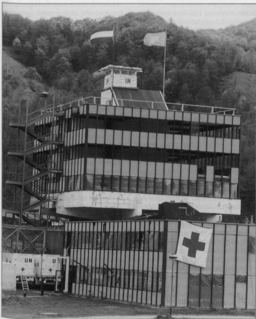
De compound in Potočari, circa 1995

KHO 6 had striktere opvattingen over hulp aan derden dan KHO 5. De diverse spanningen vermeng-