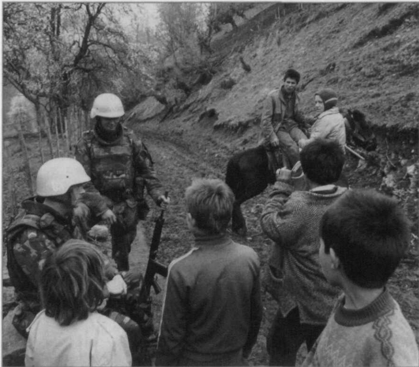
Dutchbat-militairen in gesprek met kinderen bij OP-Alfa, Srebrenica 1994

De brede kring van betrokkenen bij de vorming van dit beleid en in het