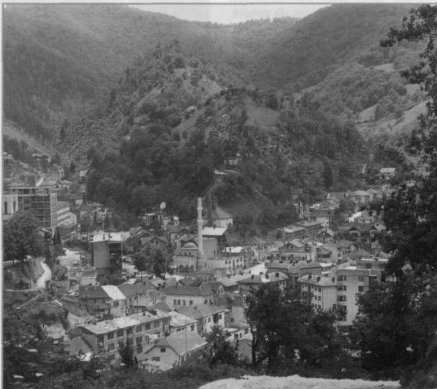
Uitzicht over Srebrenica, circa 1995

De inspanningen van 'Europa' in het Joegoslavië-dossier zijn een goed voorbeeld van doormodderen. Onderlinge verdeeldheid verhinderde slagvaardig optreden. De manier waarop de nieuwe staten werden erkend – uit-