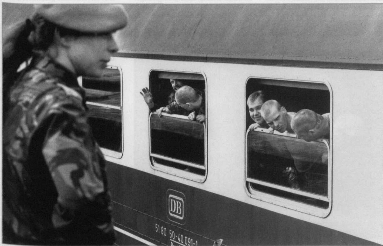
De eerste groep Dutchbatters vertrekt naar Joegoslavië. 't Harde, 1992

Nederland werd zo een van de grotere troepenleveranciers aan een vredesmissie die velen beroerde. Het Nederlandse aanzien in de wereld steeg, zo meende men.