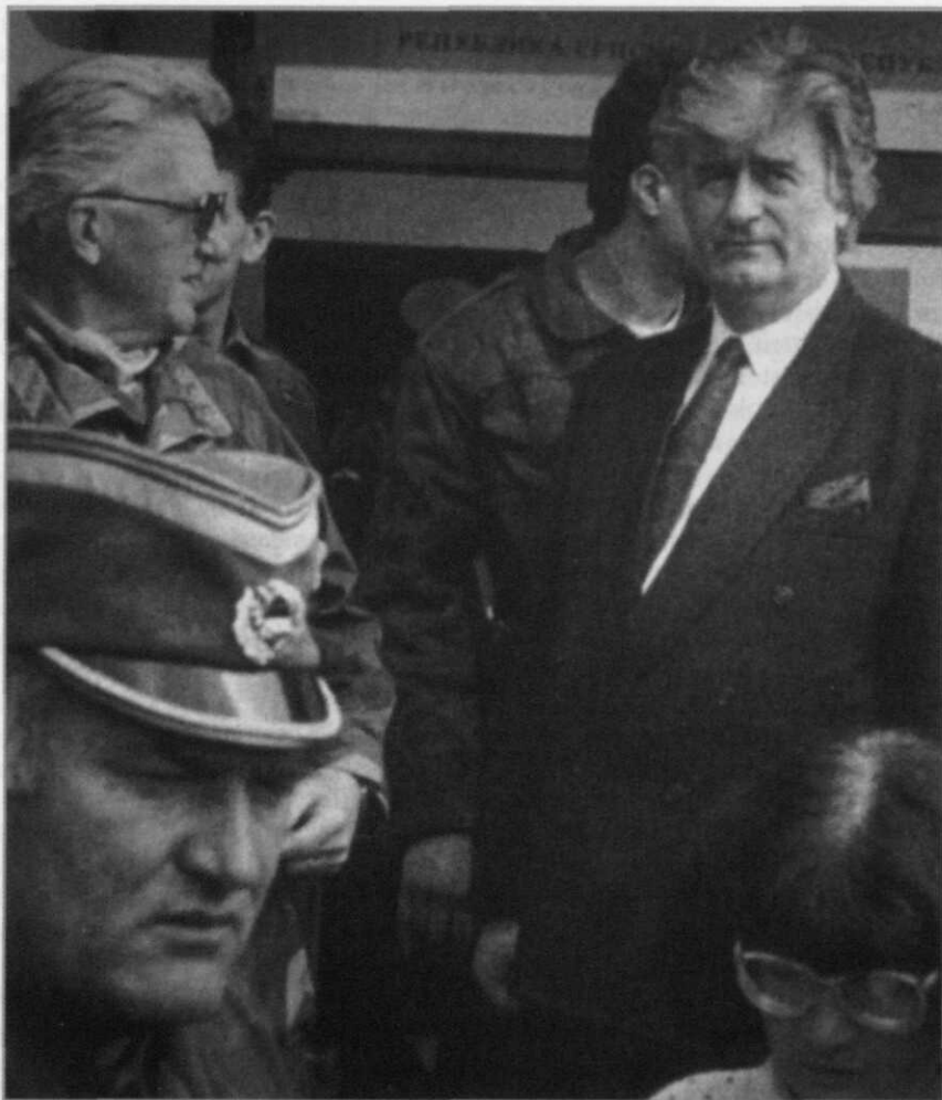
Generaal Ratko Mladić en Radovan Karadžić

Serven gedomineerd, koos uiteindelijk voor dit streven.