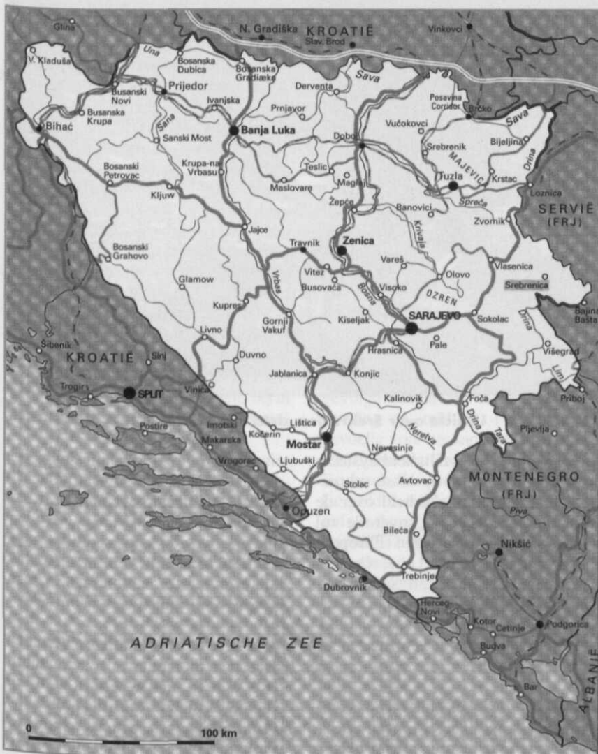
Overzichtskarta van Bosnië

In de literatuur worden voor de oorlog in Bosnië uiteenlopende cijfers gegeven over de etnische achtergrond van de slachtoffers, zodat al te harde uitspraken beter achterwege kunnen blijven. Maar in alle varianten wijzen die cijfers bij benadering eerder op gelijkmatige verdeling van de herkomst van geweld dan op eenzijdige. In ieder geval maakten alle strijdende partijen zich klaarblijkelijk schuldig aan grove gewelduitoefening.