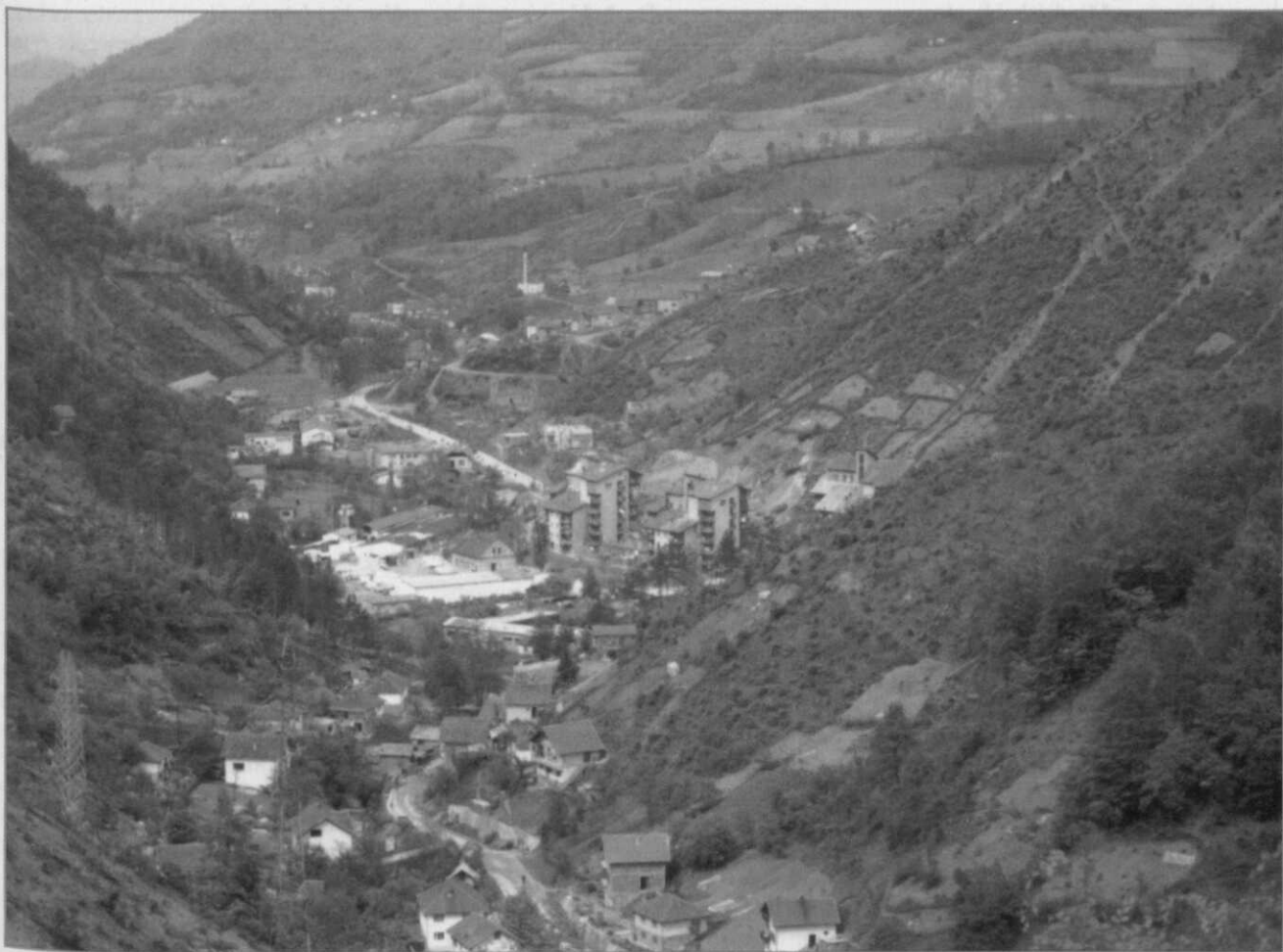
Noordelijk deel van Srebrenica met compound, circa 1995

Daarom moet, onder erkenning van het feit dat Srebrenica propagandistisch is uitgebuit en dat de enclave zeker geen hoogste prioriteit van de Bosnische regering was, een specifieke deal als gevolg waarvan Srebrenica is opgeofferd als onbewezen en hoogst onwaarschijnlijk worden afgevoerd. →