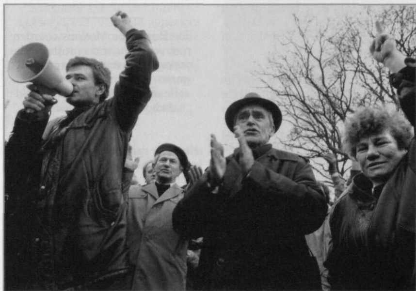
Bosnische vluchtelingen demonstreren tegen de oorlog in hun land Haarlem, 1993

De aanwezigheid van VN-militairen als zodanig zou acties moeten voorkomen: to deter by presence . Men zou het als een soort struikeldraad tegen