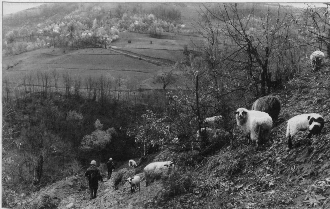
Dutchbat-militairen op patrouille in de heuvels rond de moslim-enclave Srebrenica 1994

Met dat beeld hadden de meeste Dutchbatters grote moeite. Zij hadden een andere wereld gekend tijdens hun verblijf in de enclave. →