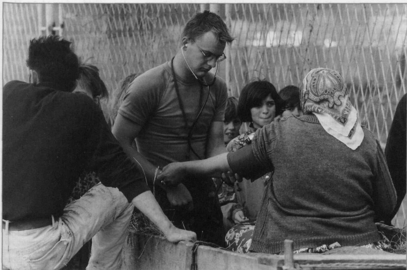
Medische hulp door kl-militairen aan de poort van de compound in Potočari