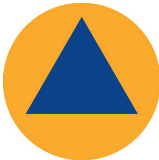
Figuur 4 Internationaal herkenningsteken van de civiele bescherming

Er bestaat ook een bestuurlijke netwerkkaart voor Defensie (zie afbeelding 6). Bij een crisis als oorlog worden waarschijnlijk meerdere functionele ketens geactiveerd naast de algemene keten. Ook is de kans groot dat in vrijwel alle regio's opgeschaald wordt naar GRIP 4. 15 Dit is een groter scenario dan tijdens de corona-