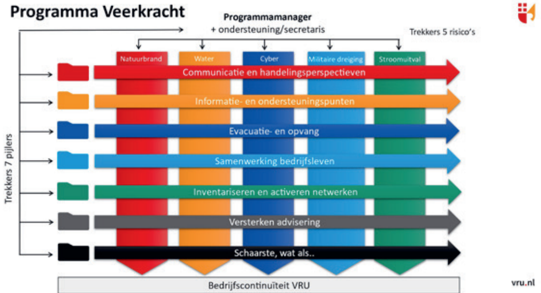
Figuur 3 Programma Veerkracht, Aanpak in matrix van generieke crisisprocessen en risico's.

en verantwoordelijkheden en de regionale operationele organisatie: wie doet bij een crisis wat en wie informeert wie?