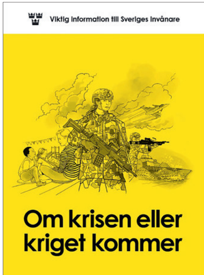
Zweden informeert burgers met de brochure 'Als de crisis of oorlog komt'

In dit artikel is een beeld geschetst van een groot aantal initiatieven die een bijdrage leveren aan het ontwikkelen van een weerbare samenleving die veerkrachtig is in geval van oorlog. Deze ontwikkelingen vinden plaats op internationaal, nationaal, regionaal en lokaal niveau. De