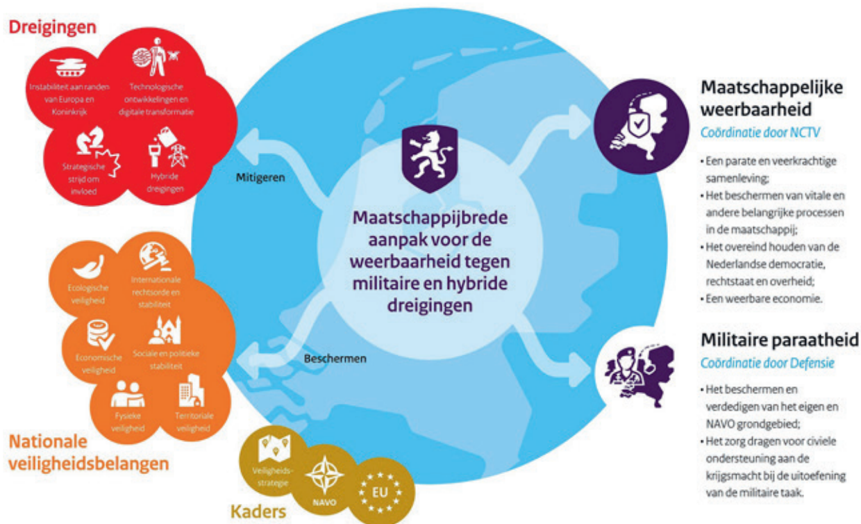
Figuur 6 Infographic Weerbaarheidsopgave van Nederland

Het kabinet onderkent twee pijlers binnen deze weerbaarheidsopgave. De eerste is militaire paraatheid (coördinatie bij het ministerie van Defensie): het vermogen van Nederland om het eigen en bondgenootschappelijke grondgebied te verdedigen. Naast het beschermen en verdedigen van het grondgebied gaat het om het waarborgen van civiele ondersteuning aan de krijgsmacht bij de uitoefening van de militaire taak. De tweede pijler is maatschappelijke weerbaarheid (coördinatie bij het ministerie van JenV, de NCTV). Dit gaat om de civiele weerbaarheid vergroten om maatschappelijke ontwrichting te voorkomen, beheersen en herstellen. Concreet vereist dit het beschermen van vitale en andere belangrijke processen in de maatschappij; een parate en veerkrachtige samenleving; het overeind houden van de