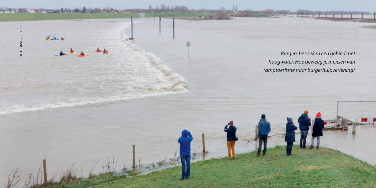
Burgers bezoeken een gebied met hoogwater. Hoe beweeg je mensen van ramptoerisme naar burgerhulpverlening?