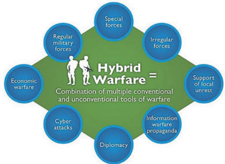
Figuur 1 Hybride oorlogvoering

Tijdens de NAVO-top in Warschau in 2016 zijn zeven zogenaamde baseline resiliënce requirements opgesteld. Deze doelstellingen vragen om een versterkte paraatheid van bondgenoten, om de continuïteit van overheid en essentiële voorzieningen voor de bevolking te waarborgen en ondersteuning te kunnen bieden aan militaire operaties tijdens vrede, crisis en conflict. Concreet richten deze basisvereisten zich op het continu functioneren van overheidsdiensten; de energievoorziening; voedsel- en watervoorziening; omgang met grotere verplaatsingen van groepen mensen; capaciteit voor massale groepen slachtoffers en op blijvend functionerende communicatie- en transport-systemen. Dit zijn de vitale processen om de