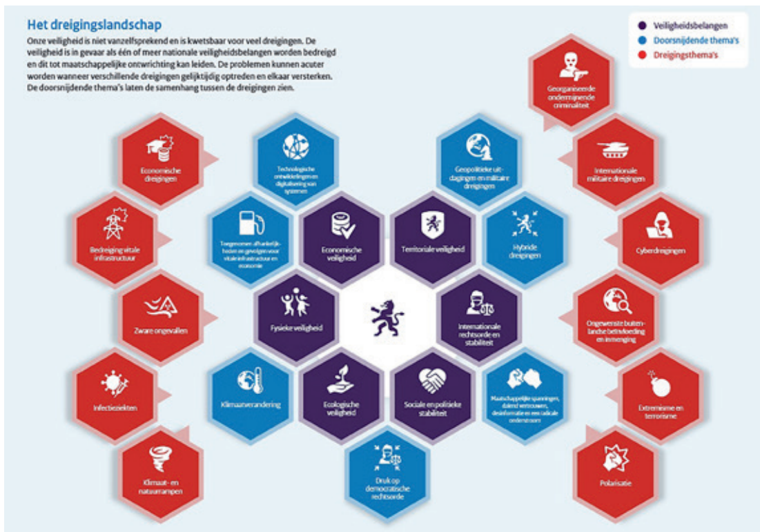
Figuur 2 De Veiligheidsstrategie in vogelvlucht

gebruik van economische, politieke, militaire en andere instrumenten waarbij de grens tussen oorlog en vrede steeds meer vervaagt, variërend van de beïnvloeding van de publieke opinie door desinformatie en propaganda, van cyberaanvallen en spionage, tot chantage, sabotage en aanvallen met CBRN-middelen. Dergelijke hybride aanvallen richten zich op de kwetsbaarheden van de tegenstander, zijn ambigu van aard en trachten doelbewust onder de drempels van detectie te blijven, wat attributie moeilijk maakt. Hybride aanvallen beogen bovendien om de democratische rechtsorde te verzwakken en de cohesie en solidariteit binnen de samenleving, de EU en NAVO te ondermijnen en zo de slagkracht aan te tasten. 13