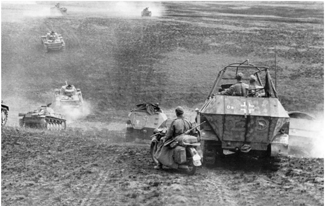
Duitse bevelhebbers waren beter in staat grote eenheden aan te sturen op het slagveld dan hun Britse tegenstanders – een gevolg van het verschil in tactiekonderwijs

Wereldoorlog en de gevolgen daarvan voor de oorlogvoering. 18 Daarin stelt hij dat de Engelse officieren veel slechter op de oorlog waren voorbereid dan de Duitsers. Zijn artikel biedt een relevant perspectief en mogelijk een gevoel van herkenning.