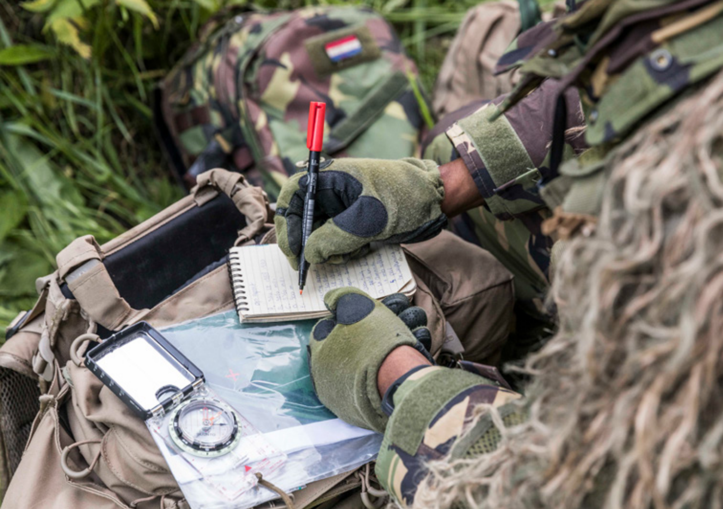
Academische vaardigheden kunnen prima in een militair-tactische omgeving worden toegepast