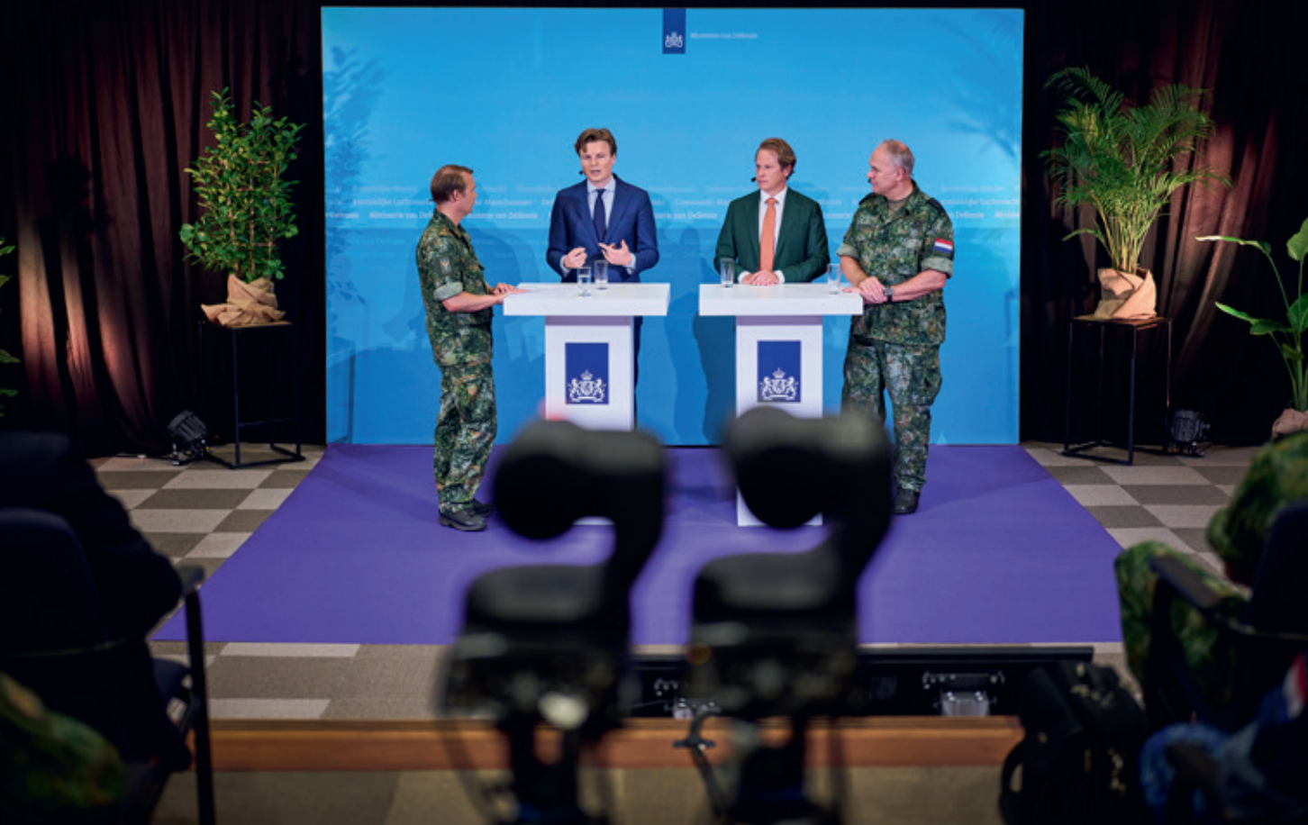
Minister van Defensie Ruben Brekelmans (tweede van links), staatssecretaris Gijs Tuinman en Commandant de Strijdkrachten Onno Eichelsheim lichten de Defensienota 2024 toe voor defensiepersoneel via Teams