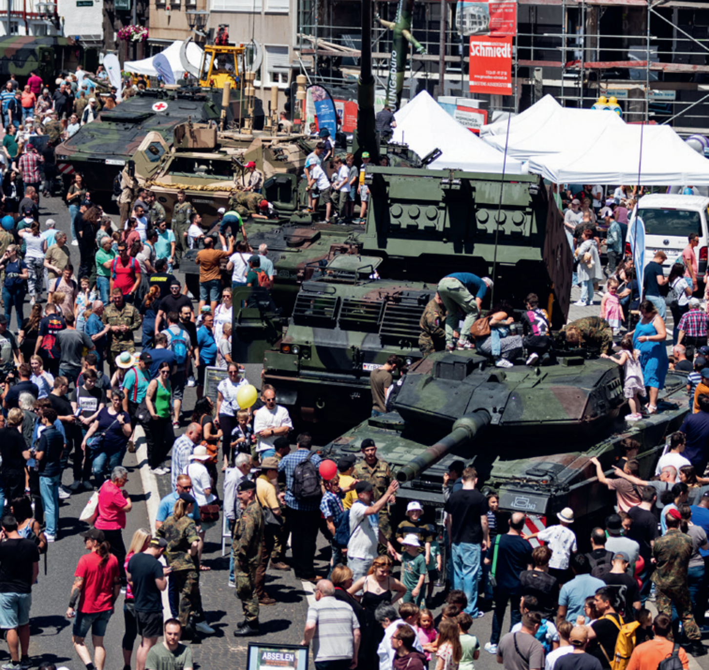
Publieke belangstelling tijdens de Tag der Bundeswehr, 8 juni 2024: maatschappelijke en sociaal-culturele veranderingen, in het bijzonder de secularisatie, stellen nieuwe uitdagingen aan de ethische concepten van de Bundeswehr

vrijheid, democratie, veiligheid) respecteert en beschermt. Ten slotte zijn er de maatschappelijke grondbeginselen. Die bepalen dat de samenleving van de Bondsrepubliek vrij, pluralistisch en democratisch is en dat de mensen in de Bundeswehr daar deel van zijn en zich tot deze verschillen positief, ook onder elkaar, moeten verhouden. Met deze basisbeginselen wordt duidelijk dat Innere Führung zich beweegt op het grensvlak van maatschappelijke waarden en militaire cultuur.