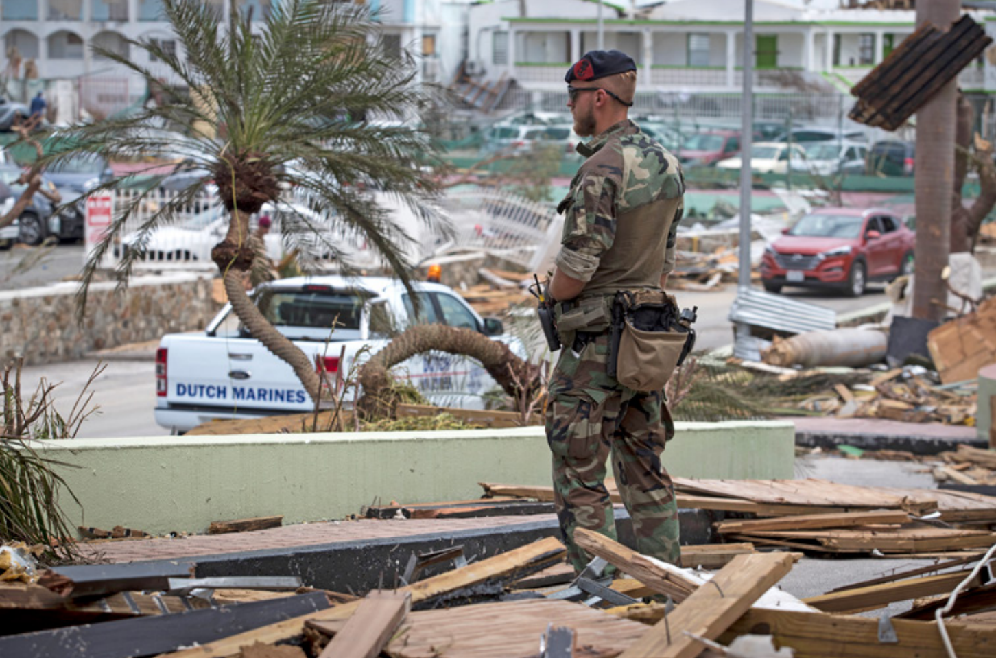
De Nederlandse krijgsmacht verleent steun aan Sint-Maarten nadat het eiland werd getroffen door orkaan Irma (2017). Hoe moet de krijgsmacht omgaan met (de gevolgen van) klimaatverandering?