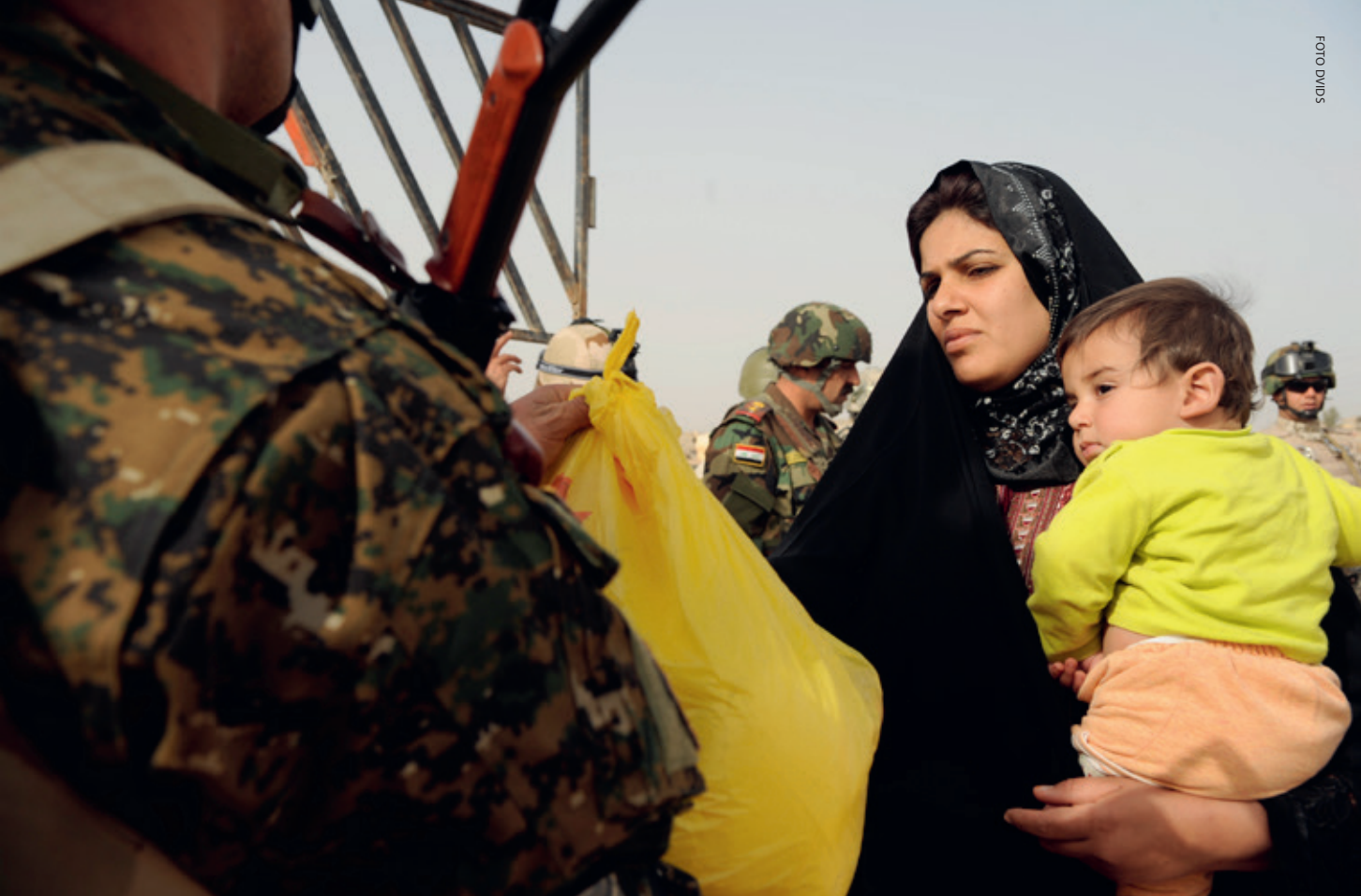
Een Iraakse militair reikt voedsel uit aan een vrouw in de wijk al Intisar in Mosul, 2009: sjiitische groepen, waaronder milities, hebben de afgelopen jaren hun invloed en macht in de overwegend soennitische stad en de regio weten te vergroten

terug naar Mosul, waar ze volgens de woordvoerder de veiligheid bewaken in de Vlakte van Nineveh samen met het reguliere leger. Ook controleren ze een aantal hoofdwegen, wat ze geld oplevert. 22 Op het moment wordt deze brigade grotendeels gecontroleerd door Badr.