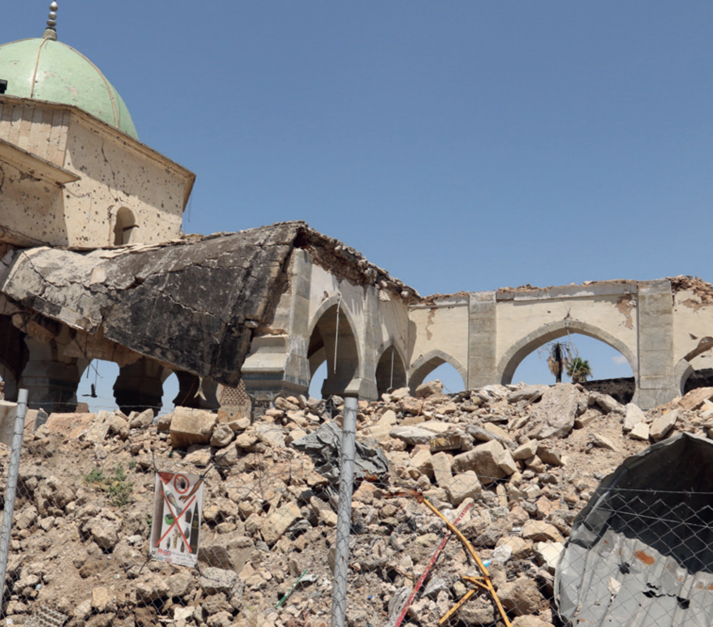
Tijdens de gevechten van 2017 raakten veel gebouwen in Mosul zwaar beschadigd: cultureel erfgoed wordt met hulp van internationale partijen hersteld

heidsrisico voor Irak in het algemeen en de stad Mosul in het bijzonder.