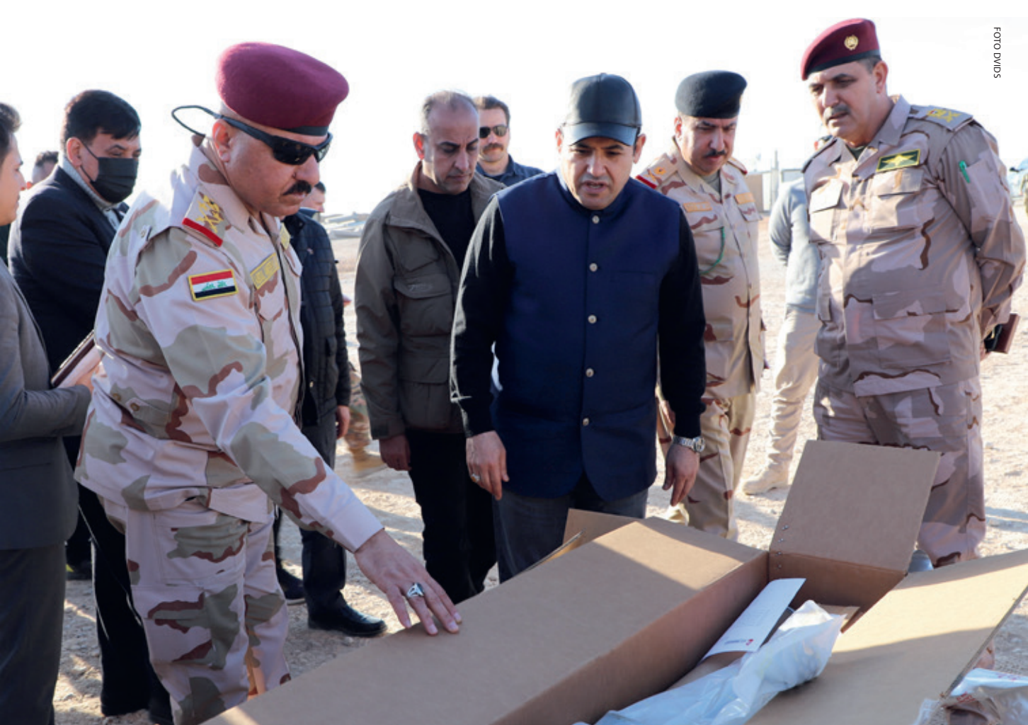
Voormalig minister van Binnenlandse Zaken en huidig nationaal veiligheidsadviseur Qasim al-Araji (midden) komt voort uit de Badr-organisatie

bestonden allemaal al ruim voor de formele oprichting van de PMU in 2014. 12 Hiernaast zijn er vele kleinere, minder machtige milities actief, die veelal zijn opgericht om tegen IS te strijden.