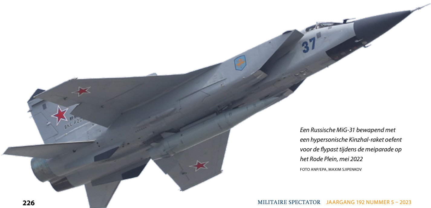
Een Russische MiG-31 bewapend met een hypersonische Kinzhal-raket oefent voor de flypast tijdens de meiparade op het Rode Plein, mei 2022