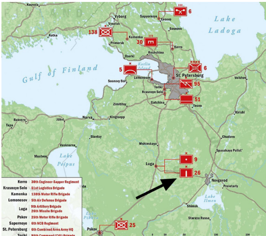
De Russische 26e Raketbrigade ondergeschikt aan het 6e leger

BRON: KONRAD MUZYKA, RUSSIAN FORCES IN THE WESTERN MILITARY DISTRICT (ARLINGTON, CIA, 2021) BLZ. 18