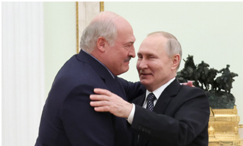
President Aleksander Loekasjenko (links) bezoekt het Kremlin in april 2023, nadat hij akkoord is gegaan met de stationering van Russische tactische kernwapens in zijn land