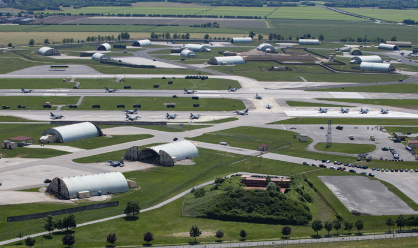
Hoewel de doelselectie onbekend is, zou Rusland met een kleine nucleaire lading de luchthaven van Aviano in Italië en andere voor de NAVO belangrijke locaties onbruikbaar kunnen maken