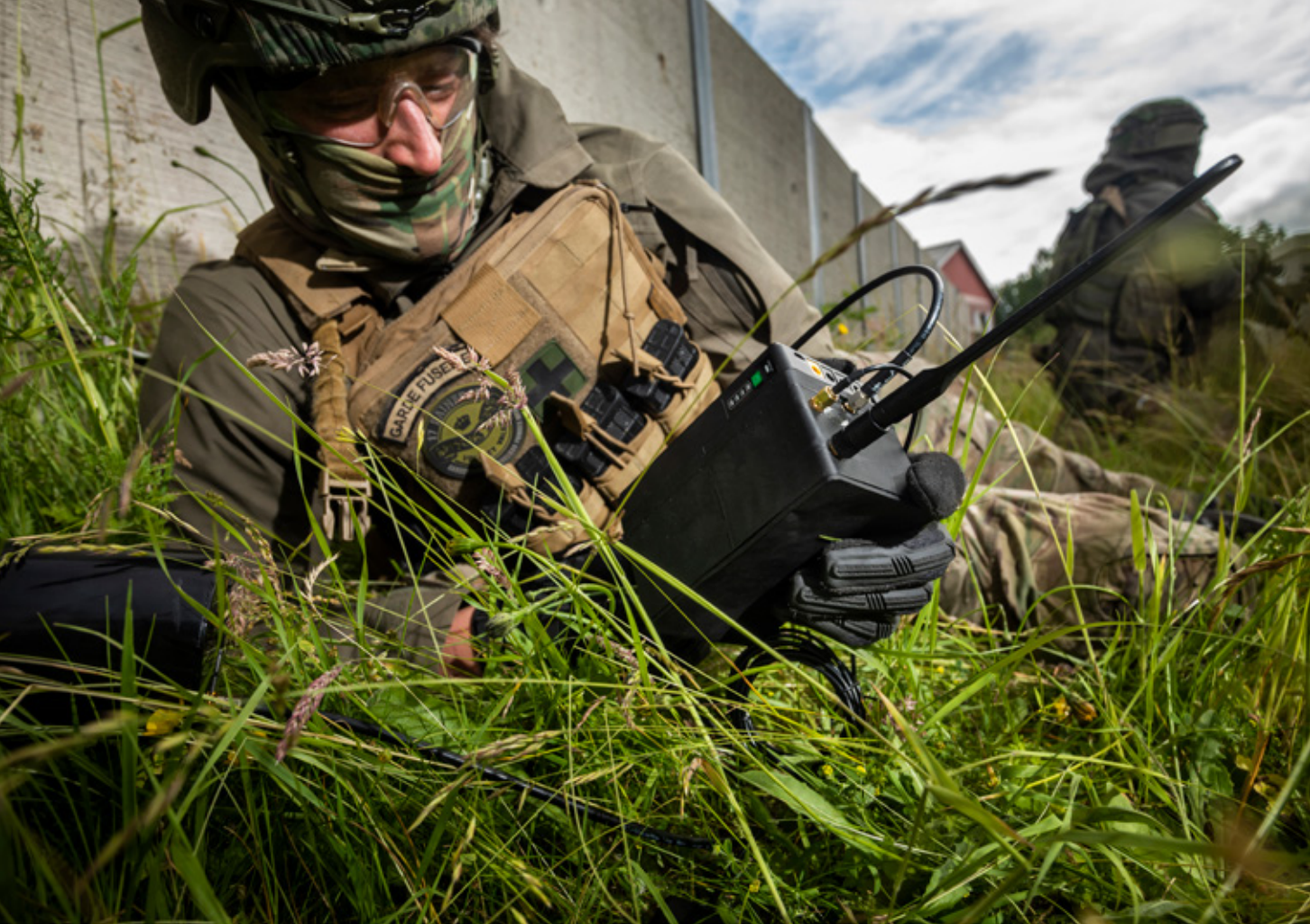
CEMA-oefening in Marnewaard. Om als krijgsmacht optimaal van de vele mogelijkheden van het cyber- en informatiedomein gebruik te kunnen maken zijn meerdere innovatieve perspectieven nodig