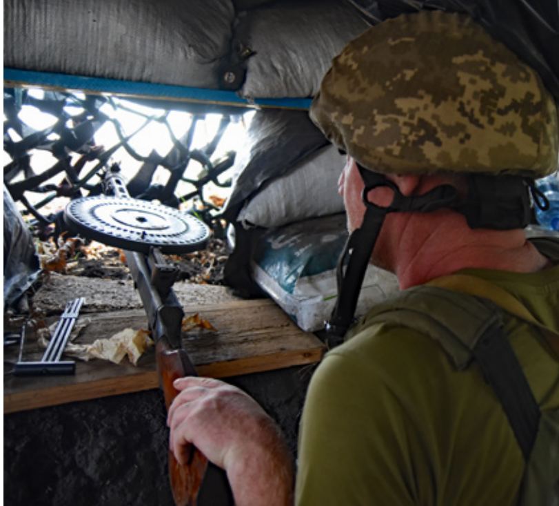
Een Oekraïense stelling in de buurt van Mykolaiv: 'Het gevecht in Oekraïne maakt duidelijk dat data een steeds crucialer element wordt'

buiten te treden, uiteraard zonder daarbij onze modus operandi en de bronnenpositie prijs te geven.