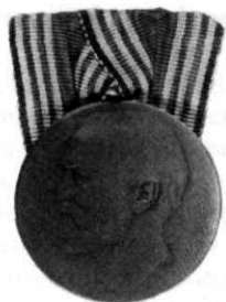
MEDAILLE VAN HET CARNEGIE HELDENFONDS brons/zilver

Voor actieve deelname aan het verzet 1940-1945. (zilver)