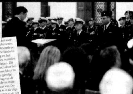
...ve spreekt de dapperen toe.