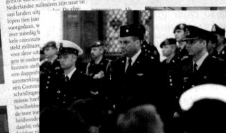
...dite 7-16 vliegtuigen tijl operatie een pulke prest richte. Zo goed zeldi, dat lige beschrijber van de strijkrachten in Zuid-E commandereend officier