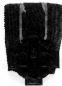
KRUIS VAN VERDIENSTE

Van alle grote gevoelens waarvan het menselijk hart in de opwinding van het strijdgewoel is vervuld, moeten wij toegeven, geen zo machtig en constant als de zielendorst naar roem en eer, die de Duitse taal zo onrechtvaardig behandelt door haar met twee pejoratieve nevenbetekenissen, Ehrgeiz en Ruhmsucht (begeerte naar eer, zucht naar roem), af te doen. Het is zeker waar dat juist in de oorlog