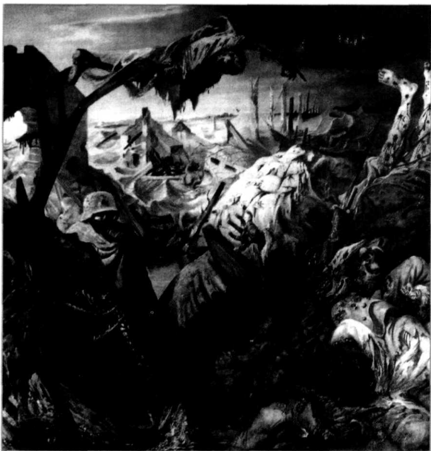
Otto Dix. Detail uit 'War Triptisch'

Als later in de oorlog ook gronddoelen door vliegtuigen worden aangevallen, neemt het psychologische effect van de inzet wel enigszins toe. De infanterist die tot dan toe alleen rekening had te houden met aanvallers die hem vanaf de grond konden benaderen, moest nu ook rekening houden met aanvallen die vanuit de lucht konden worden uitgevoerd.