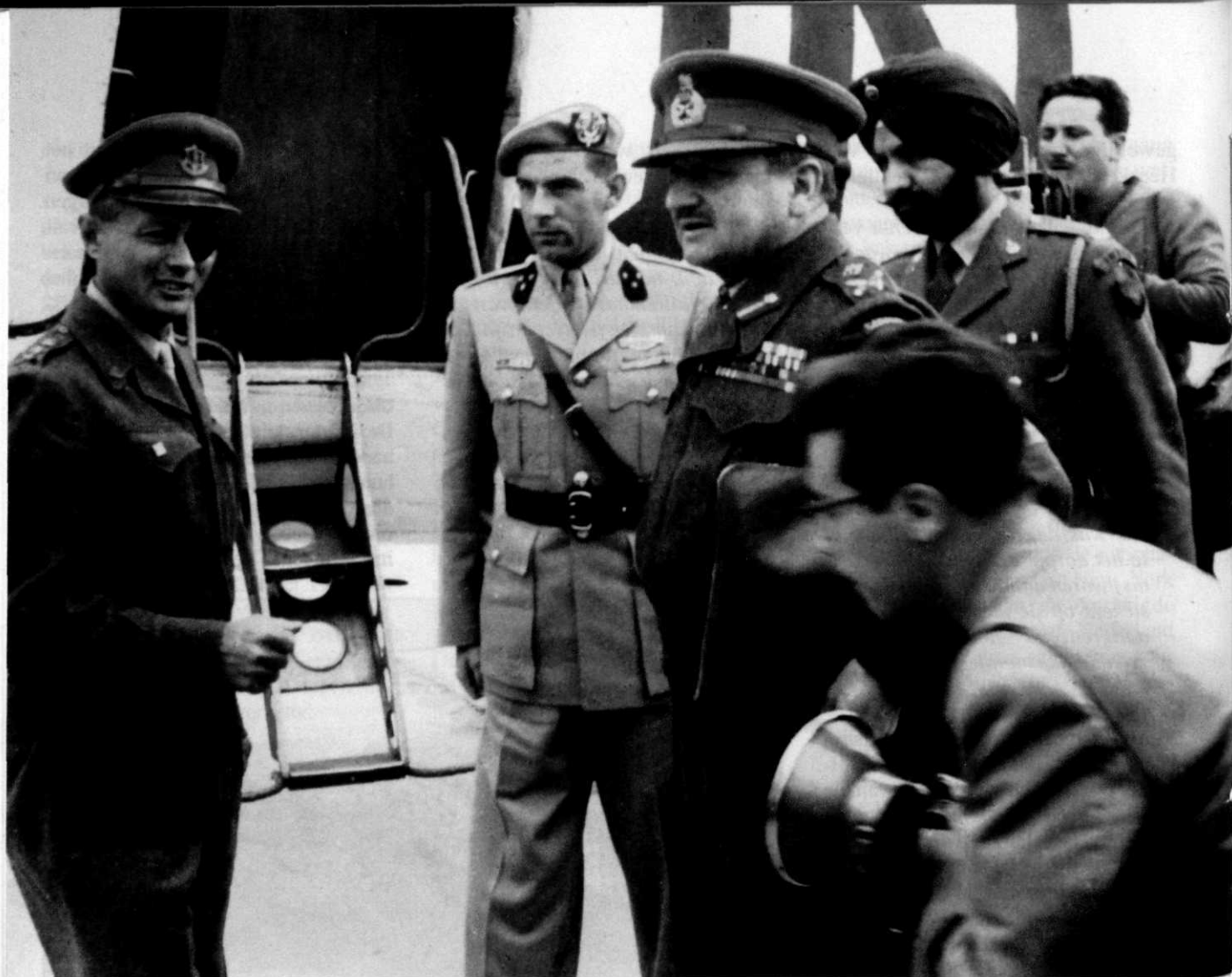
De Force Commander UNEF, generaal-majoor Burns (midden), ontmoet de Israëlische bevelhebber Dayan (links). Tussen beide in staat kapitein Bor, op dat moment G2 in de interim-staf van UNEF