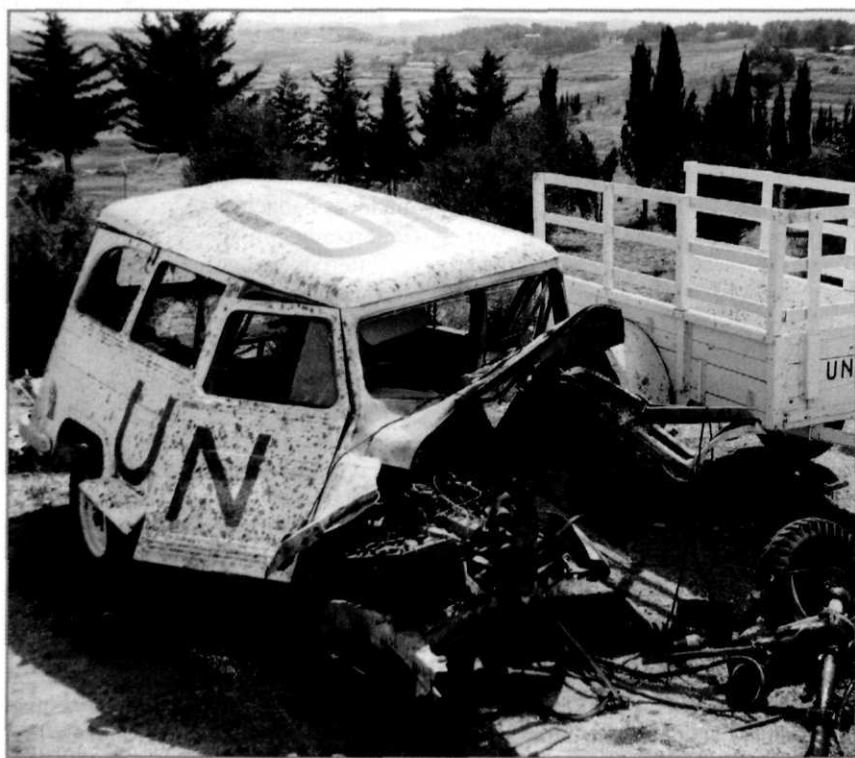
Het zwaar beschadigde voertuig van VN-radiotelegrafist Rasmussen, die er in juli 1956 mee op een mijn reed. Het incident met dodelijke afloop maakte een diepe indruk op de net gearriveerde Nederlandse officieren

Gremium van actie werd daarom de Algemene Vergadering, waar een meerderheid van de lidstaten op 2 november een gebruikelijke oproep tot een staakt-het-vuren afkondigde.