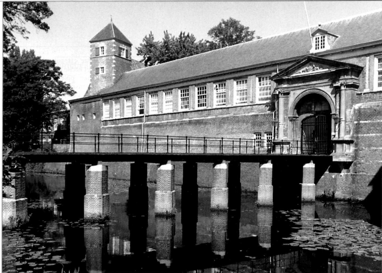
Het kasteel van Breda