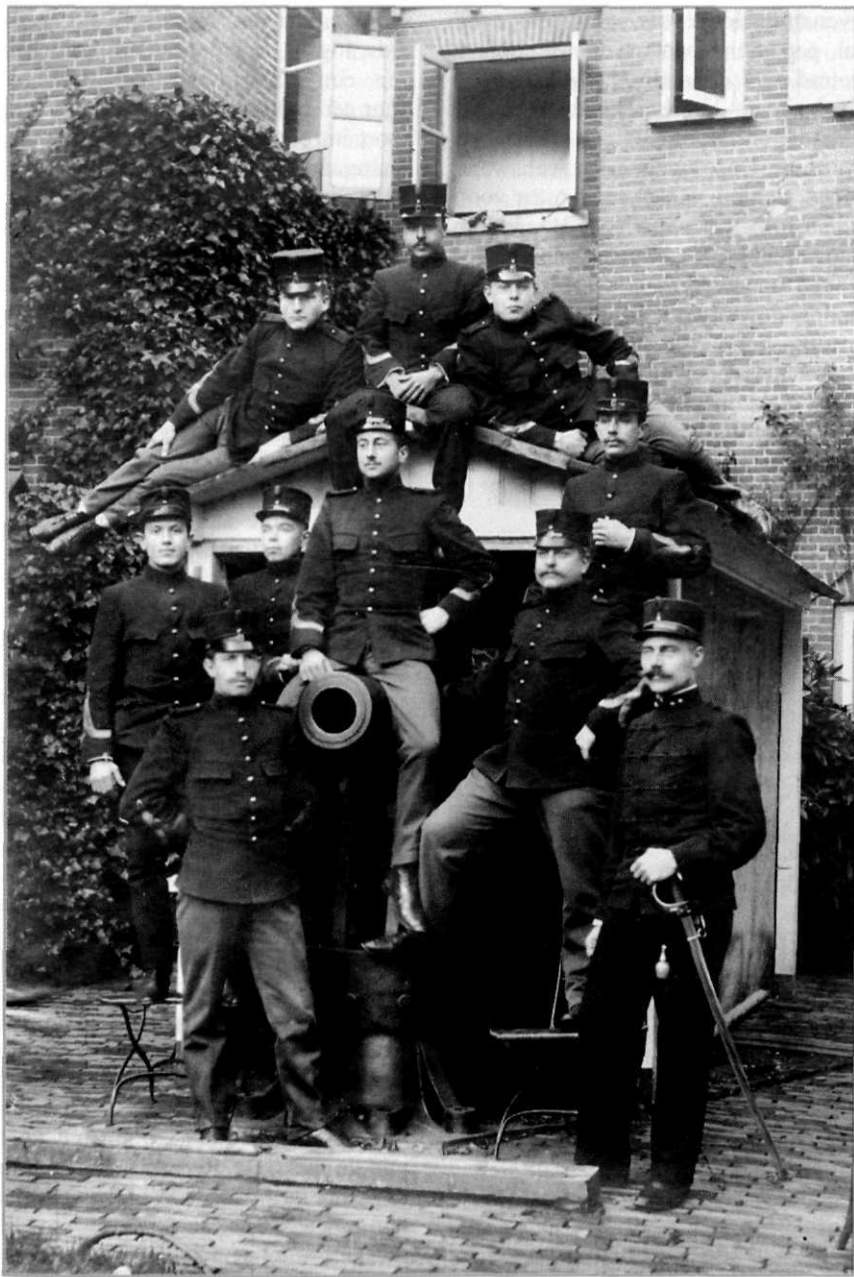
'Hoofdcursianen' geportretteerd bij kanon, 1912

opleidingsplaatsen aan de KMA blijvend te vullen. Reorganisaties van het militair onderwijs in Nederlands-Indië verergerden dit probleem. Om aan de wildgroei van diverse militaire scholen in 'de Oost' een einde te maken, besloot de regering dat vanaf 1890 alle officieren bestemd voor het koloniale leger in Indië hun officiersopleiding in Nederland zouden ontvangen. Dit noopte tot instelling van