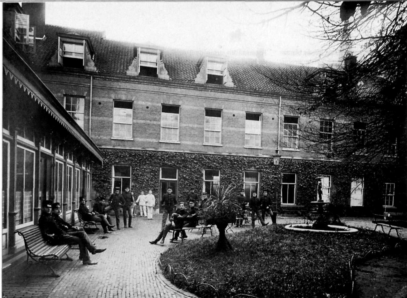
Locatie Hoofdcursus in Kampen, 1912

sing van de wet van 1890, die de vestigingsplaats van de Hoofdcursus vastlegde. Vanaf 1921 kon de Hoofdcursus bij wijze van proef in Breda gelegd worden. Op 1 oktober 1923 volgde de feitelijke verhuizing van de Hoofdcursus naar het Kasteel van Breda, waarbij het Hoofdcursuscorps fuseerde met het Cadettencorps. Het impliciete doel was opheffing. Op 1 augustus 1924 volgde de Centrale Cursus. Op 9 augustus 1928 legden, de laatste 27 'hoofdcursianen' de officierseed af. De 'Tweede Weg' zou voor een periode van bijna dertig jaar gesloten blijven.