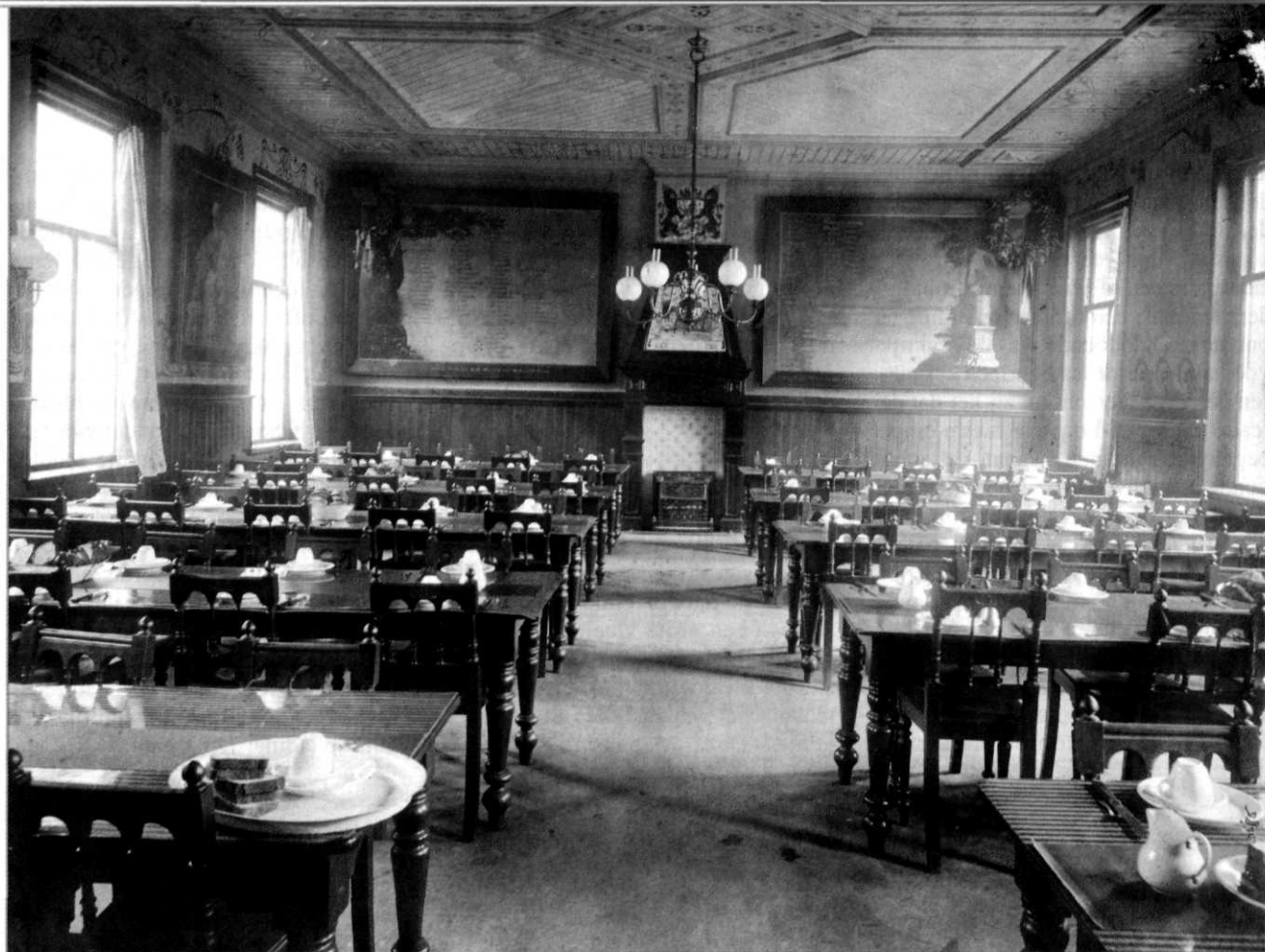
Eetzaal 'hoofdcursianen' in Kampen, 1910

van optreden binnen het leger niet ten goede.