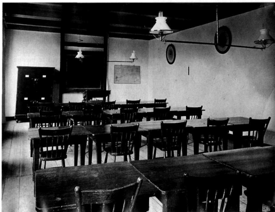
Leslokaal Hoofdcursus te Kampen

seerde onder andere een Assaut, destijds nog in de oorspronkelijke vorm van een schermwedstrijd gevolgd door een bal, een Dies Natalis en een soort introductieperiode voor nieuwe eerstejaars. 'Minerva' onderging in 1919 een reorganisatie, waarbij de leerlingenvereniging veranderde in het Hoofdcursuscorps, geleid door een Senaat. De overkoepelende organisatie kende zogenaamde onderafdelingen, waarin verenigingen van diverse signatuur onderdak kregen. Zo bestonden er diverse sportverenigingen, muziekverenigingen en een toneelvereniging. Sommige verenigingen traden in de openbaarheid door deelname aan sportcompetities of het geven van openbare culturele voorstellingen. Dit aspect van de Hoofdcursus kwam in zeer hoge mate overeen met het Cadettencorps in Breda.