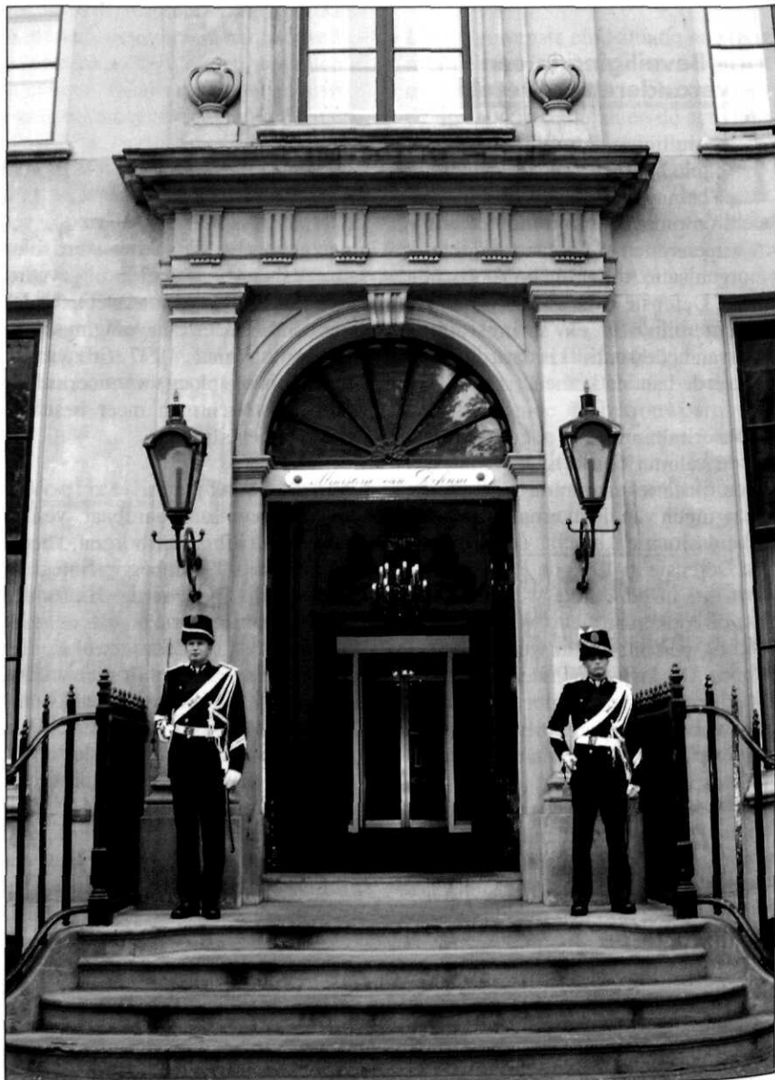
Het klassieke beeld van beveiliging van een militair object; in dit geval het ministerie van Defensie, Plein 4 te Den Haag

Richtinggevend op het gebied van beveiliging binnen Defensie is het document Defensie Beveiligingsbeleid (DBB) uit 1997. Dit is de eigenlijke