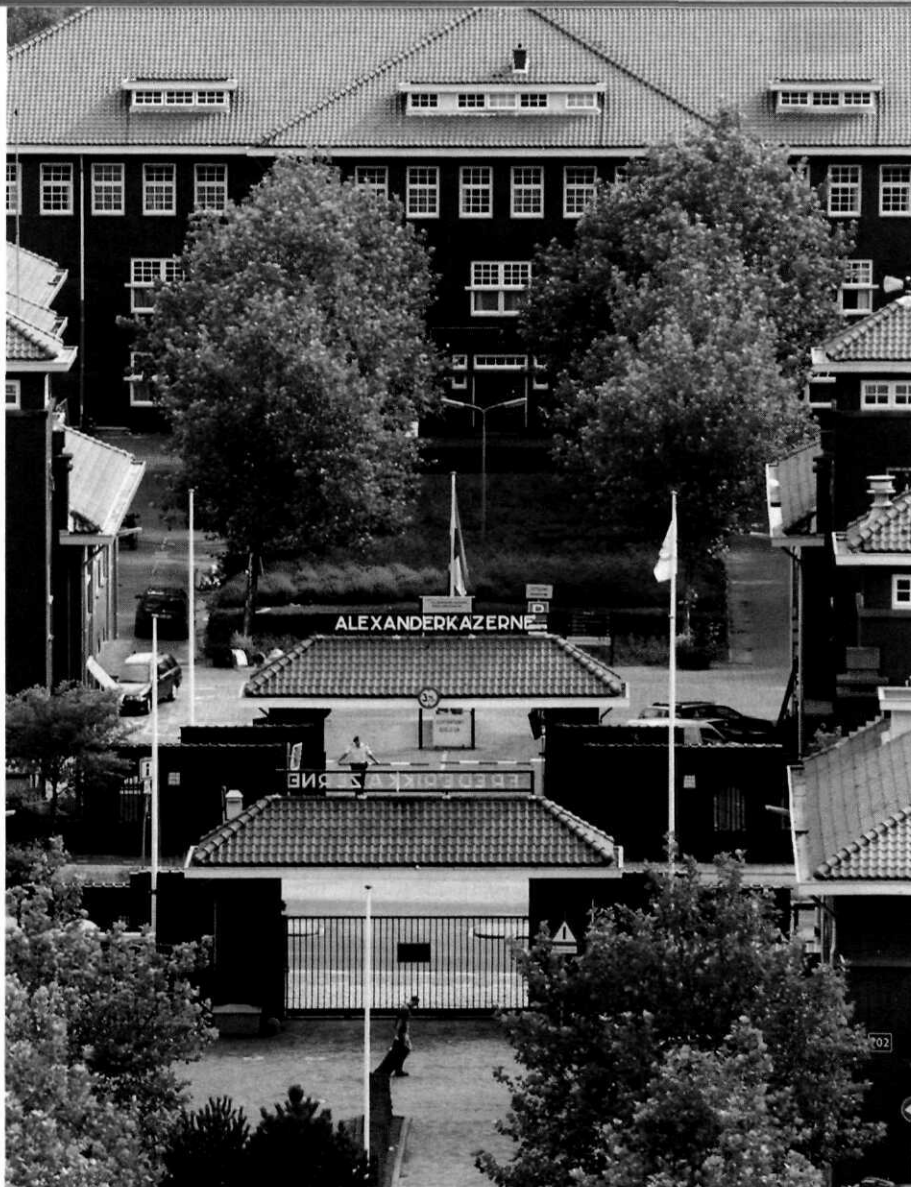
Zicht op de Alexanderkazerne te Den Haag

De Algemene Rekenkamer heeft daarom met instemming kennisgenomen van de beveiligingsmaatregelen die de minister reeds genomen heeft en de maatregelen die hij aankondigt.