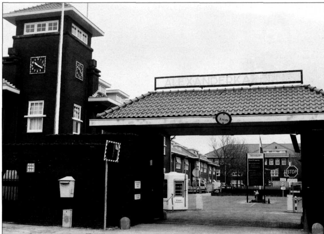
De dienstplichtige aan de poort is verdwenen

tie van de Beveiligingsautoriteit, mee laten wegen.