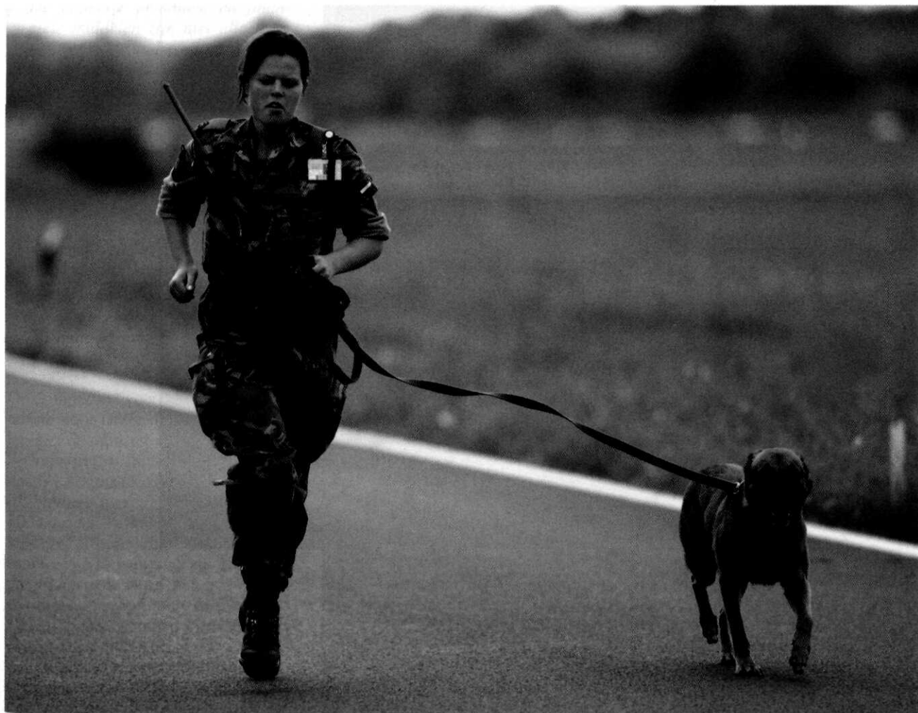
Demonstratie Luchtmacht-Beveiligingscorps tijdens de Open Dagen van de luchtmacht

gevoerd. Voorts beveelt de Rekenkamer aan om daadwerkelijk invulling te geven aan de functie van Beveiligingsautoriteit, waardoor deze zijn beleidsbepalende, beleidsuitdragende en toezichthoudende functie kan vervullen.