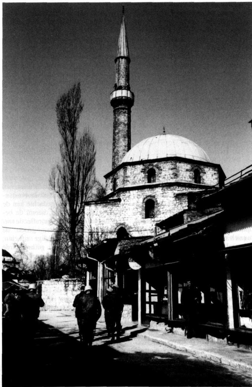
Nederlandse militairen passeren een moskee in een dorp in Bosnië-Herzegovina, circa 1995

De socioloog Ulrich Beck heeft zo'n vijftien jaren geleden gewezen op ontwikkelingen die hedendaagse samenlevingen tot zogenaamde 'risk societies' maken. Hij wees op toenemende onzekerheden die het hedendaagse leven kenmerken: economische onzekerheid als gevolg van flexibele arbeidsvormen en toenemende concurrentie in binnen- en buitenland, bestaansonzekerheden als gevolg van toenemende individualisering (afbraak welvaartstaat, scheidingen, trek naar de grote steden), en