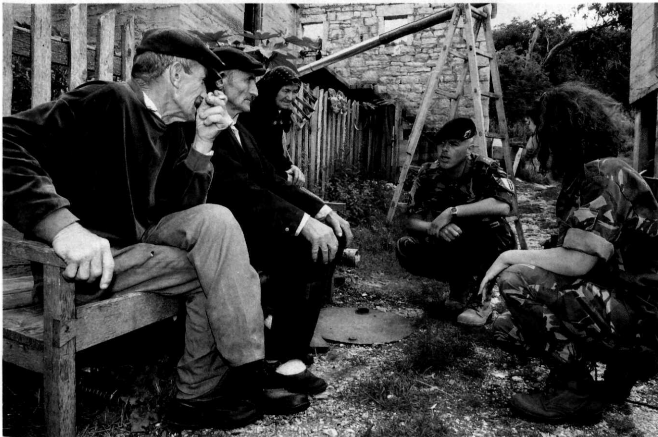
Nederlandse SFOR-militairen in Bosnië-Herzegovina, 2003