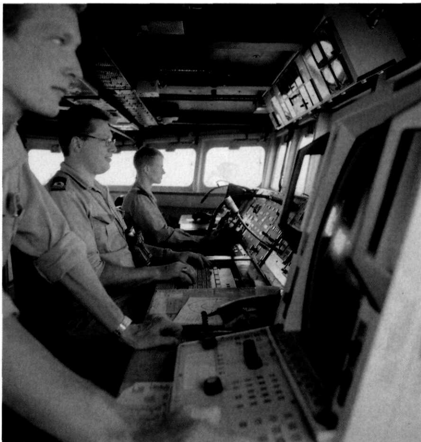
Brug van een M-Fregat

Werkzaamheden die gericht zijn op het inwinnen van informatie over de plannen van de militair commandant en het op basis daarvan en op basis van juridische kennis en kunde aanbevelingen doen op het gebied van een of meer spe-