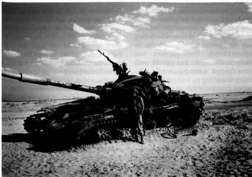
Amerikaanse militair poseert bij uitgeschakelde Irakese tank tijdens operatie 'Desert Storm'

De adviesrelatie is niet wettelijk geregeld. Wie is er nu verantwoordelijk voor het advies met de aanbeveling van de militair juridisch adviseur? Kan de geadviseerde commandant wel de volledige verantwoordelijkheid nemen als hij zo afhankelijk is van zijn militair juridisch adviseur? De commandant heeft de verantwoordelijkheid voor de beslissingen waarvoor hij de bijstand vraagt. Hij maakt zelf de afweging ten aanzien van de finale beslissing. De commandant is dus ook degene die afweegt hoeveel risico hij met een bepaalde beslissing wenst te lopen en de daarmee samenhangende juridische gevolgen inschat. 26