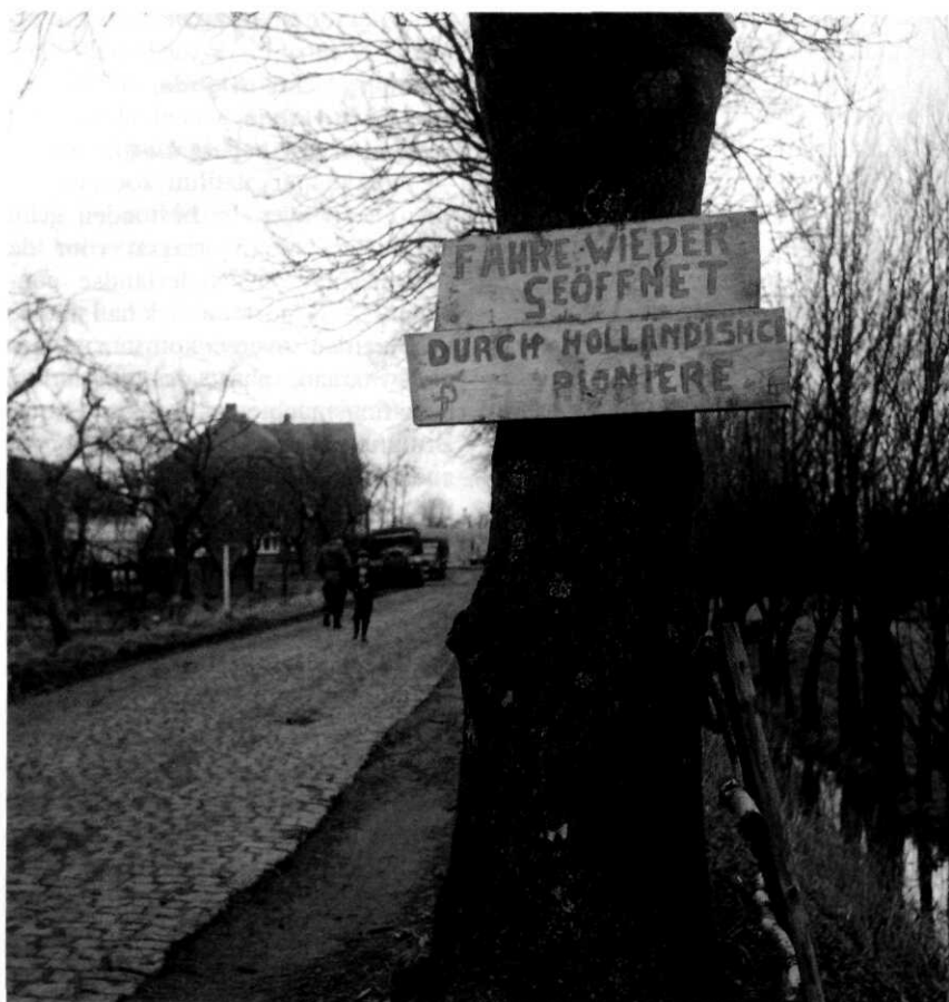
Nederlandse bijstand tijdens stormvloed bij Hamburg, februari 1962