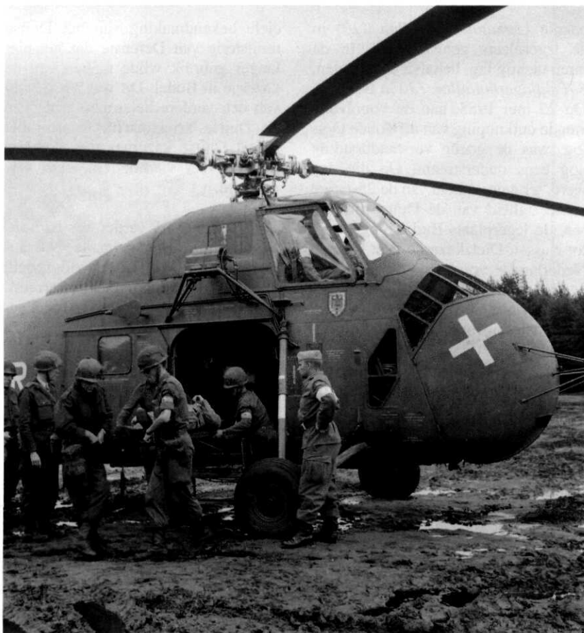
Gezamenlijke oefening van Nederlandse en Duitse eenheden, Lüneburger Heide, herfst 1965

Budel is dit jaar al door de Duitsers ontruimd. In de loop der jaren waren er nog enkele aanvullingen in de bezetting geweest. In de jaren zeventig heeft, naast de opleidingseenheden, enige tijd een geneeskundige com-