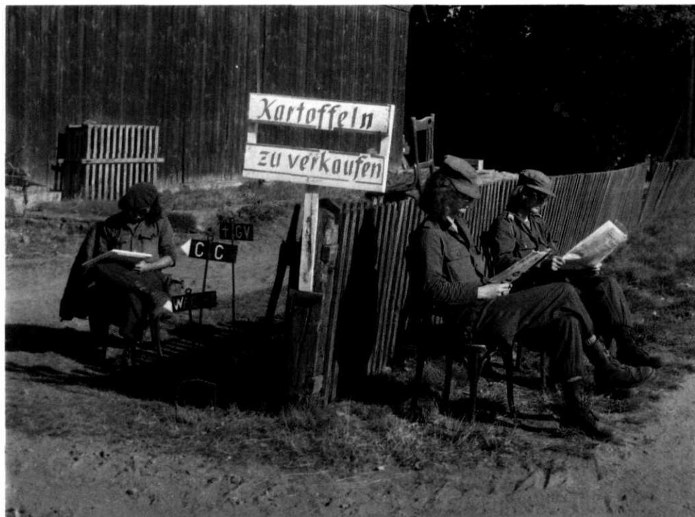
Oefening 'Big Ferro', Duitsland, 1973

pagnie (1./Sanitätsbataillon 110) in de legerplaats gebivakkeerd. In de jaren tachtig lag, behalve de rekruten, 8./Feldjägerbataillon 730 in Budel.