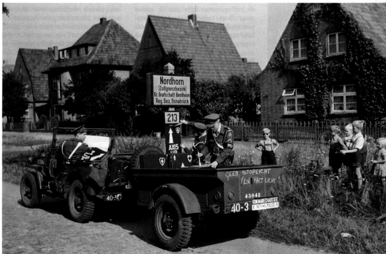
NAVO-oefening 'Grand Repulse', Duitsland, 1953