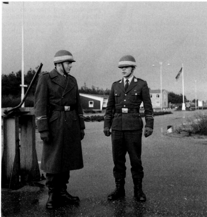
Duitse militairen in legerplaats Budel, 1967

Ook de lokale bevolking was verdeeld. De meeste mensen begrepen verstandelijk de noodzaak van de komst van de Duitse troepen, maar zo kort na de oorlog, die ook in Budel zijn sporen had achtergelaten, hadden zij er gevoelsmatig moeite mee. De protesten en bedenkingen verdwenen vrij snel nadat de Duitse militairen eenmaal waren gearriveerd en zich tactvol gedroegen, onder meer door zich buiten diensturen niet in uniform buiten de legerplaats te vertonen. Al