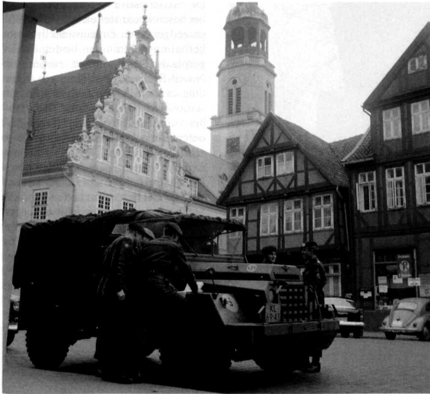
Oefening Lichte Brigade, omgeving Hohne, november 1961

tactische nucleaire wapens in de geallieerde defensie maakten het mogelijk in 1958 de hoofdverdedigingslijn 'vooruit' te schuiven naar de rivieren de Weser en de Fulda. Dat was voor Nederland strategisch gezien een historisch moment.