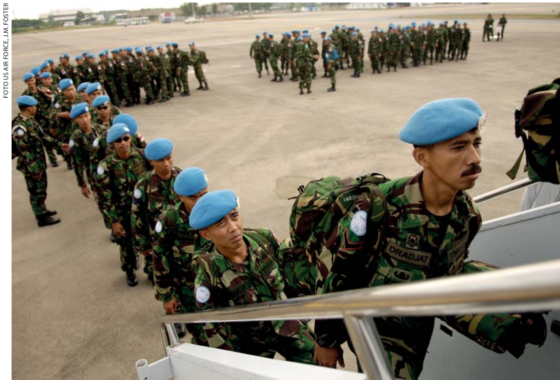
FOTUS AIR FORCE, J.M. FOSTER

De mogelijke spanningen die vervolgens optreden kunnen volgens Franke worden opgelost door de oplossingsstrategieën: ontkenning, ondersteuning, differentiatie of integratie. De meest simpele en weinig effectieve manier van omgaan met spanning als gevolg van con-