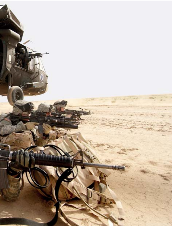
Irak, 2006. Amerikaanse militairen tijdens een aanvalsmis­sie. De helikopter behoort tot de ‘Task Force No Mercy’...

omschrijven in een definitie. Maar onderscheid, en begrip voor het onderscheid, is van groot belang omdat het duidelijk maakt waarvoor militairen worden ingezet, wat ze kunnen verwachten, welke taken ze moeten uitvoeren en welke taakopvatting daarbij hoort. Een voorbeeld van dit belang is te vinden in de opmerking van een militair naar aanleiding van diens missie in Somalië, die in 1992-1993 in korte tijd wijzigde van humanitaire hulp naar peace-enforcement en terug naar peacebuilding.