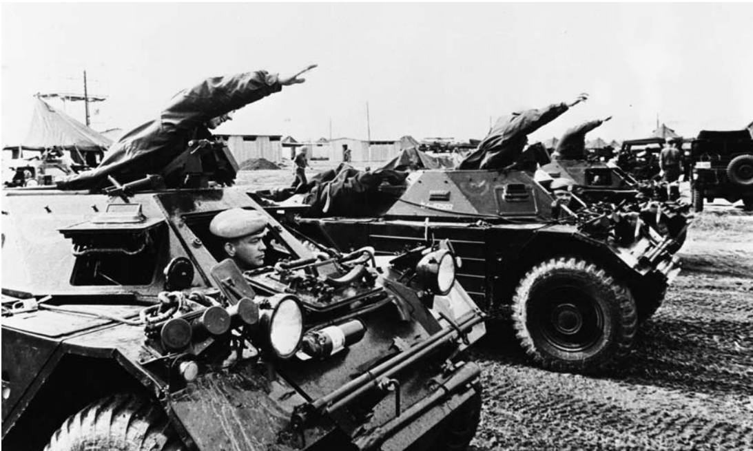
Tijdens de Koude Oorlog waren er slechts enkele VN-missies. Hier: Britse militairen in VN-verband in Cyprus, circa 1963

cludeert dat er onder de Amerikaanse militairen die in 1992 deelnamen aan de missie in Macedonië op zijn minst sprake is van gemengde gevoelens en dat er geen duidelijk dominant standpunt is over deelname aan deze peacekeeping-operatie. 25