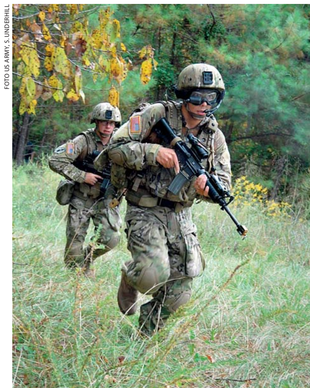
Toekomstige uitrusting van de 'Future Force Warrior'

Met andere woorden, zowel de warrior als de