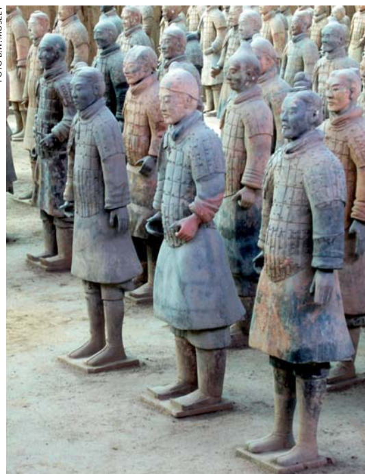
De 'warrior' bestaat al sinds mensenheugenis. De maatschappelijke waardering voor de 'warrior' verschilt door de tijd heen