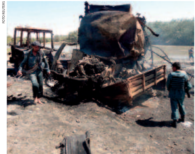
Volgens de aanklager kon de Duitse commandant niet voorzien dat er bij de luchtaanval burgerslachtoffers zouden vallen

hij de drempelwaarde voor dit type conflict overschreden. Bij gebrek aan twee statelijke opponenten is pas sprake van een NIGC indien er (1) feitelijke vijandelijkheden zijn van een zekere intensiteit, bestaande uit aan elkaar gerelateerde gewapende ‘incidenten’, die (2) uitgevoerd worden door tegenover elkaar staande georganiseerde gewapende groepen die over het vermogen beschikken om over een langere periode militaire operaties te ondernemen. 20 De conclusie van de Generalbundesanwalt impliceert dat aan beide criteria – intensiteit van gewapend geweld en georganiseerde gewapende groepen – is voldaan. Dit betekent dat het oorlogsrecht van toepassing is voor de strij-