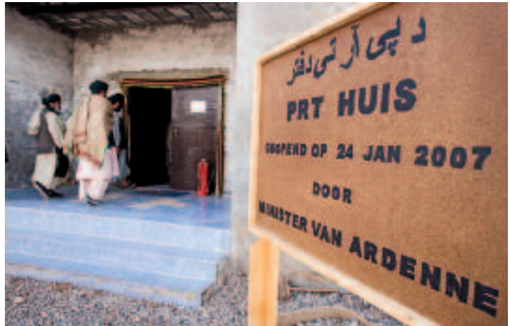
Enkele Afghaanse krijgsheren gaan het PRT-gebouw in Tarin Kowt binnen voor overleg

zelf bepalen hoe hun eenheden worden ingezet. De nationale beperkingen die landen opleggen variëren van geografische beperkingen voor hun eenheden tot de inzet van wapensystemen. Het nationaal belang van de NAVO-lidstaten is vaak bepalend voor de nationale restricties die ze verbinden aan de inzet van hun troepen in multinationaal verband. 6