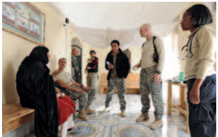
De aanvankelijk vrije evolutie van PRT's had positieve en negatieve kanten