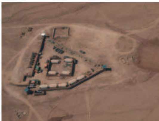
Patrouillebasis Mashal in aanbouw

En in de Baluchivallei zelf organiseert het PRT na twee dagen de eerste shura (Afghaanse bijeenkomst van stamoudsten) waarbij de maliks (stamoudsten) van de belangrijkste leefgemeenschappen aanwezig zijn, inclusief zestig tot honderd bewoners. De politiek adviseur van de TFU heeft vrijwel dagelijks contact met een in ballingschap levende lokale leider uit Baluchi.