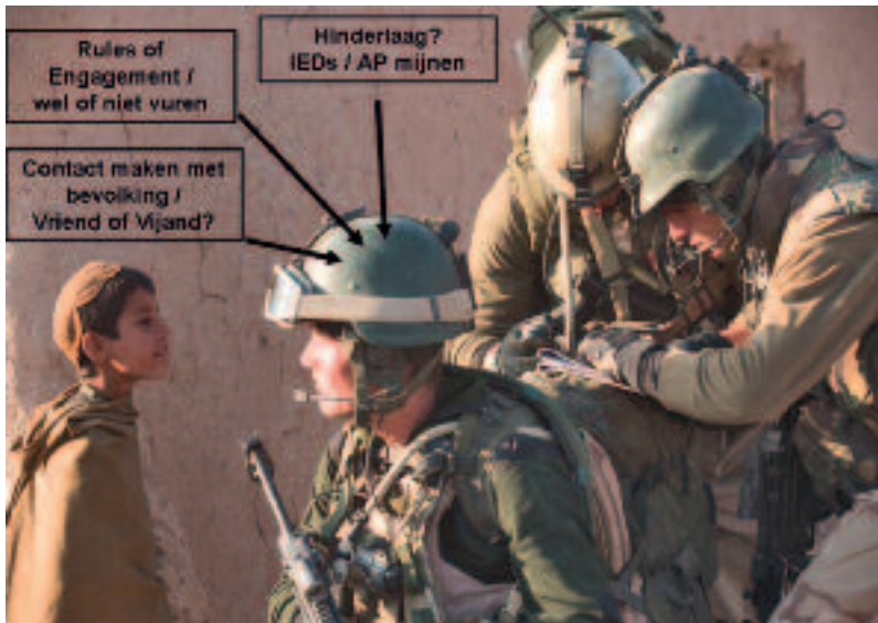
Links: mentale belasting, onder: fysieke belasting

pelotons, maar ook het personeel van het PRT, het PSE en niet te vergeten de genie, meer dan 20 dagen per maand buiten de poort.