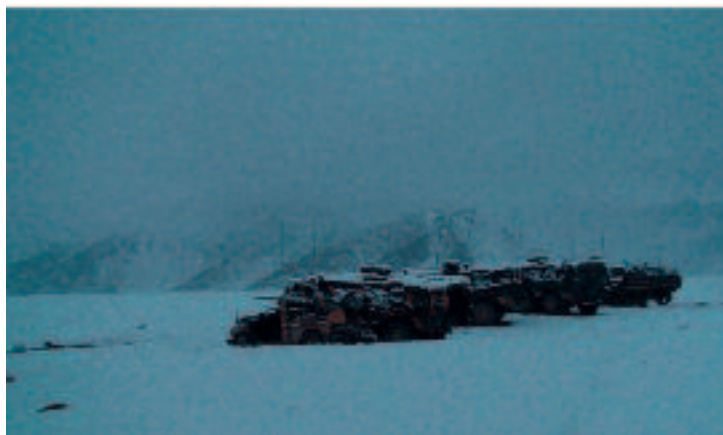
Onverwachte sneeuw in het verzamelgebied Daggar

De moraal van het verhaal is dat staftrainingen en grondig repeteren vruchten afwerpt.