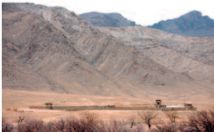
Patrouillebasis Mashal gereed

Operatie Tura Ghar kende een gedegen voorbereiding, inclusief zogeheten full dress rehearsals op alle niveaus, waarbij de gehele operatie volledig is gerepeteerd. Een operatie met minimale voorbereidingstijd was operatie Phoenix.