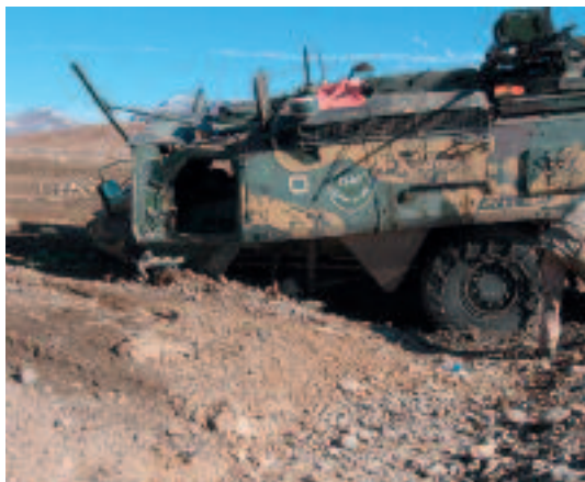
Een voertuig dat is beschadigd door een IED

worden. Het is dus eigenlijk ‘gevonden worden, binden, slaan’. En als je het niet goed doet: ‘gevonden worden, gebonden worden, geslagen worden’. Het initiatief om te vechten ligt in de counterinsurgency-operatie in Afghanistan dus primair bij de tegenstander, en de kunst is om dat moment van initiatief zo kort mogelijk te houden.