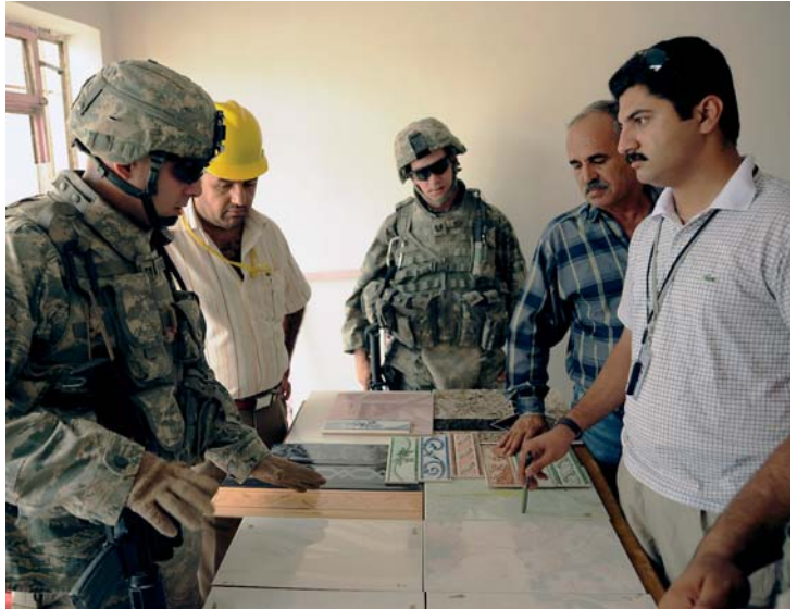
Welke tegels zijn het best geschikt voor de bouw van een jongensschool? (Irak, 2008)

opstellen van afroepcontracten voorafgaand aan operaties.