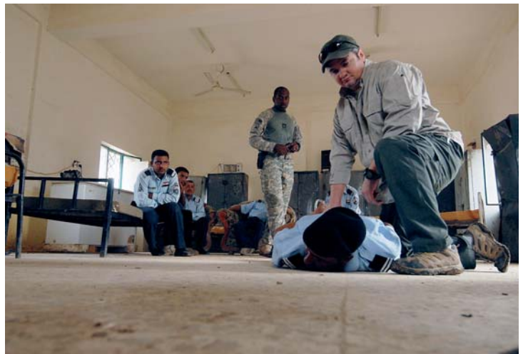
Contractanten van DynCorp International trainen de Iraakse politie (Irak, 2008)

opleveren doordat juist in geval van lokaal personeel niet eenvoudig is vast te stellen of ze (vrijwillig of gedwongen) collaboreren met de vijand. Ze kunnen inlichtingen vergaren en juist daar waar je het niet verwacht eigen personeel aangrijpen. De mogelijkheden om ongewenst gedrag te corrigeren of om civiel personeel te bestraffen zijn vaak beperkter dan bij militair personeel; op Nederlands militair personeel zijn immers de krijgstuicht en het (militair) strafrecht van toepassing.