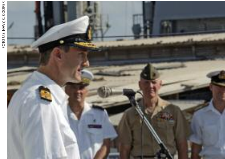
Na overname van het bevel over CTF-150 werd commandeur Hank Ort (links) al snel geconfronteerd met het lastige probleem van de piraterij

de Indische Oceaan. De deelnemende coalitie-landen namen bij toerbeurt de leiding over CTF-150 op zich. CTF-150 kon echter niet verhinderen dat een tweede schip doelwit werd van maritiem terrorisme: op 6 oktober 2002 vond vlak onder de kust van Jemen