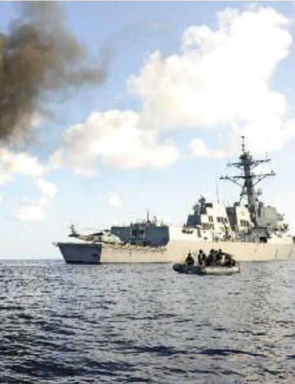
Optreden van CTF-151 in de Indische Oceaan: een vermeend piratenbootje is onschadelijk gemaakt

raketten in te zetten, heeft een maritieme component zodra de vlucht van een dergelijk projectiel vanuit zee kan worden gedetecteerd of onderschept. CMF is een bestaande coalitie die dagelijks opereert in de nabijheid van de Iraanse wateren. Dat maakt dat CMF een belangrijke rol zou kunnen spelen in de verdediging tegen zowel mogelijke Iraanse Sea Denial-operaties in de Straat van Hormuz, als tegen een mogelijke Iraanse aanval met ballistische raketten op de olierijke landen van het Arabische schiereiland en verder weg gelegen doelen.