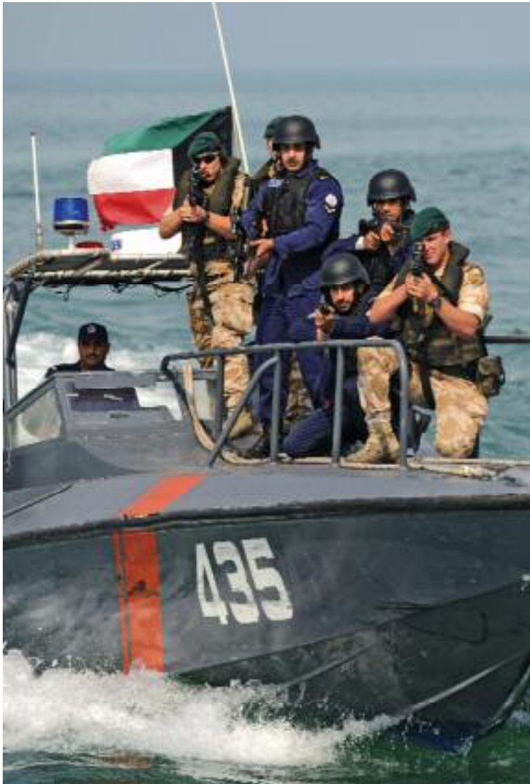
CMF biedt de mogelijkheid samen te werken met marines van uiteenlopende landen

Maritime Security Operations en het Global Maritime Partnership in de praktijk in een regio met vele maritieme uitdagingen. CMF is ook een flexibele organisatie: de Amerikanen hebben de structuur van de coalitie altijd zo weten aan te passen dat mandaatverschillen konden worden geacommodeerd. Samen met de Amerikaanse Vijfde Vloot is CMF de belangrijkste maritieme speler in de regio. Deelname in CMF geeft Nederland dan ook de mogelijkheid om dicht bij de zenuwcentra te zitten van de twee grootste militair-maritieme spelers, de