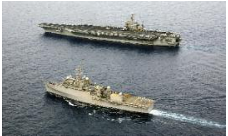
Het Amerikaanse stafschip USS LaSalle (onder) deed lange tijd dienst als hoofdkwartier CMF

bestrijdingsgroep (TF-52), een logistieke taakgroep (TF-53), een onderzeebootgroep (TF-54) en een groep maritieme patrouillevliegthuigen (TF-57). Vanwege hun nummering heten deze groepen de two-digit TF's .