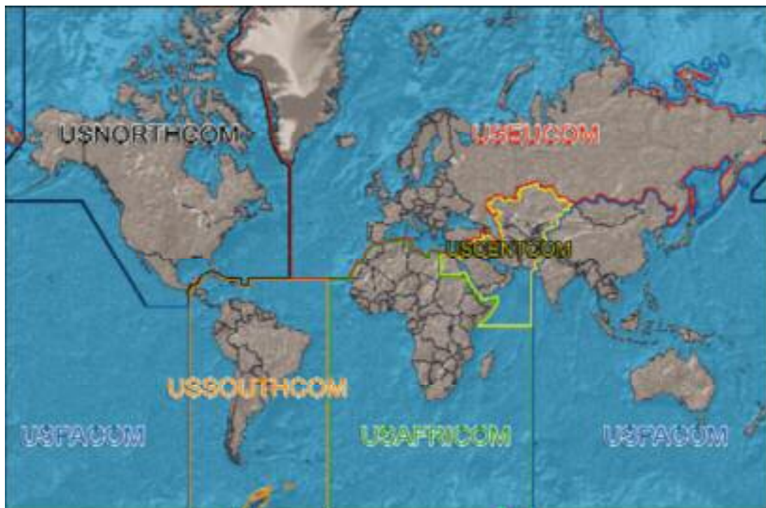
Kaart van de Amerikaanse Unified Commands

kaanse inlichtingenproducten kunnen worden gedeeld met de coalitiepartners, ontstond behoefte aan een eigen maritieme inlichtingen-cel. Voorjaar 2005 werd daartoe een Coalition Intelligence Fusion Cell opgericht. Deze CIFIC fungeert als stafafdeling maritieme inlichtingen (N2) van de coalitie, naast maar tevens in nauwe samenwerking met de Amerikaanse evenknie NAVCENT/N2. Later dat jaar ontstond uit eenzelfde behoefte op het gebied van resultaatmeting een Coalition Operational Analysis Cell (COAC). Deze twee bureautjes vormden de kiem van waaruit zich in de jaren daarna geleidelijk een operationele staf ontwikkelde.