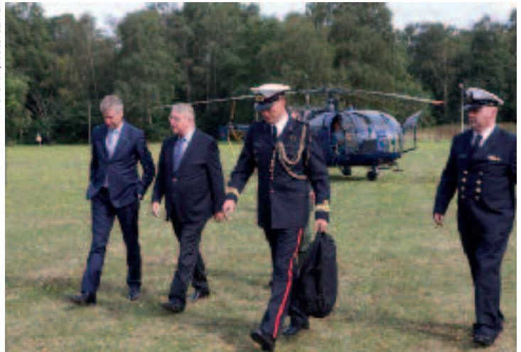
De ministers De Crem en Hillen (eerste en tweede van links) hebben de Benelux-samenwerking steeds genoemd als een kans om kosten te sparen