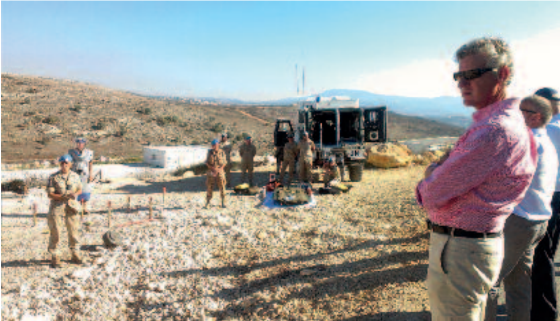
Minister van Landsverdediging De Crem (rechts) bezoekt Belgische militairen die in Zuid-Libanon gestationeerd zijn

werking op Benelux-niveau. Tijdens zijn eerste buitenlandse bezoek deed minister-president Rutte in oktober 2010 Brussel aan en stond intensivering van defensiesamenwerking op de agenda. Na het aantreden van de Belgische minister-president Di Rupo was zijn eerste buitenlandse reis, op 18 januari van dit jaar, naar Den Haag en werd eveneens defensiesamenwerking besproken. De beleidsbrief van voormalig minister van Defensie Hillen vermeldde over de intensivering van de Benelux-defensiesamenwerking 'verdere mogelijkheden tot samenwerking en integratie op militair gebied, naar het voorbeeld van Belgisch-Nederlandse marinesamenwerking (Benesam), uit te werken, met als doel de krijgsmachten dichterbij elkaar te brengen, kosten te delen en besparingen te boeken' . 4