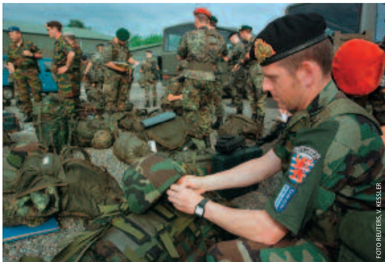
De Luxemburgse krijgsmacht heeft geïnvesteerd in nichecapaciteiten en heeft ervaring met deelname aan internationale operaties zoals op de Balkan

groten van de operationele doeltreffendheid door het samenstellen van een zo mogelijk modulair opgebouwde ontploerbare eenheid, de Deployable Air Task Force (DATF). De luchtmachten maken ook deel uit van de overeenkomst voor de FAC-opleidingen. In de afgelopen periode heeft Nederland zeer nauw samen-