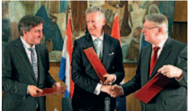
De defensie ministers Halsdorf, De Crem en Hillen (v.l.n.r.), bij het ondertekenen van de Benelux-overeenkomst op 18 april 2012

de structuur is echter dat de krijgsmachtdelen verder vorm kunnen geven aan de samenwerking. Elk krijgsmachtdeel krijgt analoog aan de Benesam-stuurgroep een overkoepelende werkgroep. Verder wordt verwacht dat er voor bepaalde aspecten ook functionele werkgroepen zullen moeten komen (zie figuur 1 op pag. 584).