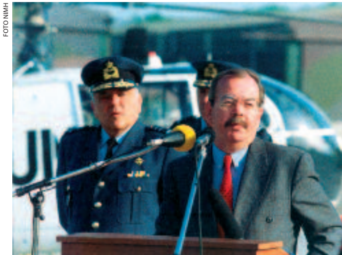
Minister Ter Beek was bereid de bevelhebbers meer invloed te geven als dat tot reorganisaties kon leiden

Volgens de Winter was een personeelsreductie van twintig tot vijftwintig procent noodzakelijk om de krijgsmachtdelen te dwingen tot herstructurering. 13 De minister was het met hem eens en ging akkoord met de personeelsreducties. 14