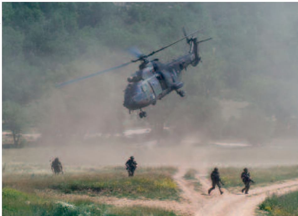
Door de Defensienota 1991 wist de Nederlandse krijgsmacht zich relatief snel aan te passen aan de periode na de Koude Oorlog en ging zij deelnemen aan een bijna onafgebroken reeks van operaties