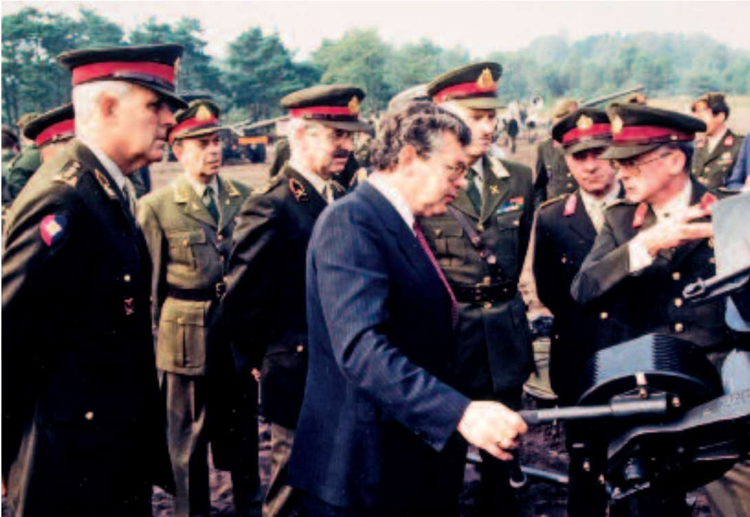
Lange tijd is de Defensienota van 1991 gezien als een 'overwinning' van de krijgsmachtdelen, maar dat beeld verdient nuancering