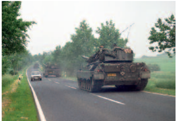
Met het einde van de Koude Oorlog kwam de legitimatie van de bestaande krijgsmacht onder druk te staan