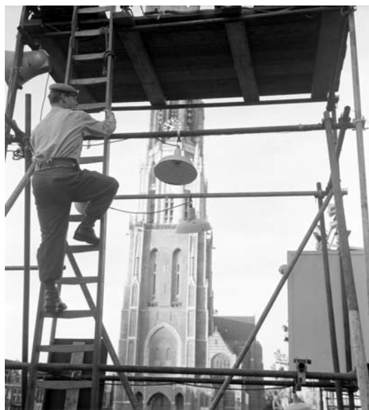
Opbouw van de tribunes en de technische installaties voor de taptoe Delft, augustus 1961