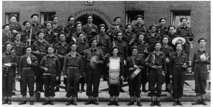
Stoottroepenkapel, Nijmegen, eind jaren veertig

Aan het eind van de brief pleit Hasselman ervoor dat er bij de taptoe Delft vooral Nederlandse marsmuziek wordt uitgevoerd. De taptoe is een Nederlandse traditie en daar horen zijns inziens geen buitenlandse marsen op het programma te staan.