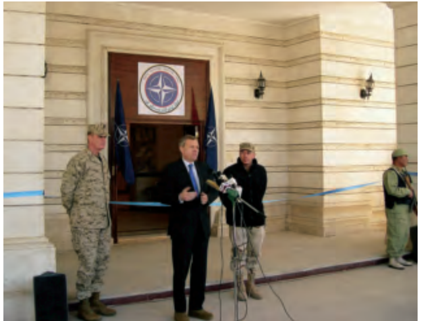
Persconferentie door de secretaris-generaal van de NAVO, De Hoop Scheffer