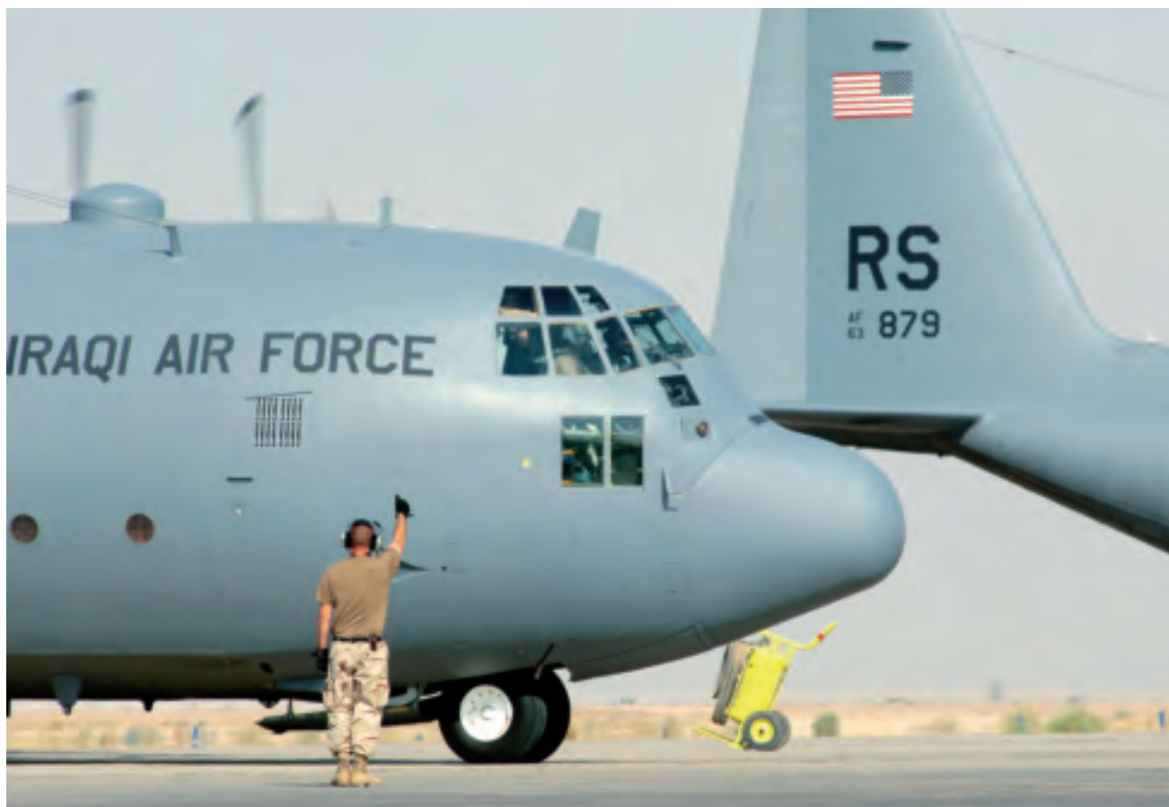
Training van de Irakese crew op Ali Base, Irak, 2005

NTM-I bij het oprichten van het Training, Education and Doctrine Center in Ar Rustamiyah. Met het starten van de junior en senior stafcursussen op het IMAR is deze fase in september 2005 ingegaan.