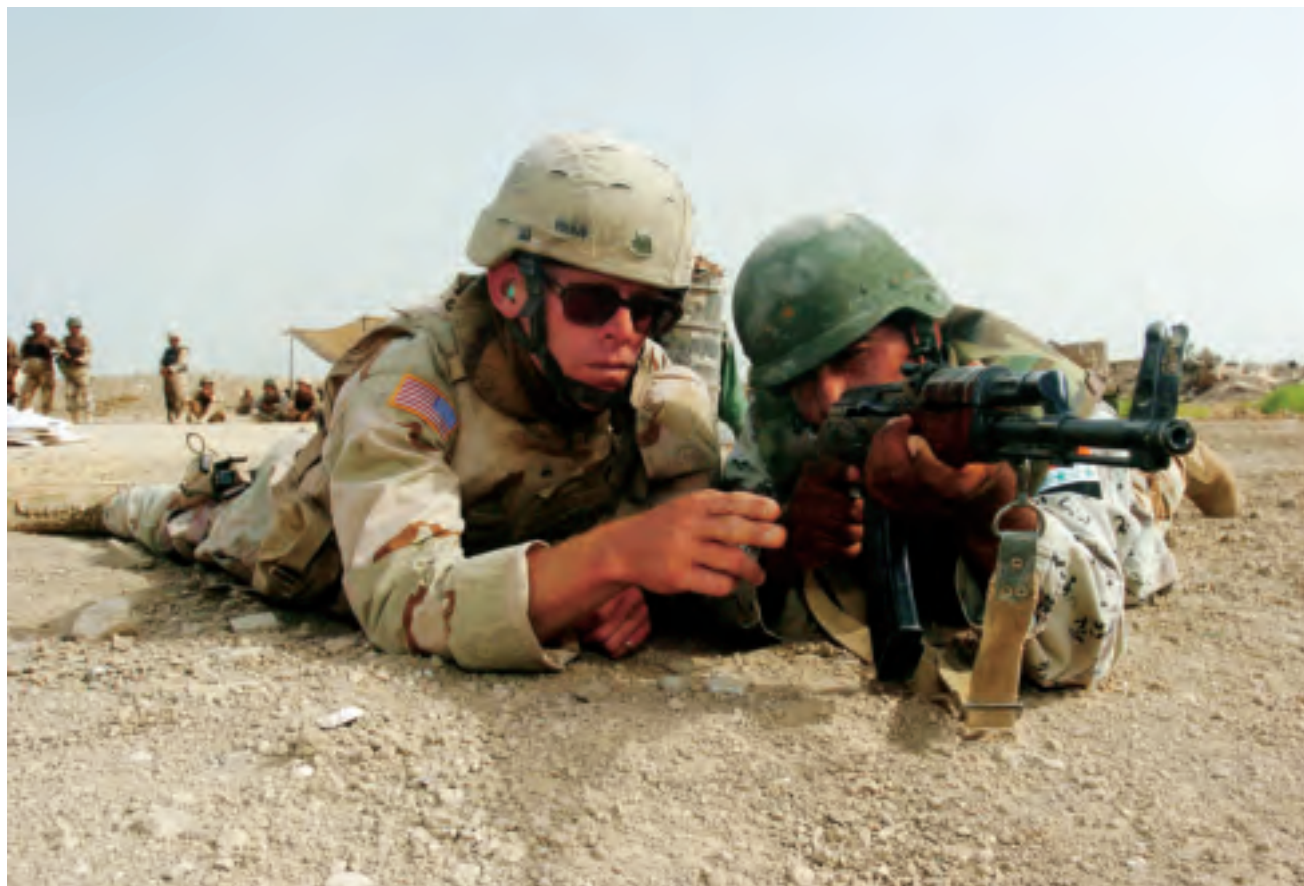
Wapeninstructies op de 'Forward Operating Base' in Iskandariyah, Irak, 2005

In de voorgaande tekst heb ik de Multinational Security Transition Command-Iraq (MNSTC-I) een aantal malen genoemd. Het succes van NTM-I is voor een belangrijk deel afhankelijk van de medewerking van en samenwerking met dit commando. Een aparte paragraaf over deze organisatie