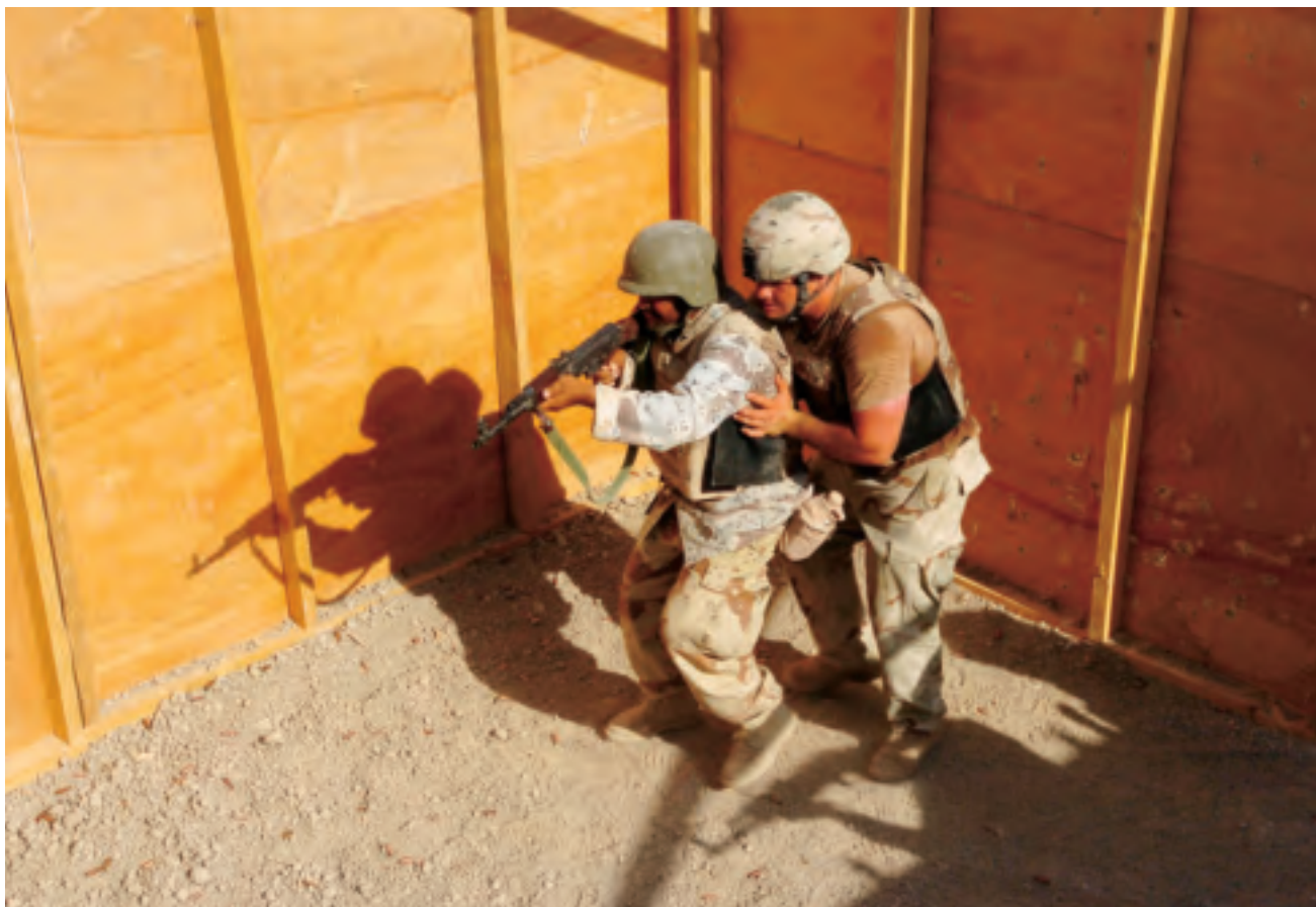
Een medewerker van het Amerikaanse 'Multinational Training Team' traint Irakese militairen