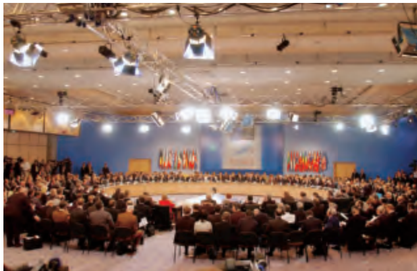
De NAVO-top in Istanbul, 28 en 29 juni 2004

In dit artikel schets ik kort de voorgeschiedenis van NTM-I, vervolgens de opdracht, taken en fasering zoals opgedragen door Supreme Allied Command Europe (SACEUR), daarna de organisatie en de locaties van deze