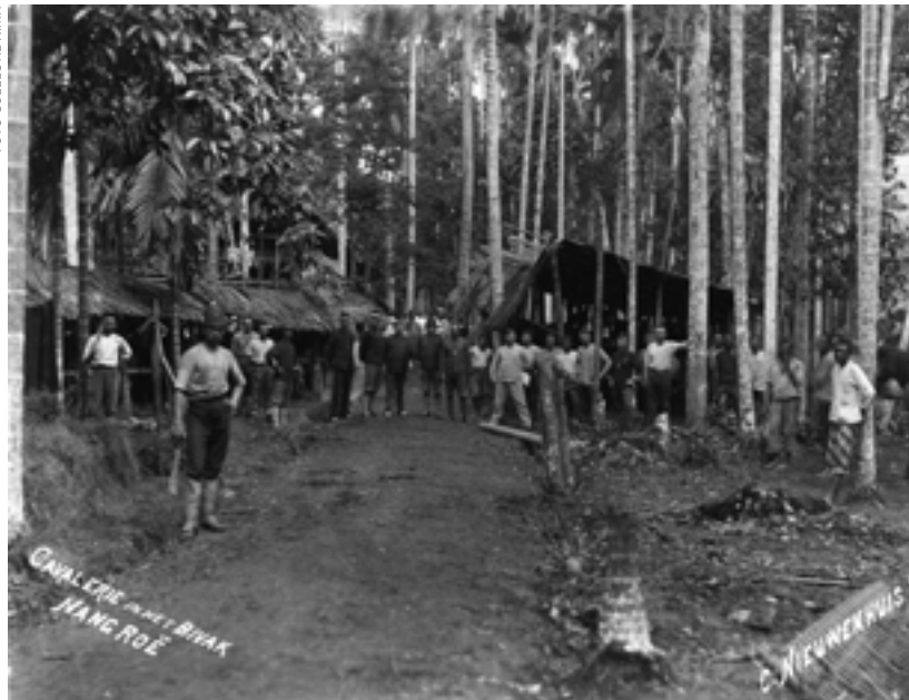
Cavalerie van het KNIL in bivak op Atjeh, circa 1880

stellen dat Snouck beslist geen aanhanger was van hearts and minds. Eerst onderwerpen door middel van een krachtig militair optreden, dat was Snoucks boodschap – en Van Heutsz was er snel bij om die op te pakken.