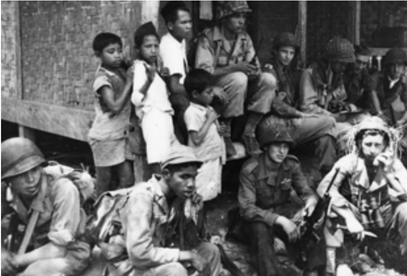
Militairen van het Korps Speciale Troepen tijdens een actie op Java

Voor hearts and minds of tache d'huile was in het verleden geen plaats. De vele gedaanten waarin verzet en opstand zich hulden werden stevast met een militaire benadering tegemoet getreden. Daar kwam bij dat civiel gezag vaak en voor lange tijd in handen van militairen lag.