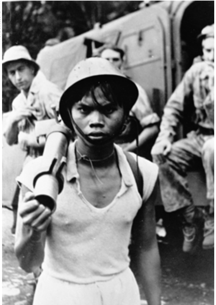
Tijdens de Tweede Politie Actie gevangen genomen Republikeinse strijdster, Java, 1948

de onervaren militairen, zowel de rekruten van het herrezen KNIL als de oorlogsvrijwilligers en dienstplichtigen uit Nederland, vertrouwd te maken met de oude, Indische tactiek. Het VPTL bevatte genoeg tips die hun betekenis nog hadden behouden, maar het had als voorschrift onvoldoende kwaliteit om dienst te doen in een grootschalige volksoorlog.