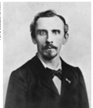
Ch. Snouck Hurgronje