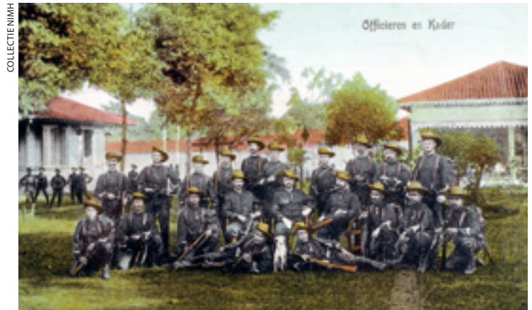
Korps Marechaussee op Atjeh, 1912

Het leger kende heel wat van zulke commandanten. Het zijn hun acties die we eigenlijk zouden moeten bestuderen in de militaire geschiedenis, maar waar we ten gevolge van een gebrek aan materiaal vaak niet in slagen.