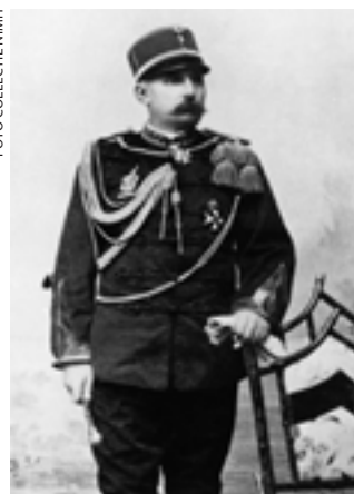
J.B. van Heutsz

zijn rapport uitbracht, publiceerde Van Heutsz een brochure waarin hij pleitte voor een meer offensieve benadering om de oorlog in Atjeh snel tot een einde te brengen. 8 Snouck adviseerde Van Heutsz gedurende een aantal jaren, en wist